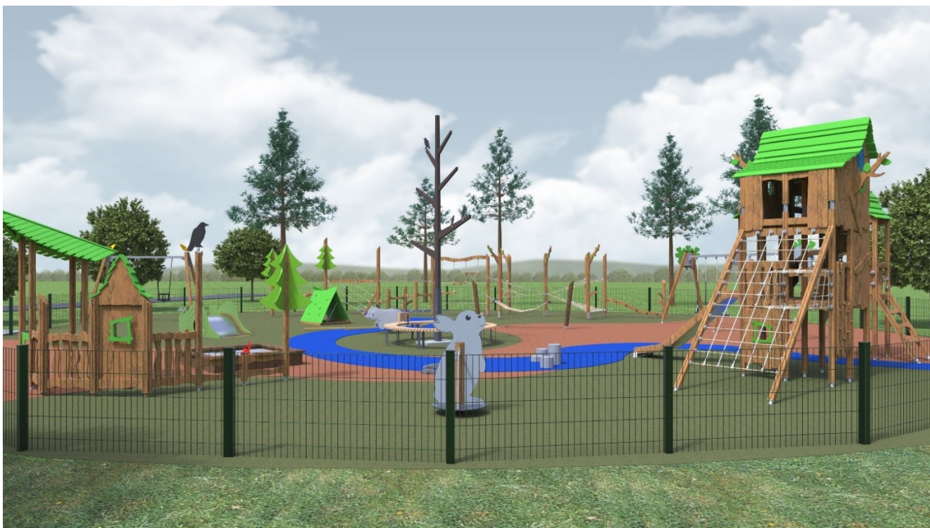
Havainnekuva Raakkulan leikkipuistosta.

Vaakunakylän ja Lehtokylän väliin ennallistettava Holstinpuronpuisto rakennetaan hulevesien hallinnan rinnalla myös kuntalaisten virkistyskäyttöön. Nykyisiä hyväkuntoisia metsäsaarekkeitä säilytetään ja alueelle istutetaan lisää lehti- ja havupuita. Käsiteltävät alueet rakennetaan niityksi tai hulevesikasvillisuusalueiksi. Puistoon rakennetaan sorapintainen polku ja metsäretki-temainen leikkipaikka.