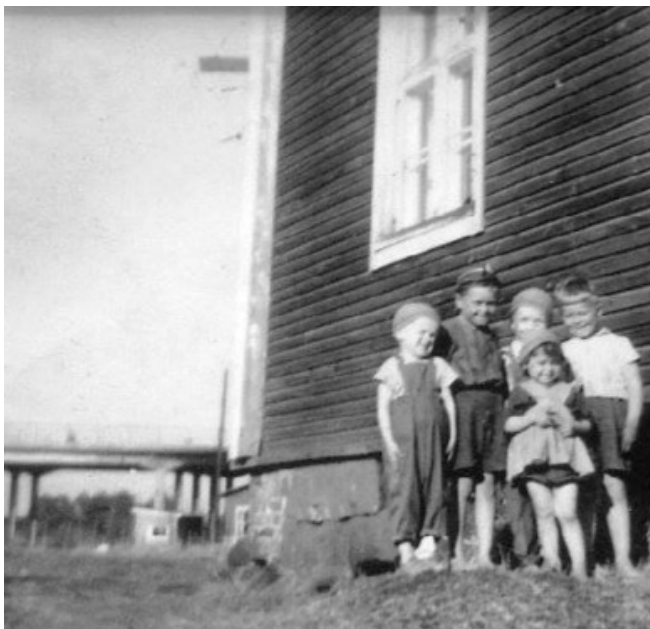
Lapsia nykyisen kaupunginvarikon alueella vuonna 1950, taustalla Toppilaan johtava silta. Kuva Tauno Hämäläinen, julkaistu kaupunginvarikon rakennushistoriaselvityksessä (2018).

Monet muistelevat lapsuuttaan Hietasaaren, Vaakunakylän ja Tuiran alueella suurella lämmöllä. Hartaanselän vesissä ja rannoilla on vietetty maailman parhaita lapsuuden kesitä! Lapsena ongittiin sillan kupeessa, leikittiin piilosta ja sotaleikkejä, urheiltiin sekä tehtiin jos jonkinlaisia kepposia. Hartaanselän rannat peilaavat muistoja myös uimisesta, tukkien sortteerauksesta ja Toppilan satamaan saapuneista vierasmaalaisista aluksista, joita käytiin katsomassa pyhävaatteissa tai silloin, kun isommille pojille piti pummata tupakkia. Hartaanselän rannoilta riittää tarinoita kalansaaliista ja Tukkiisaaren rantaan ajautuneista ruumiista!