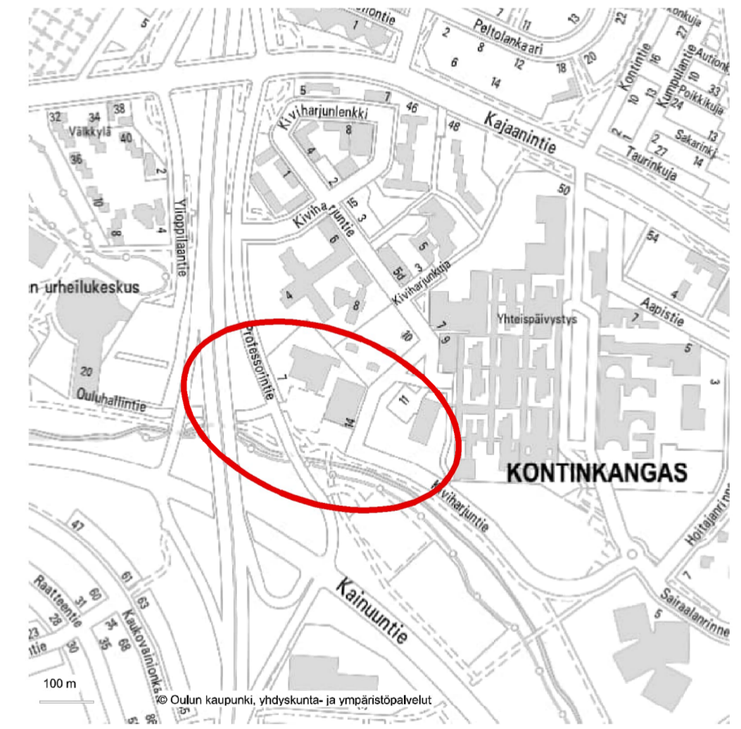
Tiimerkinnöistä oma piirustus "LYK 2023_0055 Liik3 (R8-3)"