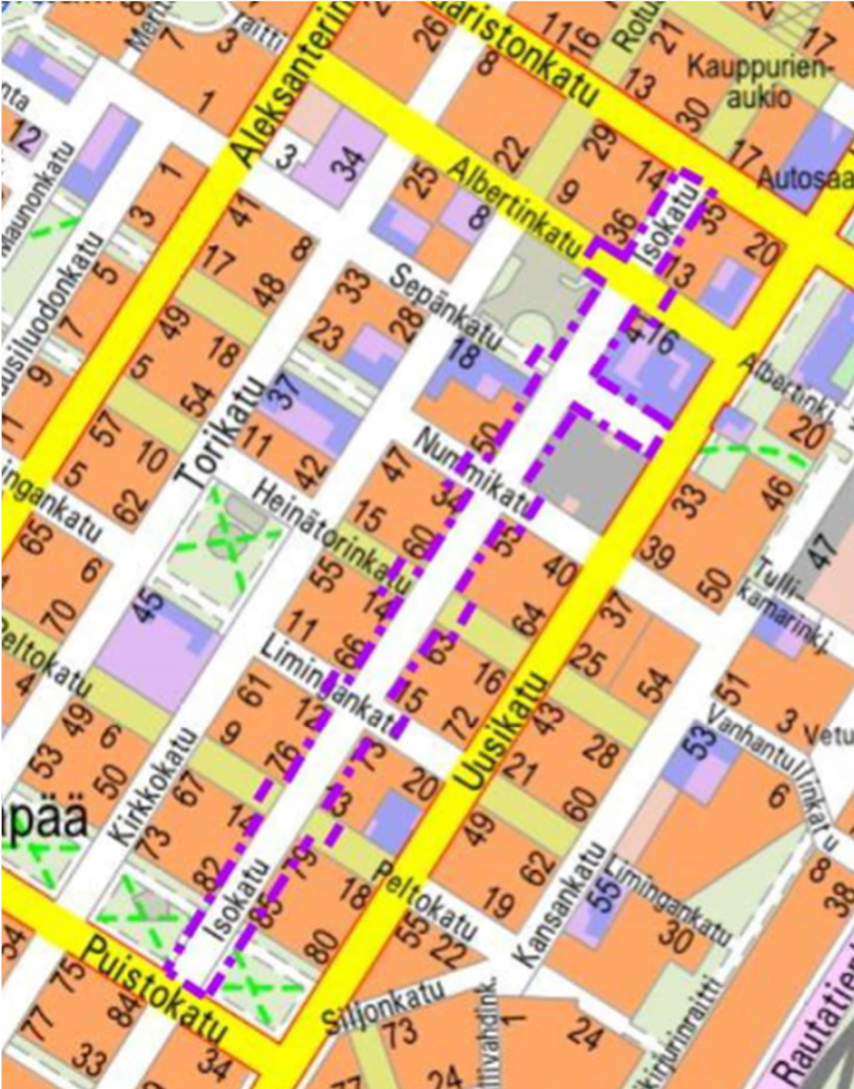
Aluerajaus ©Oulun kaupunki, Yhdyskunta- ja ympäristöpalvelut

lähetämme osallistumis- ja arviointisuunnitelman tiedoksi isännöitsijöiden välityksellä kaikille kiinteistöjen omistajille, asukkaille ja niissä toimiville yrityksille, sekä niille viranomaisille, yhdistyksille ja yhteisöille, joiden toimialaa rakentaminen alueella koskee.