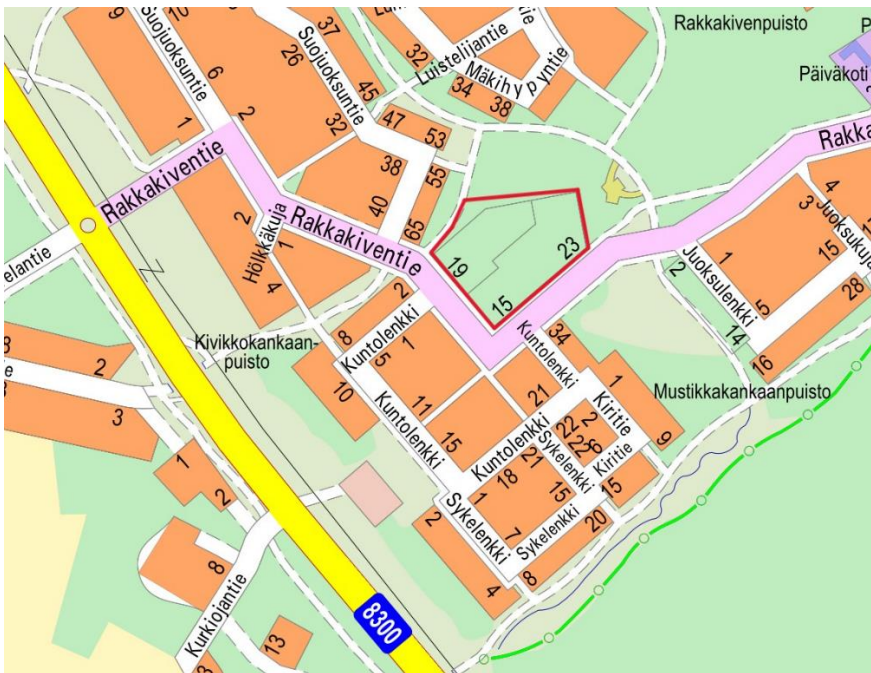
Kuva 1. Suunnittelualue.

Alueella on voimassa asemakaava (asemakaavatunnus 564–1998, voimaantulo pvm. 20.05.2011). Korttelia 15 (Rakkakiventie 13,15,17,19 ja 23) koskeva asemakaavan muutos (asemakaavatunnus 564-24789 on ollut vireillä samanaikaisesti korttelin 15 katusuunnittelun kanssa ja kaavaehdotuksen pohjalta laadittu katusuunnitelma asetetaan nähtäville kaavan hyväksymisen jälkeen.