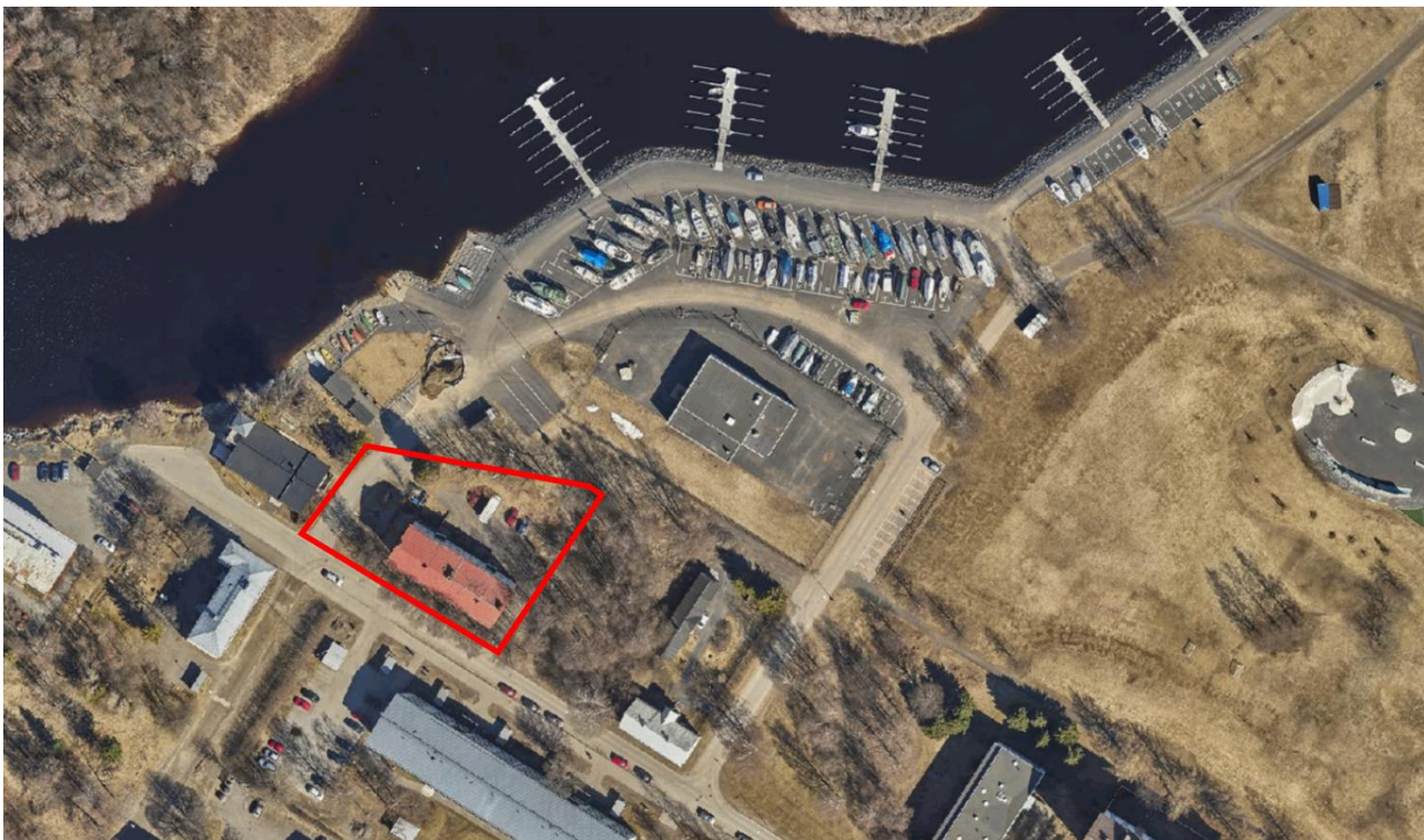
Kuva 2 Ortoilmakuva (Oulu 2020). Suunnittelualueen likimääräinen raja on lisätty kuvaan punaisella viivalla.

Suunnittelualueita rajaa lounaispuolella Puistokatu ja pohjoispuolella Hollihaan venesatama. Kaakkoispuolen tontilla 11 on käynnissä asemakaavan muutos (564-2238), jonka tavoitteena on toteuttaa tontille kuusikerroksista asuinkerrostalorakentamista rakenteellisella pysäköinnillä. Suunnittelualueen lähiympäristössä on kerrostaloja, opiskelija-asuntola, varastorakennus, Hollihaan ulkokuntoilupiisto ja lasten liikennepiisto, Oulun Vesi -liikelaituksen jätevesipumppaamo sekä Stora Enson Oulun tehdas.