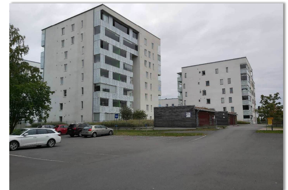
Kuva 6. Selvitysalueen eteläpuolella on uudisrakennuksia, joiden piha on rajattu metalliaidalla.