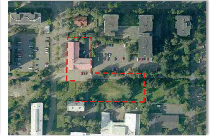
Ilmakuva vuodelta 2009.