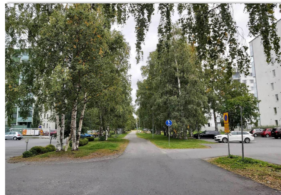
Kuva 5. Etelätarhan polkua selvitysalueelta itään päin katsottaessa rajaa koivukuja, joka on maisemallisesti tärkeä. Koivuja on täydennysistutettu kaadettujen tilalle.