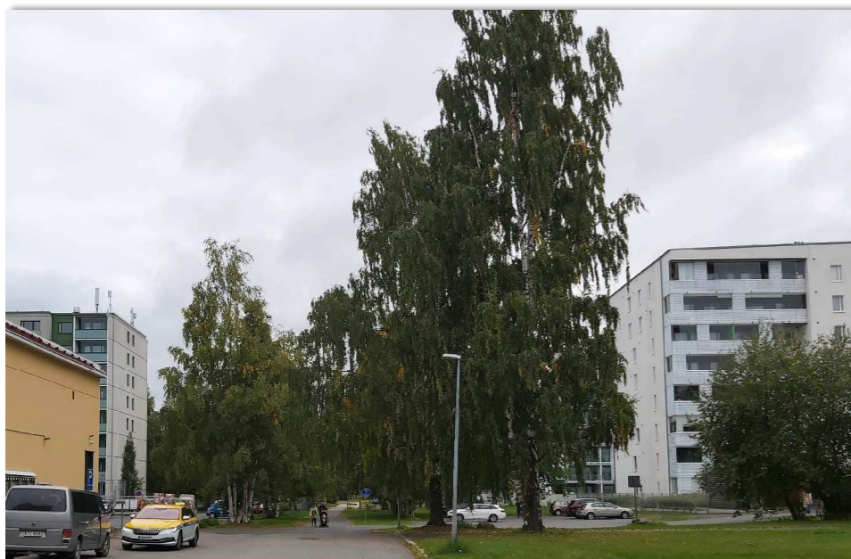
Kuva 4. Kuvassa etualalla maisemallisesti arvokkaat koivut.

Selvitysalue rajautuu lännessä Kalliotiehen ja Kalliopolkuun. Selvitysalueelta on näkymät Lassinpuiston leikkipaikalle (kuva 1.), Lassinpuistoon (kuva 2.) ja Kalliotielle (kuva 3.).