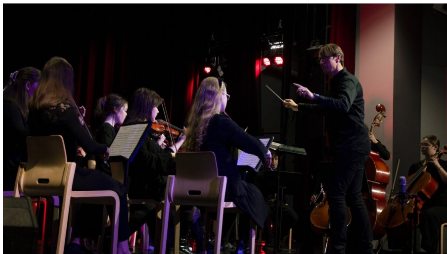
Madetojan musiikkilukion oma sinfoniaorkesteri ei petä vaan yllättää yhä kauniimmalla esityksellään .