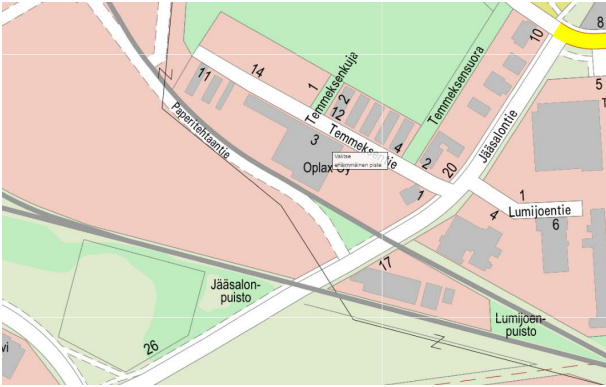
Kuva 1. Suunnittelualue opaskartalla

Jääsalontielle suunnittelualueen molemmissa päissä on junaradan tasoristeys. Tasoristeysten raitteet ovat ORI 501 ja OL 201. Jääsalontien yli kulkee suunnittelualueella 110 kV ilmajohtolinja.