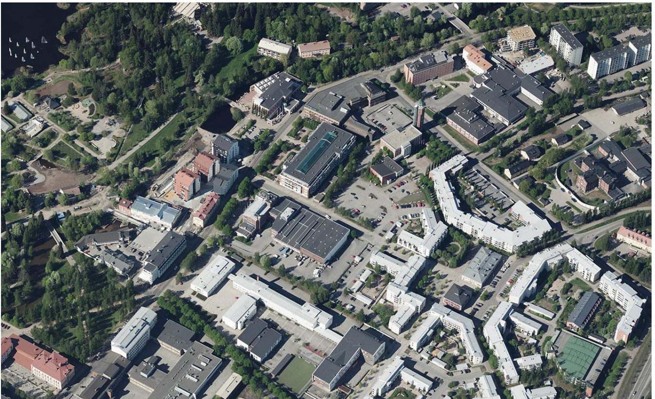
Kuva 6. Viistokuva asemakaavan muutosalueelta.

Sähköpostit ovat muodossa etunimi.sukunimi(at)ouka.fi