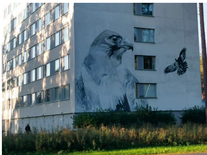
Kaukovainiolla Sivakan kerrostaloon vuonna 2020 toteutettu Kanahaukka . Taiteilijana Timo Tynnismaa . Muraali sijaitsee Kanahaukantie 2:ssa ja näkyy hyvin Merikotkantielle.

Muraaleiden toteuttamista on vältettävä asuintalojen ikkunoiden tai pääjulkisivuun aukotuksen