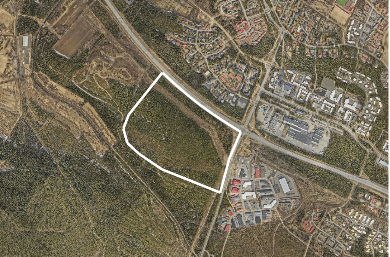
Kuva 3. Ilmakuva suunnittelualueelta 7.5.2020. Asemakaavoitettava alue on rajattu yhtenäisellä valkoisella viivalla.

Alueella ei ole voimassa olevaa asemakaavaa.