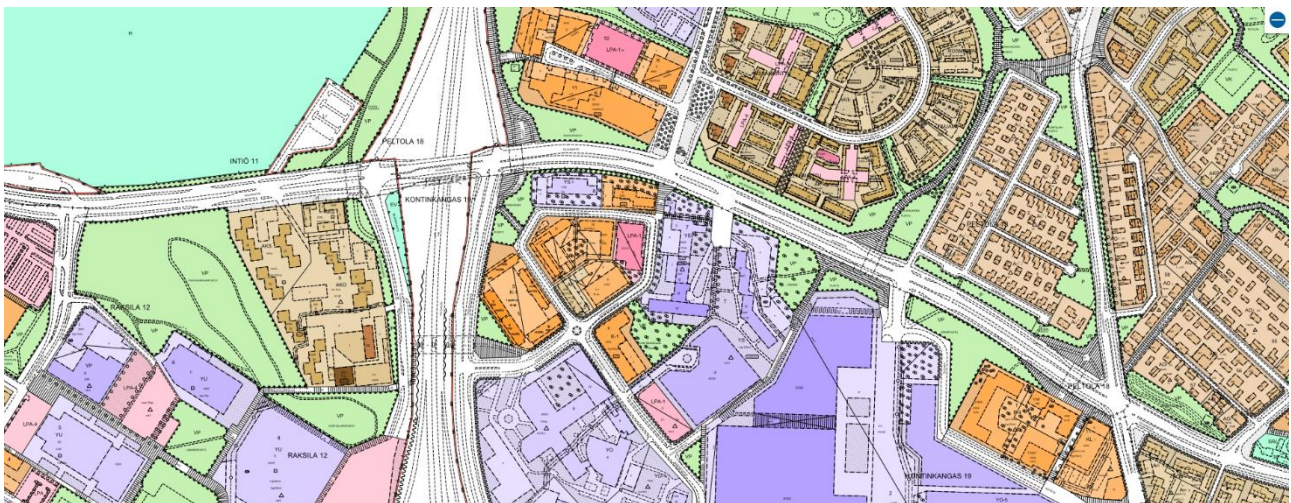
Kuva 2. Ote ajantasa-asetuskaavasta