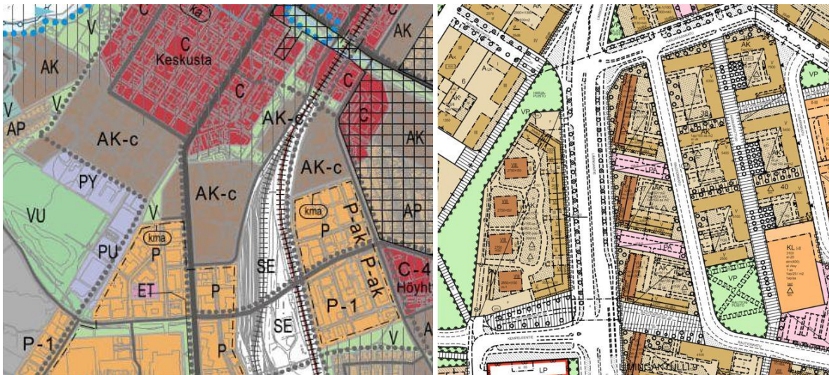
Kuvat: Ote Uuden Oulun yleiskaavasta ja ajantasa-asetmakaavayhdelmästä. (Ei mittakaavassa.)

Kaava-alueen kohdalla on voimassa kaupunginvaltuuston 31.3.2006 hyväksymä asemakaavan muutos (564-1830), jossa alueelle on esitetty enintään kuusikerroksisia asuinrakennuksia, joiden maantasokerroksessa on muun muassa liike-, toimisto- tai harrastetiloja.