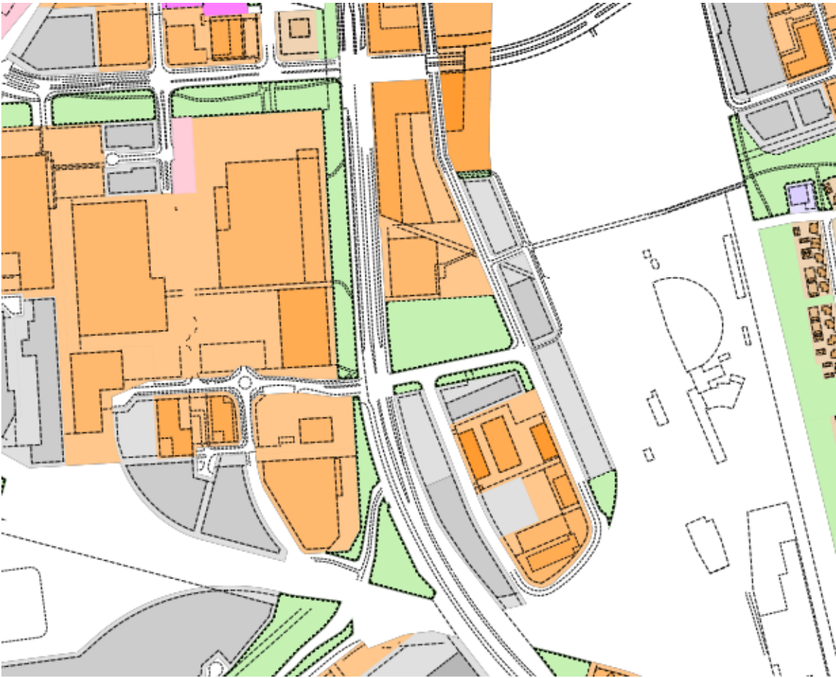
Asemakaava ©Oulun kaupunki, Yhdyskunta- ja ympäristöpalvelut