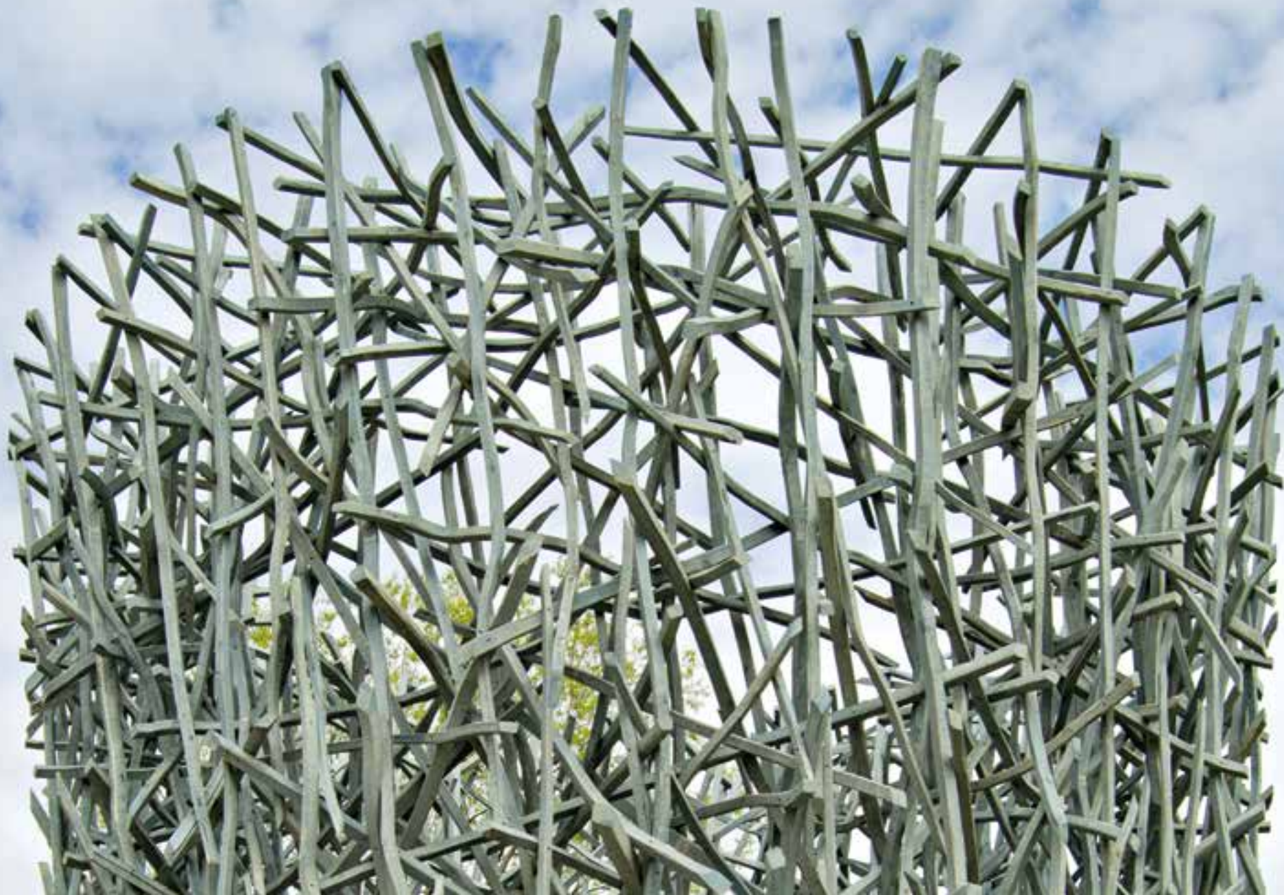
Jaakko Pernu, Vesilasi, 2012, pajurimat, Lyötynpuisto