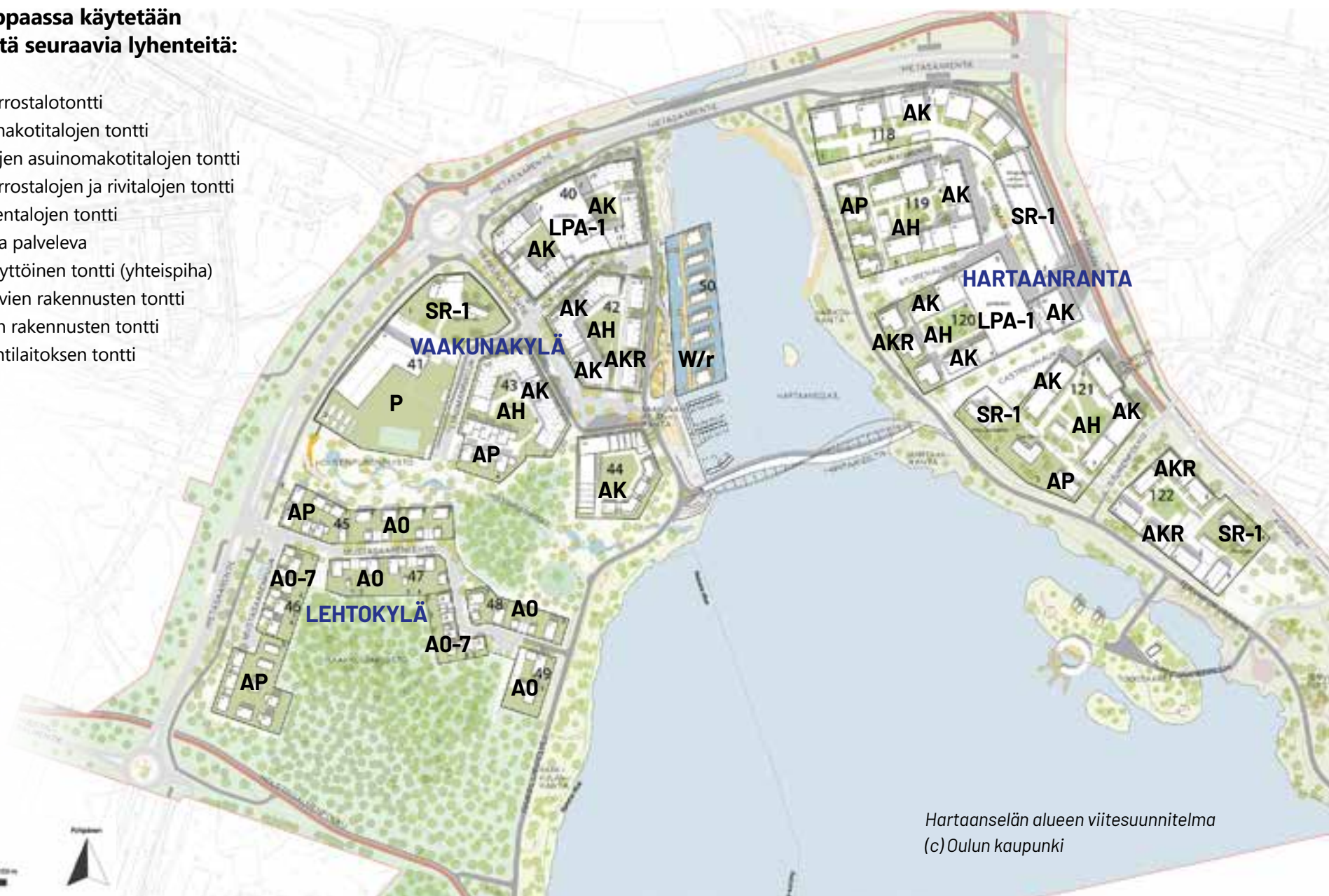
Hartaanselän alueen viitesuunnitelma (c) Oulun kaupunki