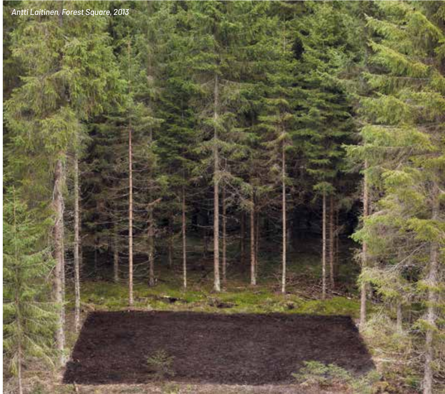
Antti Laitinen, Forest Square, 2013

“ Ympäristöteoksia voidaan tehdä täysin luonnon materiaaleista, jolloin ne aikaa myöten häviävät ja muuttuvat osaksi luontoa. ”