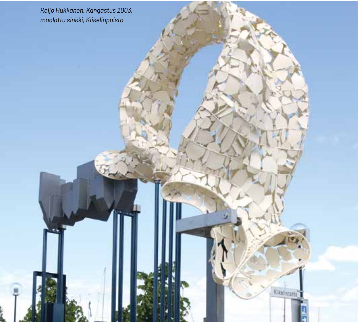
Reijo Hukkanen, Kangastus 2003, maalattu sinkki, Kiihelinpuisto

Taide voi olla integroituna kävely- ja katupintojen materiaaleihin, se voi olla osa näille alueille sijoittuvia toiminnallisia rakenteita tai vaikkapa vain tavallisesta poikkeava värisommitelma. Rakennuksiin integroituna taide voi olla myös osa yksittäisen rakennuksen tai useamman samassa korttelissa olevan rakennuksen julkisivua jatkuen katu- ja/tai piha-alueelle. Valotaiteen avulla voidaan korostaa rakennusten julkisivuja.