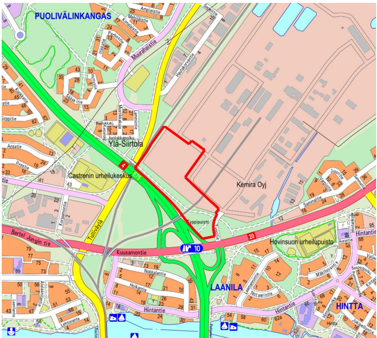
Kuva 1 Kartalla esitetty asemakaavan muutosalue yhtenäisellä punaisella viivalla.

Takalaanilan kaupunginosassa, osoitteessa Typpitie 1, on tullut vireille asemakaavan muutos. Asemakaavan muutoksen tavoitteena on mahdollistaa korttelissa 3, kaupungin määrälän mukaisella alueella, teollisuus-, tuotanto- ja työpaikkatoimintoja sekä teollisuusalueella jo olevia toimijoita palvelevia toimintoja. Alueella pyritään lisäksi mahdollistamaan polttonesteen ja -kaasun jakeluasema. Suunnittelualuetta on hoidettu metsätalous- ja suojaviheralueena, eikä siellä sijaitse inventoituja maisemallisesti tai kulttuurihistoriallisesti arvokkaita kohteita.