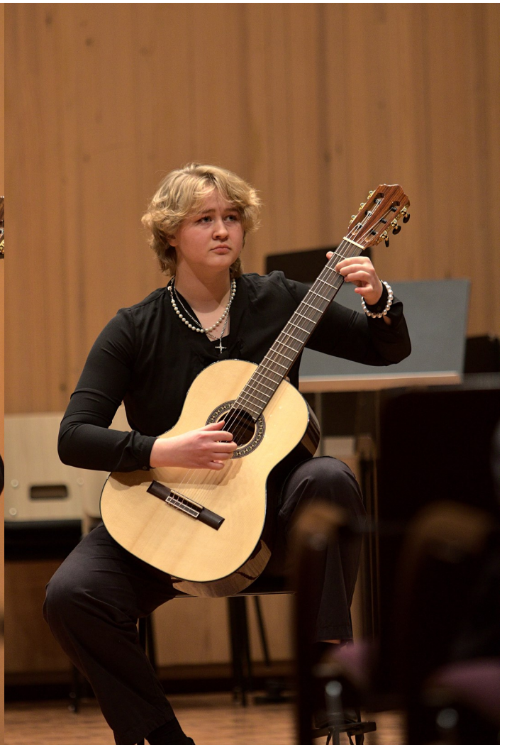
Konserttien aikana klassisen kitaran kaunis ääni täytti Tulindbergin salin moneen kertaan