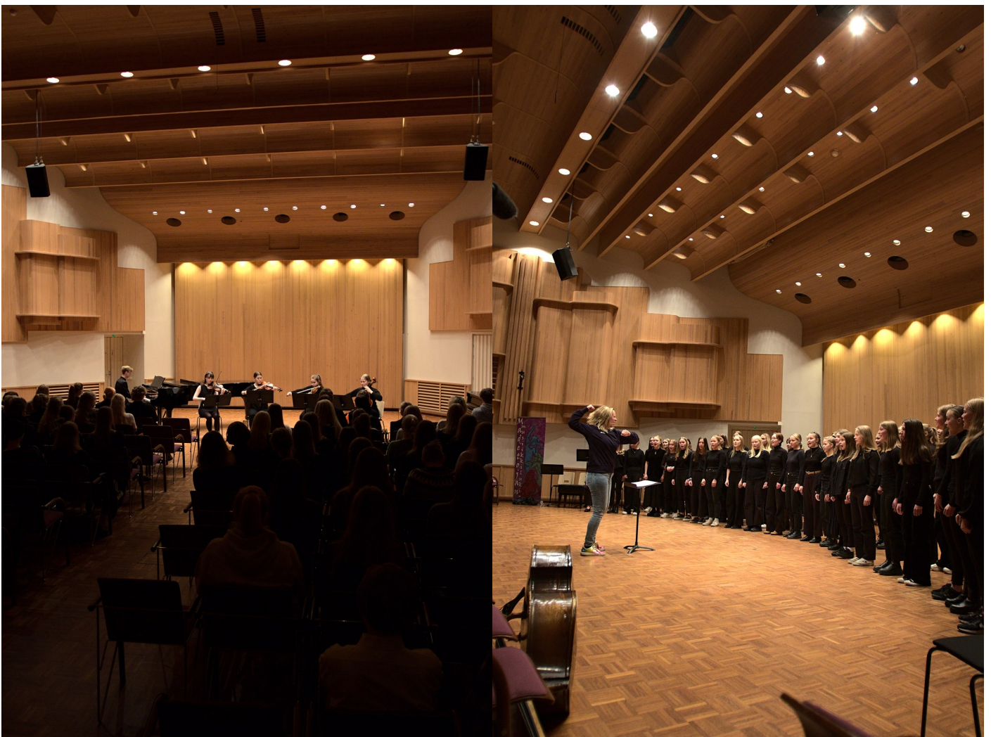
Madetojan musiikkilukion tyttökuoro esiintyi viimeisenä, muttei vähäisempänä