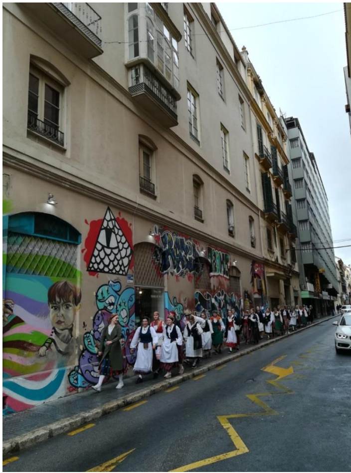
Kansallispuvut keräsivät katseita kadulla.