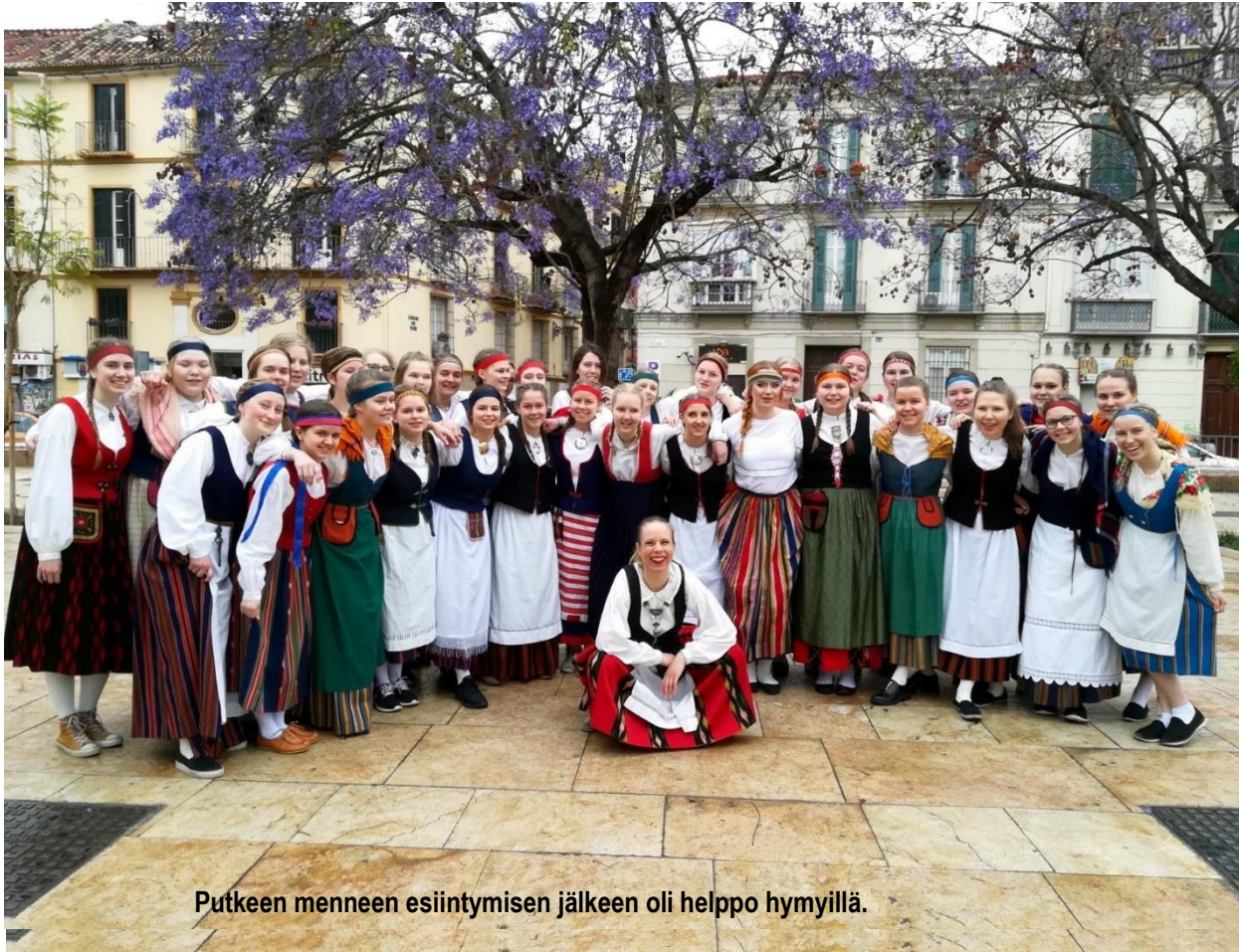
Putkeen menneen esiintymisen jälkeen oli helppo hymyllä.