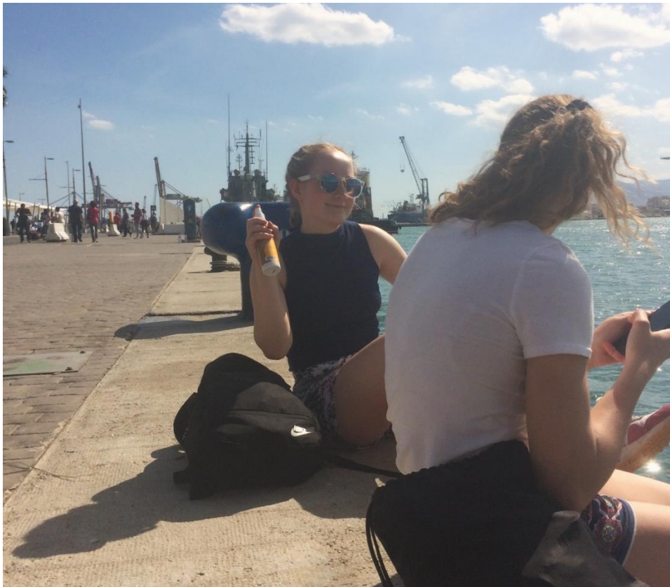
Aurinkoisesta säästä otettiin kaikki ilo irti.