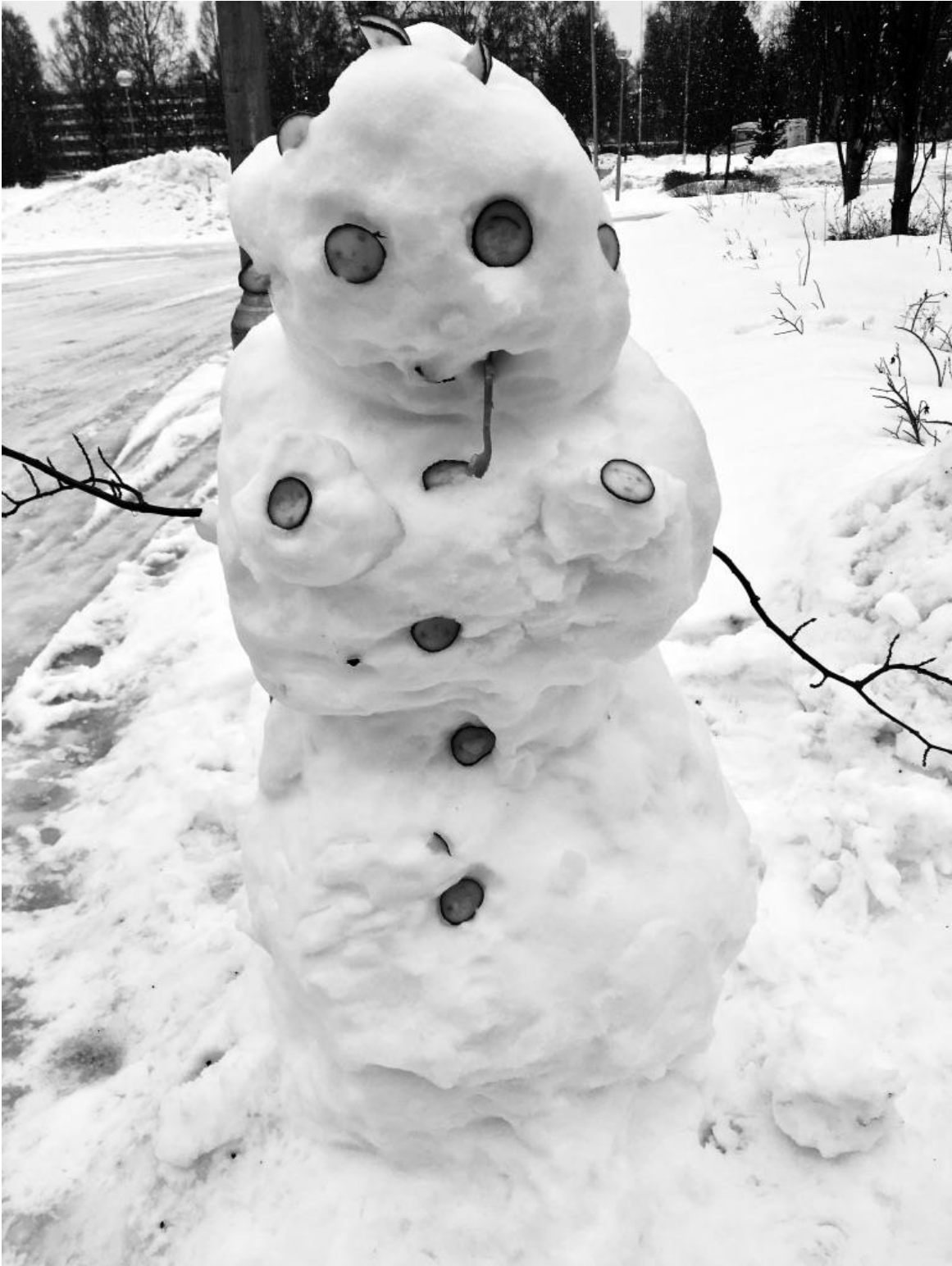
R.I.P. Herra Herbert I.