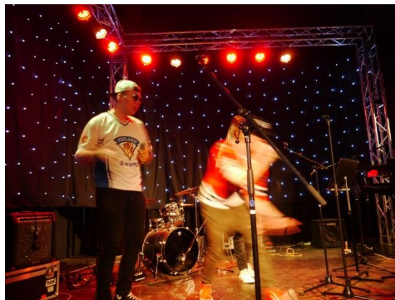
Ylhäällä vasemmalla lavan on vallannut Extreme Sexdream. Vieressä riehuu ilmeisen urheilullinen KVG. Keskellä tunnelmoidaan abipotpuria ja alhaalla rokkaa aina yhtä sykehdyttävä OPKH Bigband.