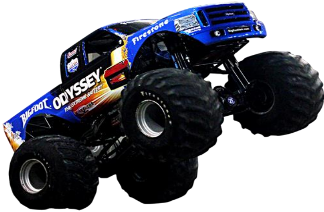
(Kuvassa Mandyn monsteriauto)

Poliisiasema oli kaukana. Moottoripyörä kiihtyi nopeasti, mutta pitkällä aikavälillä Mandyn monsteriauto saisi heidät kiinni. Andya ja Leenaa pelotti. Oli tehtävä jotain huikeaa. Andy huusi Leenalle: "Pidä kiinni!". Hän painoi jarrun pohjan, teki mahtavan L-käännöksen ja ajoi metsään. Andy ja Leena ampaisivat juoksuun sankassa metsässä. Mandy seurasi heitä pian monsteriautollaan ja puut kaatuivat vahvan pedon edessä. "Leena mene piiloon!" Andy huusi ja tönäisi Leenaa, joka kaatui ja löi päänsä kiveen. Andy kiipesi apinamaisella ketteryydellä korkeaan kuuseen ja päästi karmaisevan sota-huudon "HAJAA!". Hän hyppäsi monsteriauton konepellille ja syöksyi tuulilaisista läpi. Mandy kiljui ja raapi Andya. Andy kuitenkin sankarillisesti kolkkasi Mandyn tekemällä karate-iskun. Mutta voih! Mandyn jalka painoi yhä kaasua ja Andy tanssi voitontanssiaan liian rajusti huomatakseen edessä lähestyvät Murmelinputoukset. Leena palasi tajuihinsa vain nähdäkseen elämänsä rakkauden ja hullun naapurinsa putoavan 1000 kilometriä alla olevaan Murmelijärveen. "ANDYYYYYYYYYYYYYYYY", hän huusi ja lähti syömään.