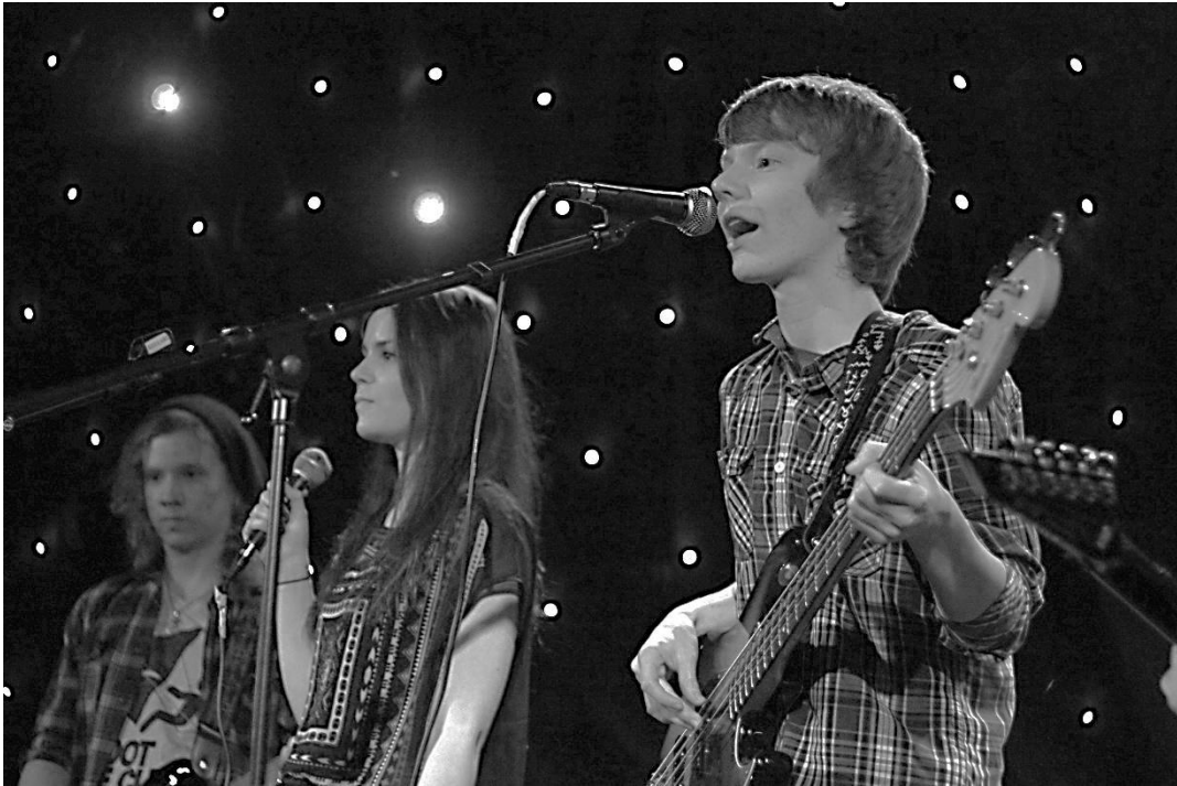
Ensimmäisen vuoden opiskelijoista koostuva yhtye Sebastian