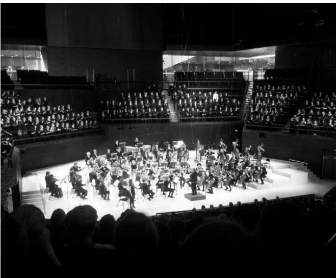
Musiikkilukiopäivien päätöskonsertti Musiikkitalossa.

Hieno konsertti sekä musiikkilukiopäivät olivat nyt loppuneet, ja kotimatka oli alkamassa. Palasimme takaisin hotelille hakemaan tavaramme ja suuntasimme vihdoinkin kohti koti-Oulua. Matka sujui väsymyksestä johtuen ratkiriemukkaasti, mutta loppua kohden väsähtivät loputkin urhoolliset sankarimme. Kaiken kaikkiaan kuluneet päivät olivat onnistuneet, vaikka järjestäjien päässä asiat olisi voitu hoitaa paremmin. Tapahtuman teema ”luovuuden arkea, arjen luovuutta” jäi hiukan epäselväksi. Ajatuksena teema olisi ollut varmaankin hyvä, mutta toteutus ei ottanut tuulta siipiensä alle. Harmittamaan jäi, ettemme tutustuneet kovinkaan paljon opiskelijoihin muista musiikkilukioista. Potentiaalia musiikkilukiopäivillä oli, ja rahaakin oli ilmeisesti laitettu sileäksi. Matkasta jäi varmasti monelle hyvä mieli ja mukava muisto.