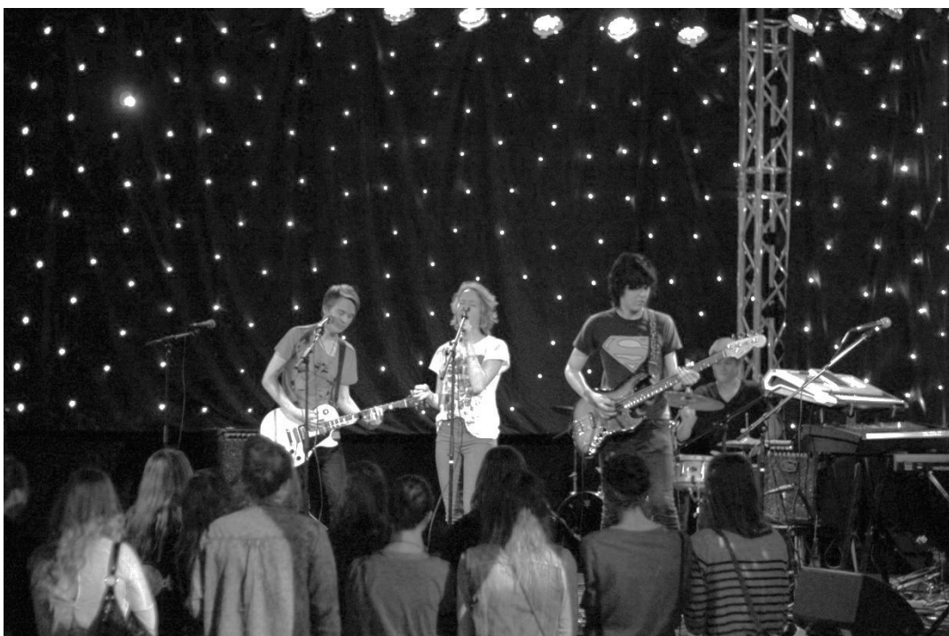
Yhtye Flying Suspect