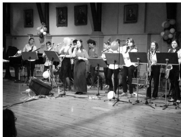
Salsabändi villitsi yleisön.