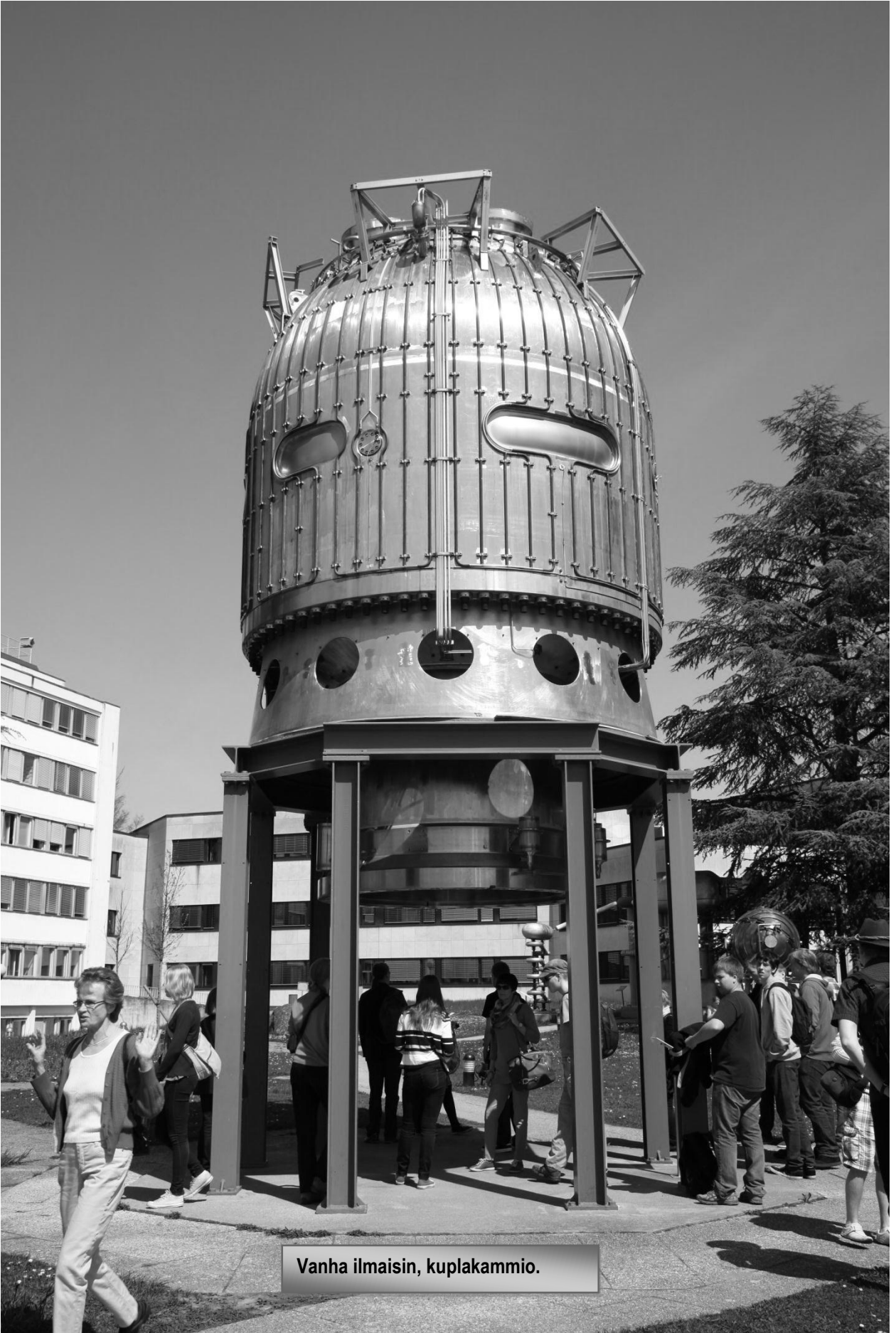
Vanha ilmainen, kuplakammio.