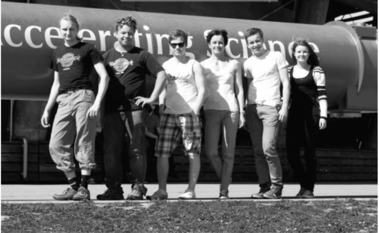
CERNin koko madetojalainen edustus kiihdytinputken edessä.