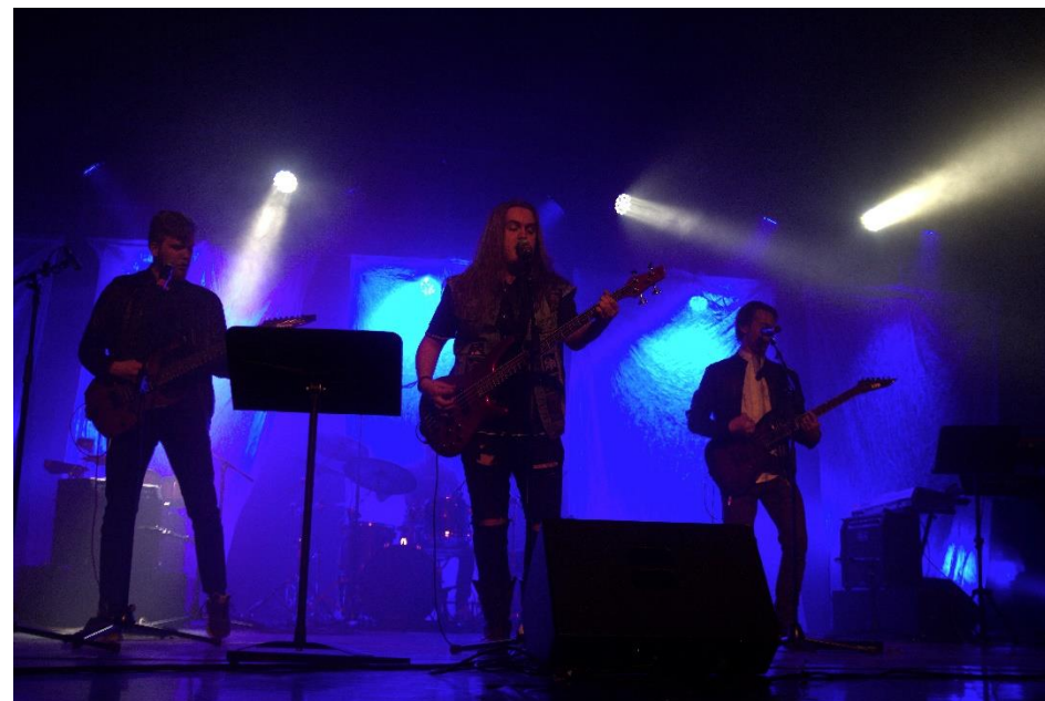
Abiturienttien yhtye Telekastratio soitti läpileikkauksen lukion bändimatkastaan.

Kevään 2019 Madrock jäi varmasti monille mieleen yhtenä mielenkiintoisimmista tapahtumista koko lukuvuoden ajalta.