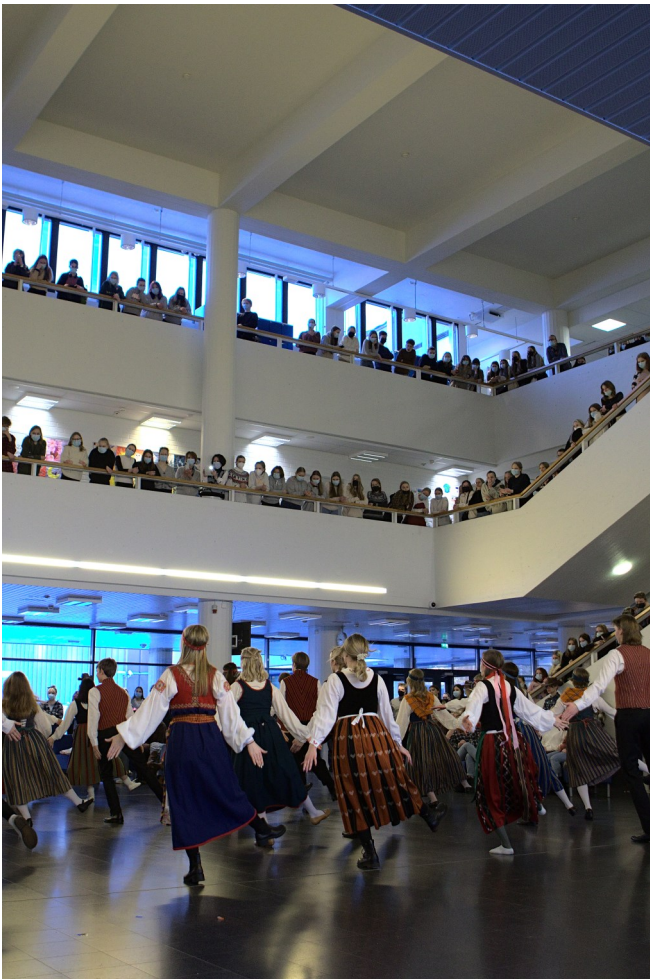
Abitanhuista saivat nauttia kaikki.