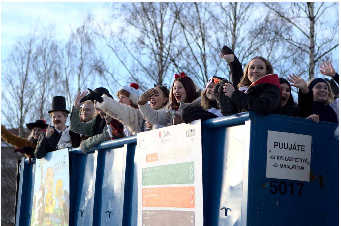
Abit pääsivät vihdoin penkkariajelulle.