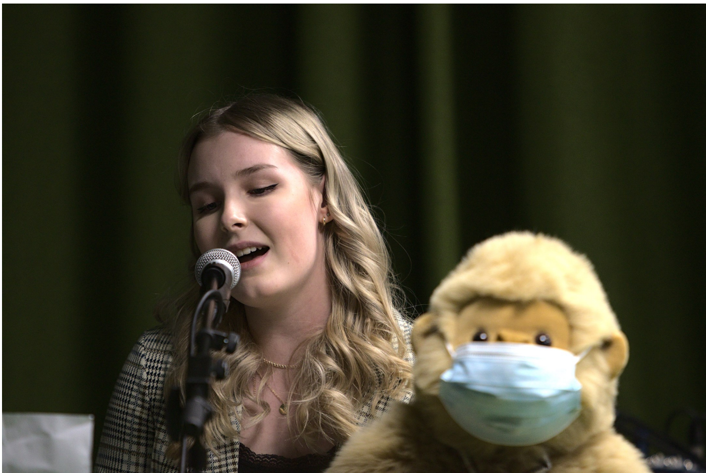
Maunokin pääsi parrasvaloihin.