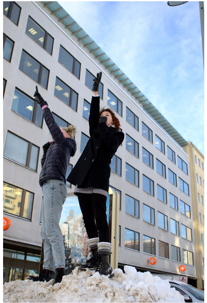
Madislaiset huusivat Lyskan suohon.