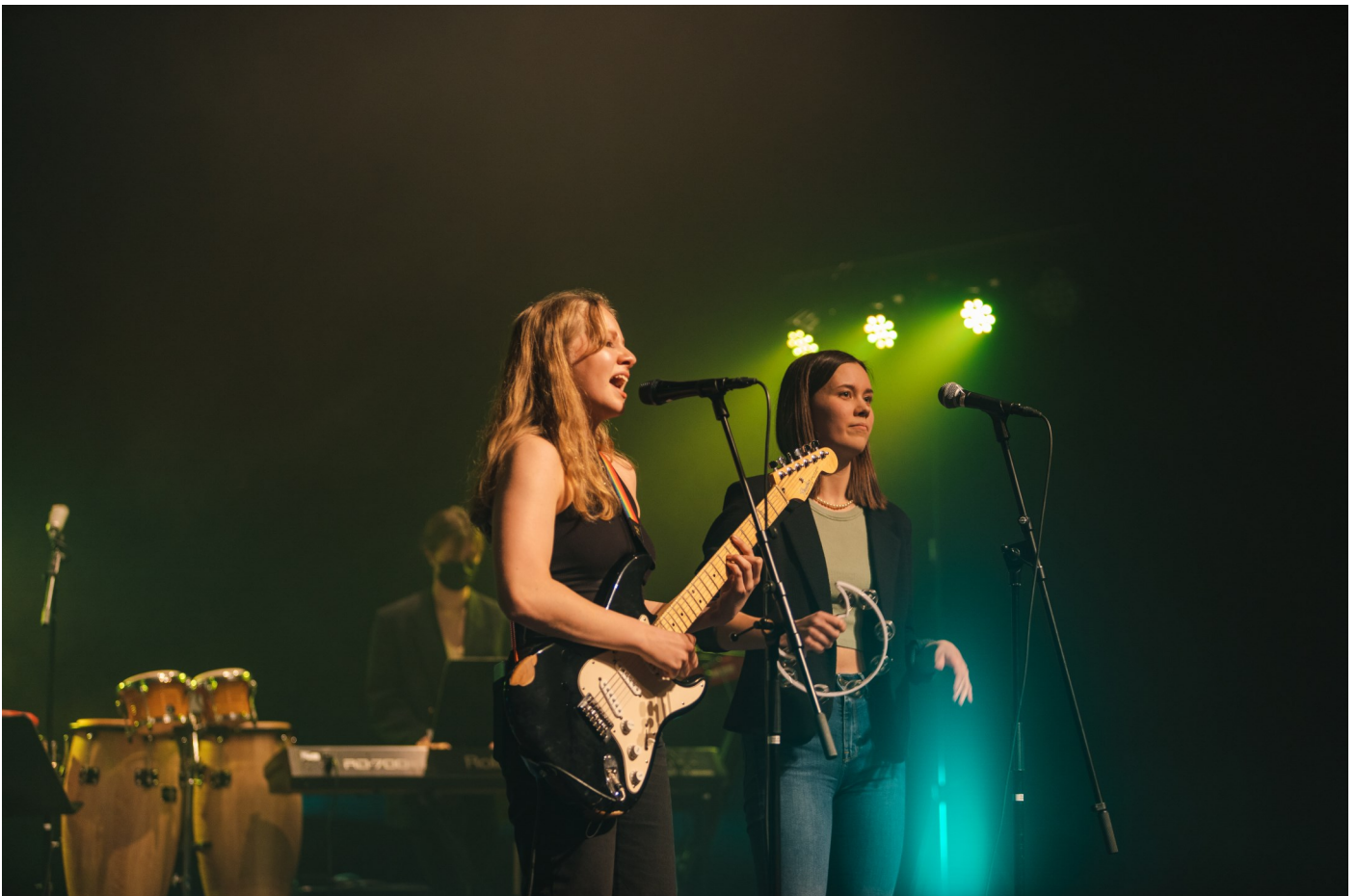
FPEB Kevyen musiikin maratonissa 2022.

"Vaikka ei tähtäiskään tähtitaivaalle niin madiksessa on super kivaa ku saa kokeilla just sellasia juttuja mitkä kiinnostaa ja vaikka ei aina meniskään niin hyvin tai ois just se kaikista lahjakkain, niin täällä kaikki kuitenkin kannustaa ja arvostaa sitä et yrittää! Ja tärkeintä mun mielestä tässä on se, että näät jutut pysyy kivoina eli ku on hyvä fiilis ja kivaa soitella kavereiden kanssa niin hyvin se menee!", kertoo Heikkinen.