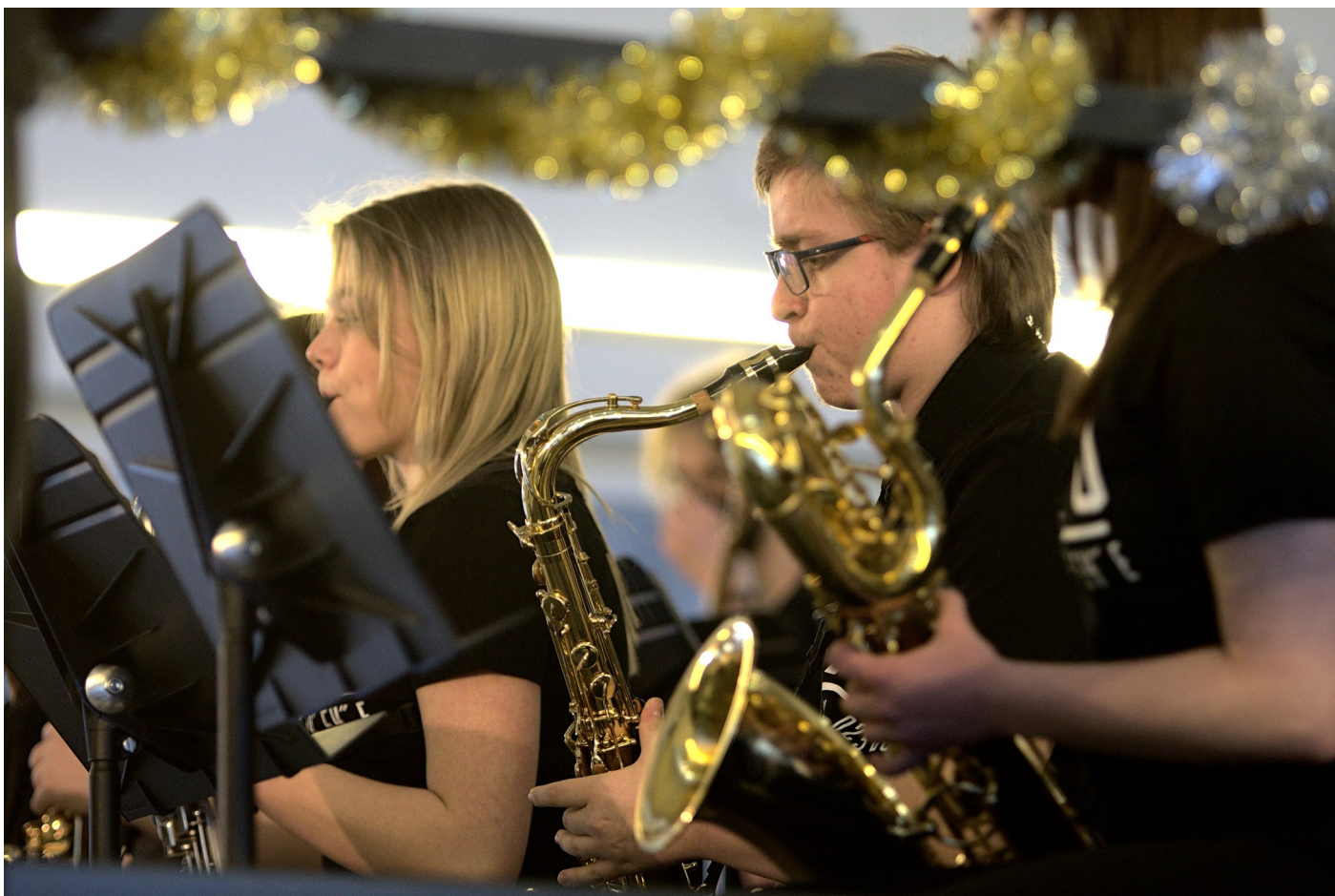
OYJO säesti swingin tahtiin Taiteiden päivänä

Uusi vuosi, uudet kujeet! Madiksella 2022 vuosi on alkanut rytinällä. On ollut Taiteiden päivä, Kevyen musiikin maraton ja penkkarit. Valitettavasti vanhojen tanssit jouduttiin siirtää huhtikuuhun koronaviruksen takia. Leevin kuvaajat ovat olleet aktiivisesti ikuistamassa näitä tapahtumia. Tässä kuvareportaasissa on onnistuneimpia kuvia mainituista tapahtumista.