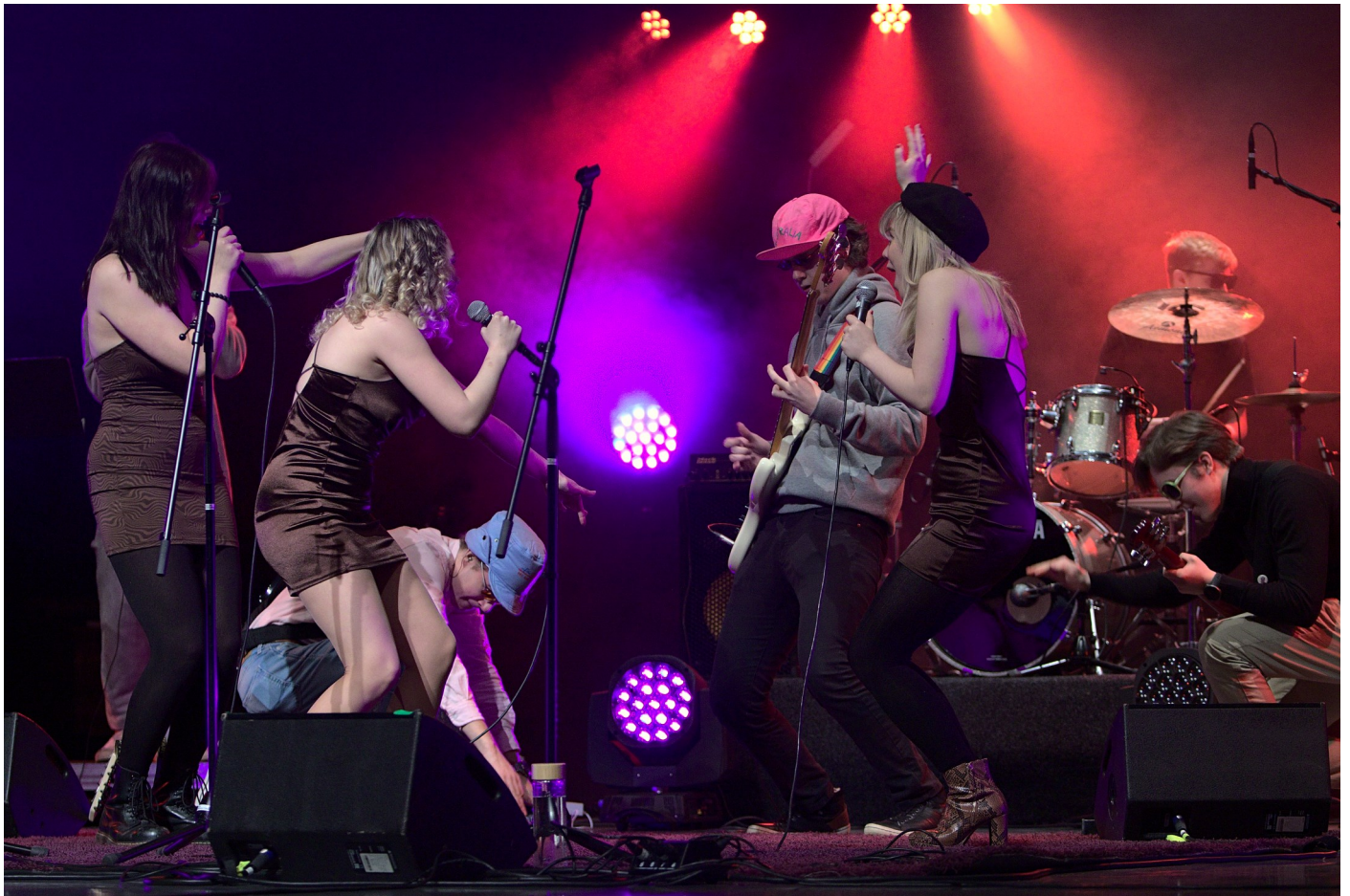
Kevyen musiikin maratonissa oli tunnelma katossa.