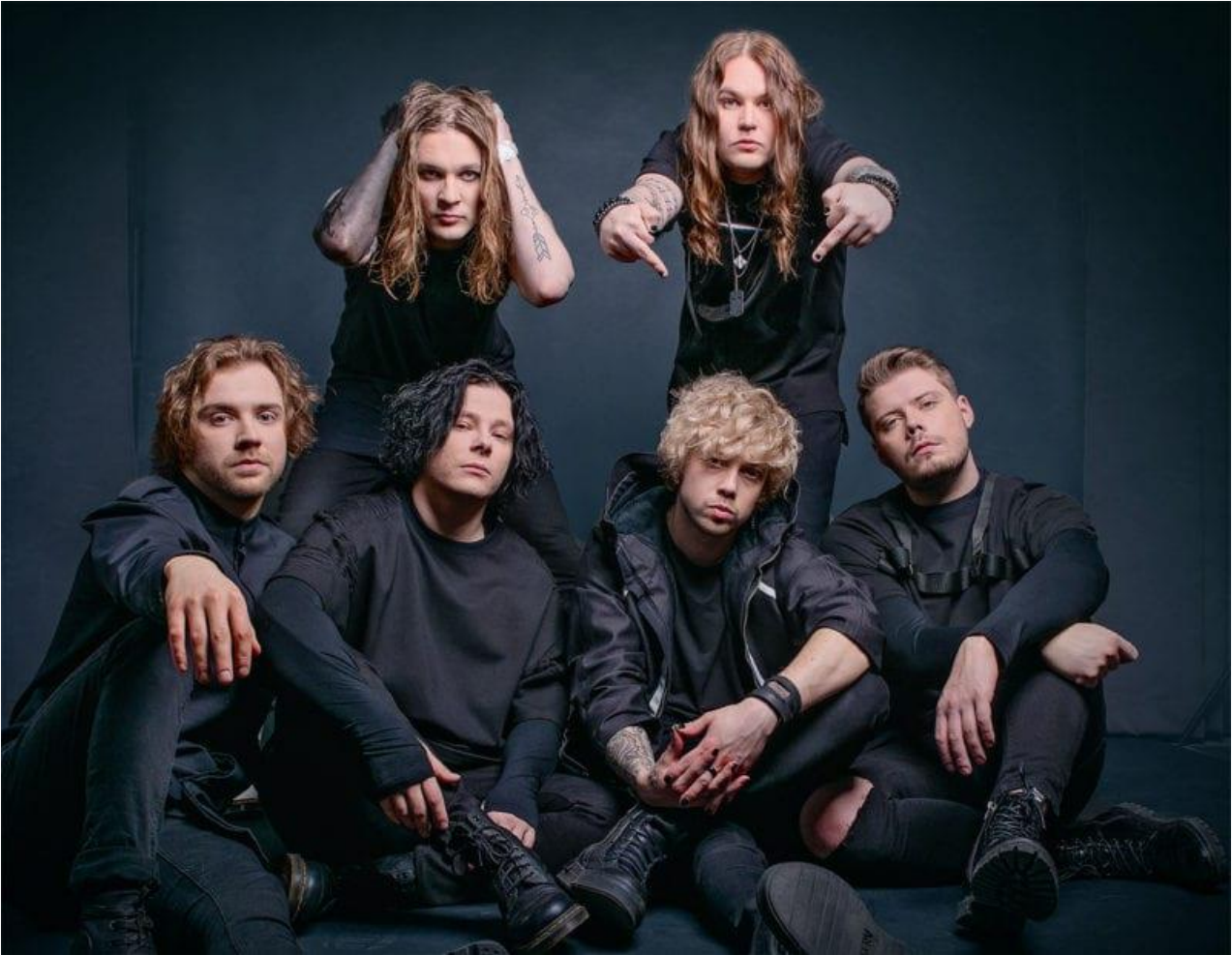
Blind Channel, lähdesivusto soundi.fi, kuvaaja Markus Paajala

Välillä sitä miettii et ois tää voinu mennä helpomminkin, mut toisaalta ilman kaikkia niitä low-pointteja ja epäonnistumisia ei varmasti oltais henkisesti niin rautasessa sheipissä ku ollaan nyt. Kyl mä uskon että tän kuulu mennä just näin.”