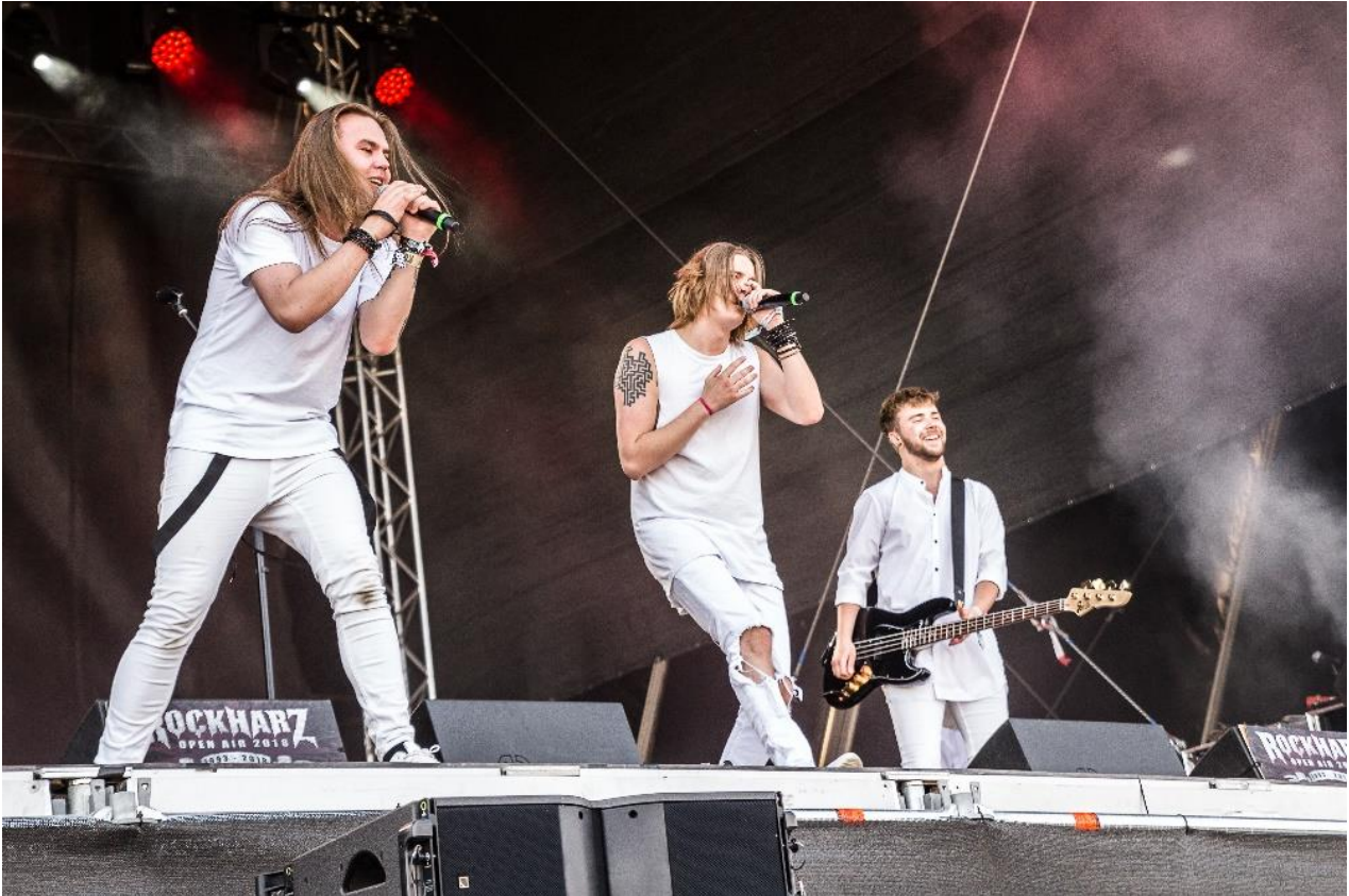
Blind Channel Rockharzissa 2018

Mitä ajattelette teihin kohdistuvista ennakkoluuloista, kriitikistä, vihasta...? Miten tällaiseen voi suhtautua?