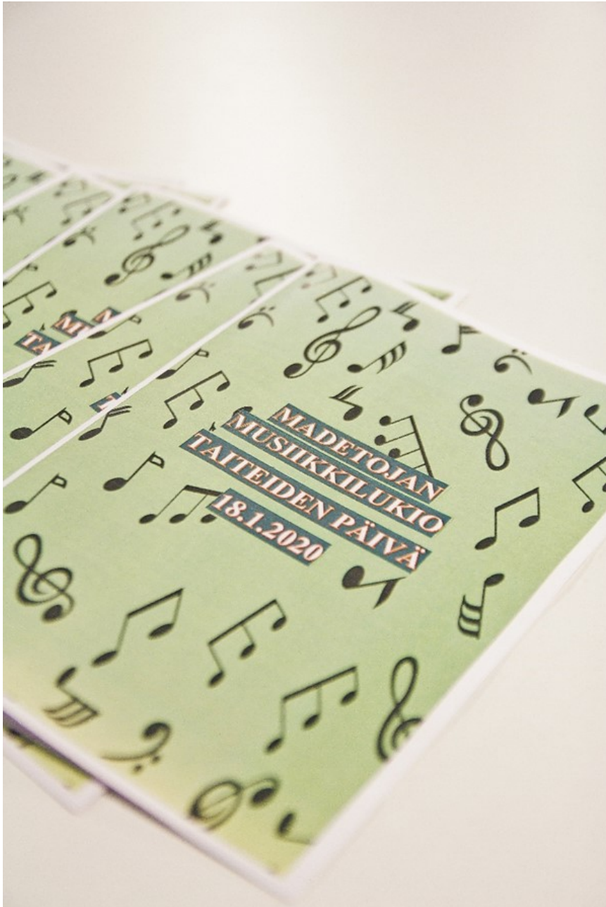
Taiteiden päivän esitteitä