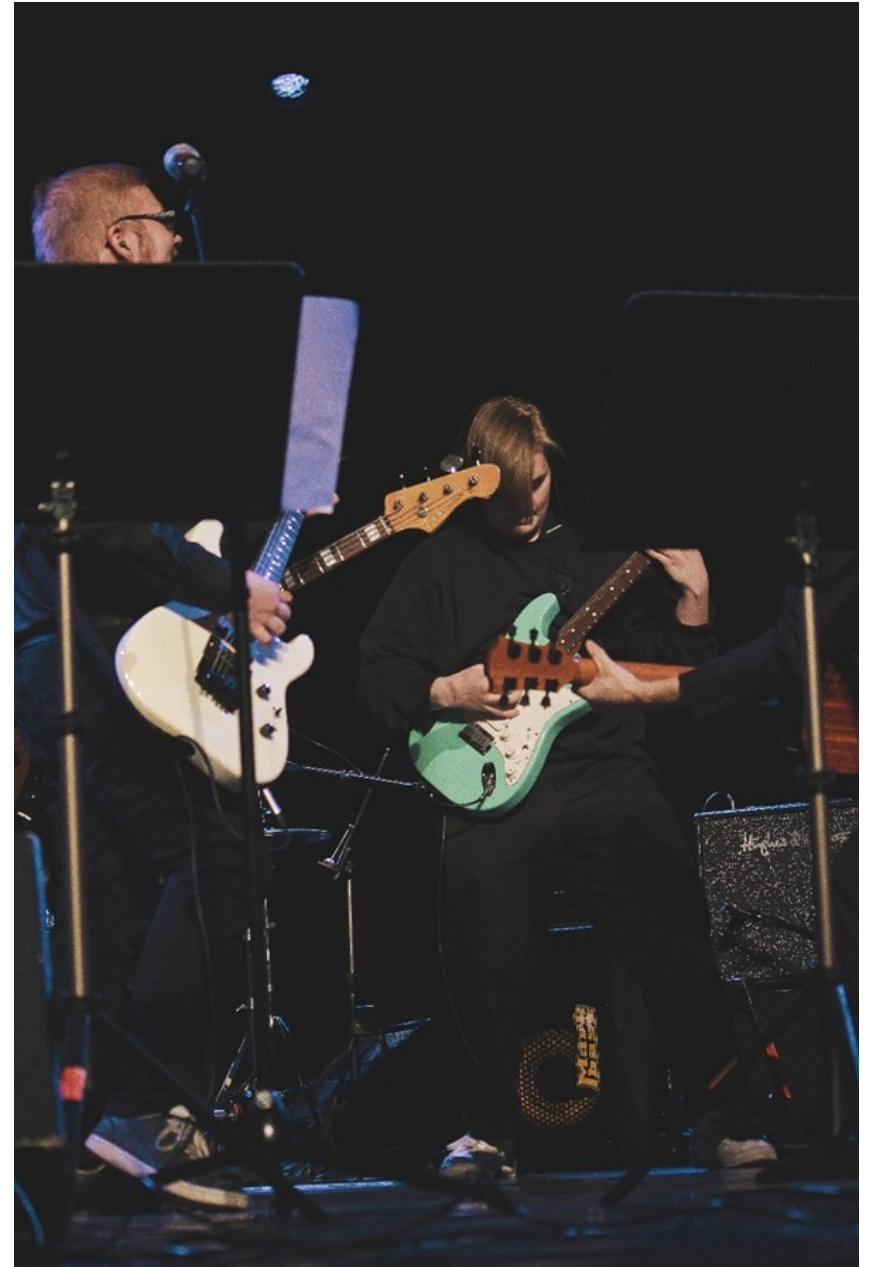
Kitaroiden yhteispeliä juhlasalin konsertissa