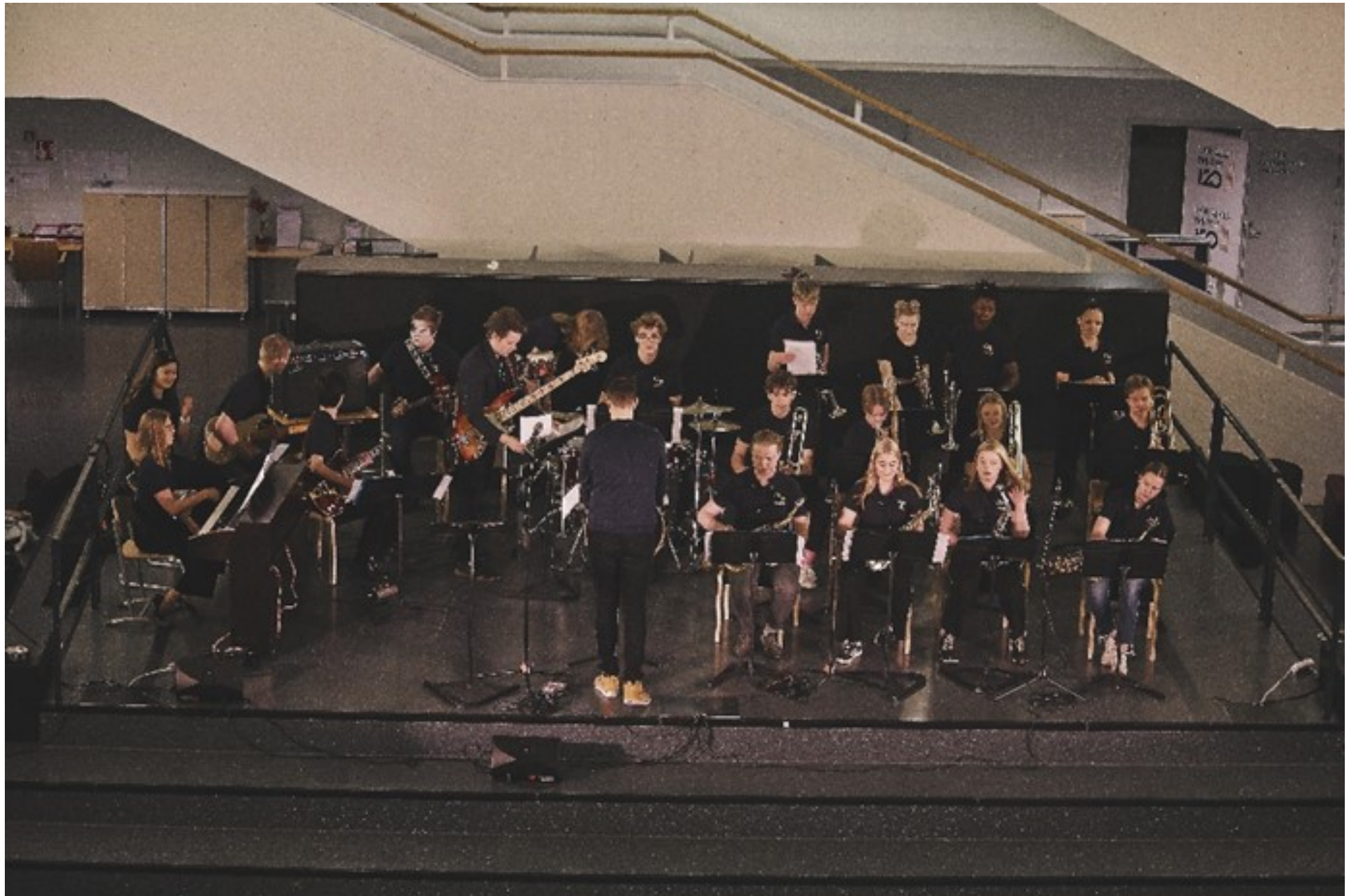
Oulu Youth Jazz Orchestra eli Oyj