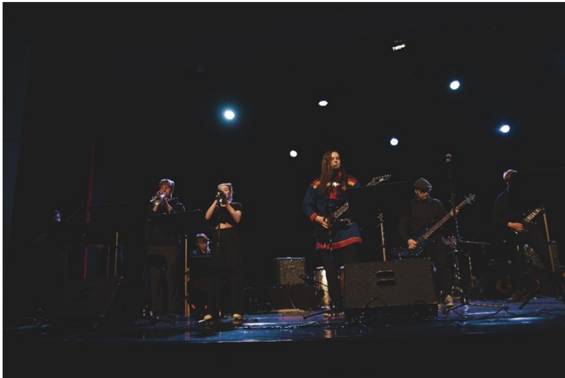
Erke Eriksenin sävellys