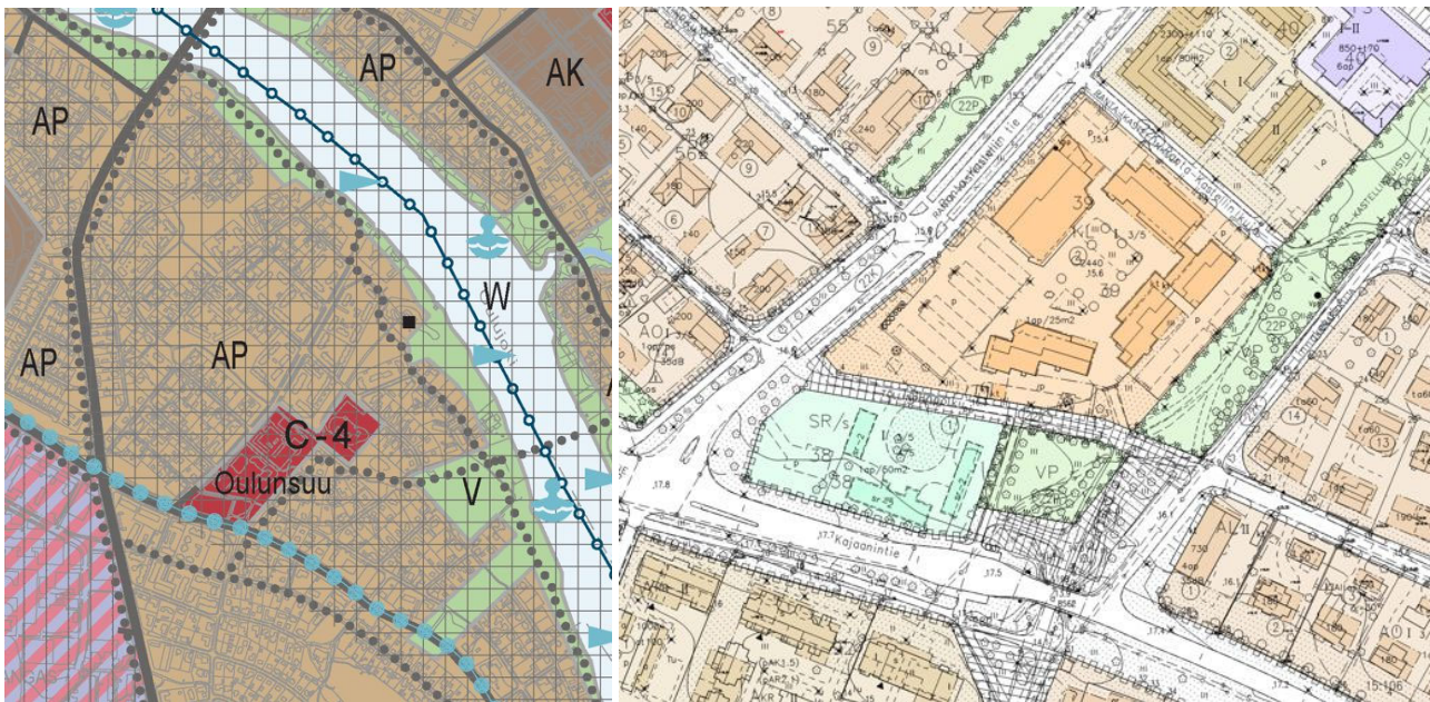
Kuvat: Ote Uuden Oulun yleiskaavasta ja ote ajantasa-asemakaavayhdelmästä. (Ei mittakaavassa.)

Voimassa olevassa Uuden Oulun yleiskaavassa (kv 18.4.2016 § 25) asemakaava-alue on osoitettu kaupunginosakeskukseksi (C-4), jota kehitetään kaupunginosan toiminnallisena ytimenä. Kaava-alueita ympäröi pientalovaltainen asuntoalue (AP). Kaava-alueen itäosassa kulkee Oulujoelle johtava kevyen liikenteen pääreitti. Kajaanintie on kulttuurihistoriallisesti merkittävä tie. Lisäksi laaja Oulujokivarren ympäristö Kajaanintien pohjoispuolella on osoitettu kulttuuriympäristön vaalimisen kannalta tärkeäksi alueeksi.