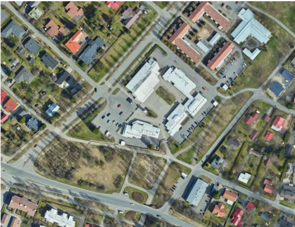
Kuva: Ilmakuva kaava-alueesta vuonna 2017.

Rakentamaton kortteli 38 on kaupungin omistuksessa. 3 644 m 2 :n laajuudessa korttelissa on nykyään lähinnä kulttuurivaikutteista kasvillisuutta. Paikalla olleen Kastellin kartanon rakennukset vaurioituivat tulipaloissa 1990- ja 2000-luvuilla, ja ne purettiin vuonna 2004.