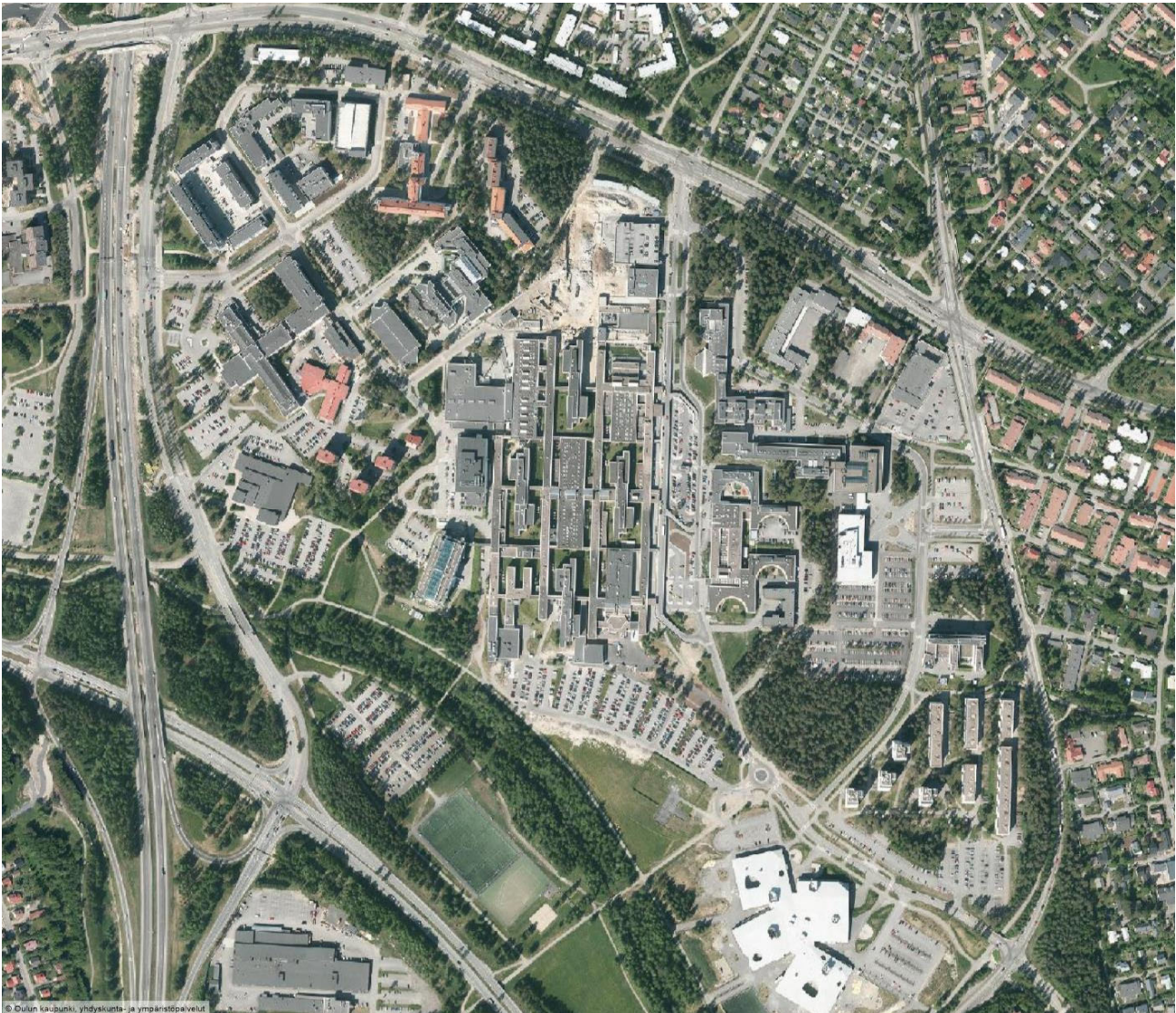
Kuva: Ilmakuva kaava-alueesta ja sen ympäristöstä v. 2018. (Ei mittakaavassa.)