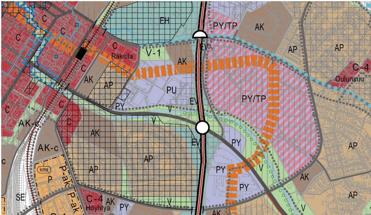
Kuva: Ote Uuden Oulun yleiskaavasta. (Ei mittakaavassa.)

kevyen liikenteen pääreitti. Lisäksi Kontinkankaan alueen poikki kulkee Linnanmaalta Kaakkuriin ulottuva kaupunkiraitiotien kehittämiskäytävä.