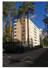
4 As Oy Kotkanpoika, As Oy Helatorni ja As Oy Vaskikotka Vaskitie 6,8 ja 10 Antti Rissanen 1969