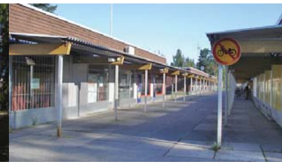
14 Ostoskeskuksen vanhin osa Hiirihaukantie 3 Uki Heikkinen 1967