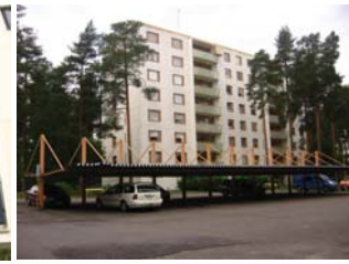
5 Kiint.Oy Sato-Martta ja Kiint.OyTenaakkeli Tuulihaukantie 1 ja 3 Risto Harju 1971 (kuva yllä)