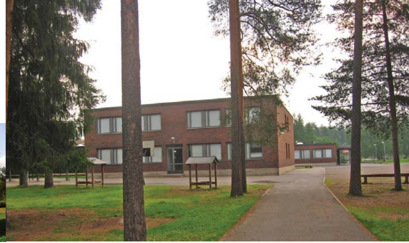
13 Koulu-kirjasto Hiirihaukantie 4 Kaupungin rakennustoimiston suunnitteluosasto 1970