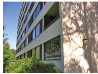
3 As Oy Kaukovainion Sato ja As Oy Sato-Vainio Jalohaukantie 4,6 ja 8 Salo & Wegelius 1966

Kaukovainion omakotialue rakentui hyvin nopeasti asemakaavan vahvistamisen jälkeen entiselle pellolle. Samaa talotyyppiä tehtiin aina koko kortteli tai kadunvarsi, jolloin katunäkymistä tuli yhtenäiset. Matalat ja pelkistetyt rakennukset noudattivat aikansa ihannetta. Alueella on ollut yhtenäisen rakennustavan takia oma identiteettinsä – sitä sanottiin ”arabikyläksi”. Pienet tontit ja kytketty talotyyppi ovat luoneet tiiviille alueelle oman ilmeensä. Taloissa on tapahtunut paljon muutoksia, jotka ovat heikentäneet alueen yhtenäistä ilmettä.