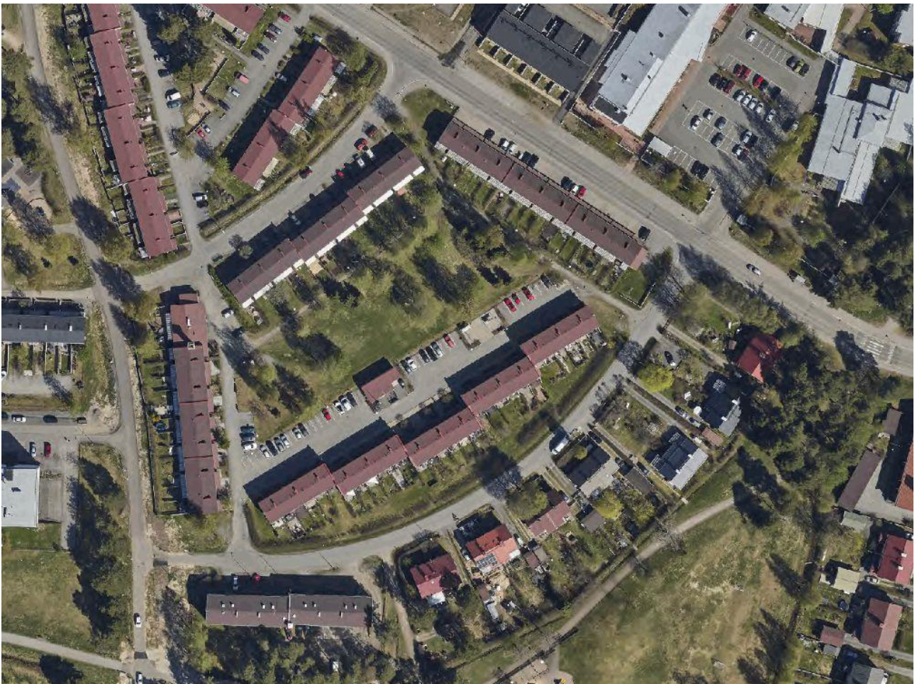
Kuva: Ilmakuva vuodelta 2022. (Ei mittakaavassa.)

Kaava-aluetta reunustavat Hanhitie, Kaakkuritie, Kuikkatie ja Nokelantien pyörätie. Kortteleiden keskellä on Kaakkuripuisto.