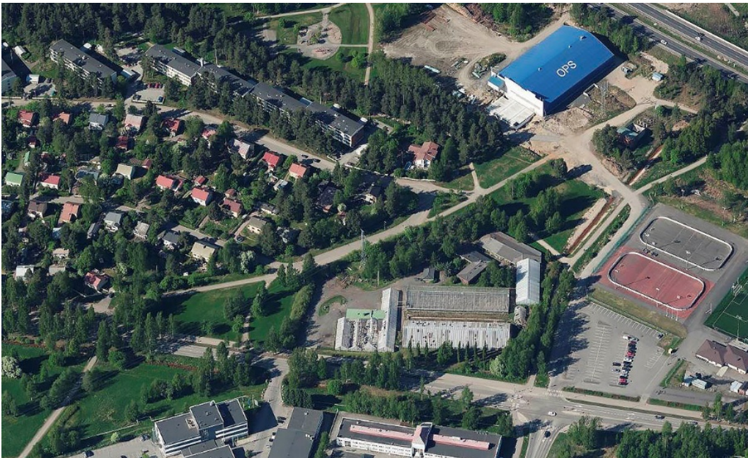
Kuva 4. Viistoilmakuva 25.5.2018.

Suunnittelualueella aiemmin sijainneen Välivainion puutarhan toiminta on loppunut. Osa rakennuksista on purettu. Tontilla ja varsinkin sen reunoilla on paikoin runsasta puustoa. Alueen luoteisreunan yli kulkee Oulun Energian 110 kilovoltin voimalinja.