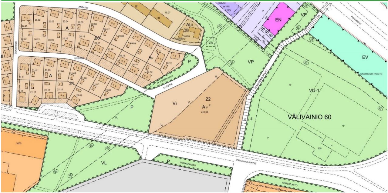
Kuva 3. Ote voimassa olevasta asemakaavasta.