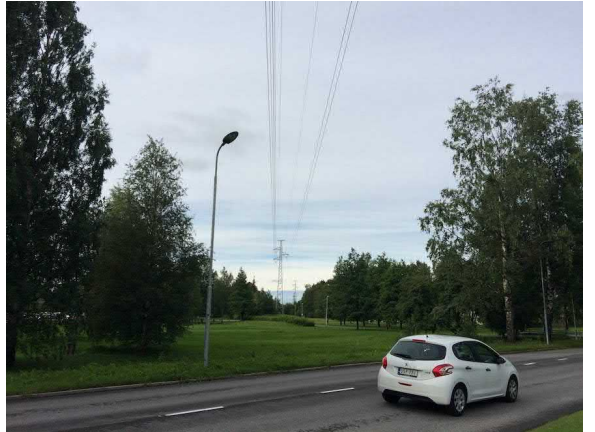
Kuvat 7 ja 8. Paulaharjuntieltä avautuvia näkymiä puutarhan (7) ja Tuiran (8) suuntaan.

Tontilla näkymiä avautuu kulkureittien suuntaisesti. Laajoja näkymiä avautuu vain Castrenin urheilukeskuksen alueella (kuvat 5, 6, 15 ja 24).