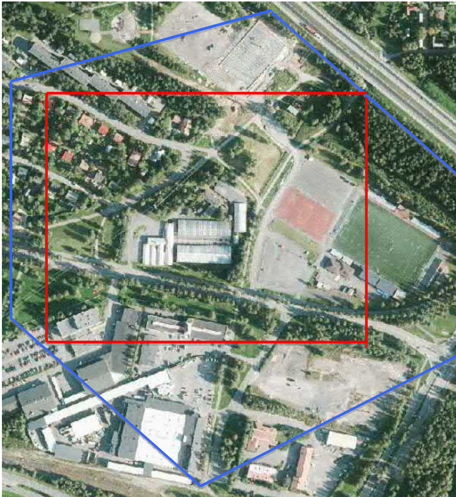
Kuva 1. Maisemaselvityksen tarkastelualue sinisellä ja karttarajaus punaisella.

Selvitysalue sijaitsee Välivainion kaupunginosassa noin kahden kilometrin etäisyydellä Oulun keskustasta. Selvitysalueeseen kuuluu Välivainion puutarhan korttelin (kortteli 22) lisäksi lähiympäristön puisto- ja katualueita sekä teollisuus- ja pientaloalueita. Maisemaselvityksen alue on noin 7 hehtaaria. Maisemaselvityksessä on tarkasteltu laajempaa aluetta kuin mitä liitteenä olevassa maisemaselvityskartassa on esitetty.