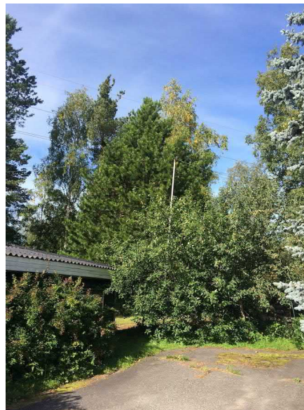
Kuvat 17 ja 18. Voimalinjan alle istutettu mänty (17). Mänty oli kaadettu v 2018. Sembramänty omenapuiden keskellä (18).

Muita nykytilassaan arvokkaita puita löytyy puistoalueilta useita. Niiden arvo maisemassa korostuu hoidetuilla puistoalueilla, mutta ne ovat joko huonokuntoisia tai lajistoltaan vähempiarvoisia.