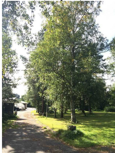
Kuvat 9 ja 10. Puutarhan tontille avautuva kapea näkymä, jonka päätteenä pylväshaavat (9). Tontilla kulkureitti muodostaa näkymälinjan, jota puut korostavat (10).