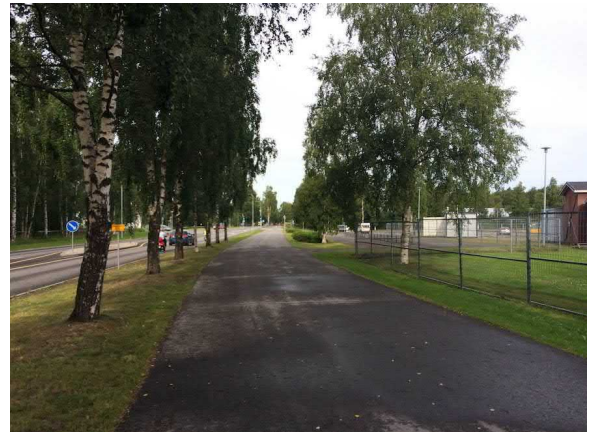
Kuvat 3 ja 4. Puiden muodostama portti OPSn hallin vieressä (kuva 3) ja alueelle saavuttaessa (4).

Selvitysalueella avautuu muutamia merkittäviä näkymiä tai näkymälinjoja. Paulaharjuntien ja Korjaamotien katulinjat mahdollistavat pitkät, paikoitellen kapeat näkymät. Puistokäytävien ja tonttikatujen näkymälinjat jaksottuvat väylän kaareutumisen mukaan. Paulaharjuntien suuntaisesti avautuu alueen pisimmät näkymälinjat, tietä reunustava puukujanne tehostaa näkymäkseliä myös kaventaen sitä.