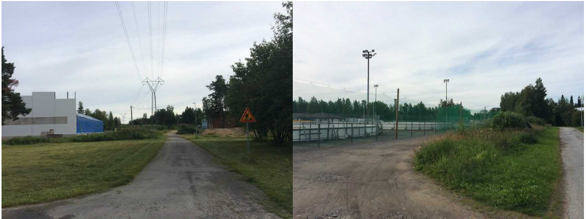
Kuvat 23 ja 24. Voimalinja korostuu avoimessa maisemassa (23). Urheilukenttien rakenteet erottuvat maisemassa (24).

Selvitysalueella epämiellyttäviä tiloja ovat Castrenin urheilupuiston ja liikerakennusten pihojen jäsentymättömät pysäköinti- ja varastointialueet (kuva 5, 22). Maisemahäiriöinä eli korjattavina tai poistettavina haittoina korostuvat rakentamisen aiheuttamat maa- ja roskakasat sekä rakennusten seinustoilla olevat graffitit. Puistoalueella maisemahäiriönä korostuu ojissa kasvavat pajukot, jotka aiheuttavat laajojen näkymien sulkeutumista (kuva 24).