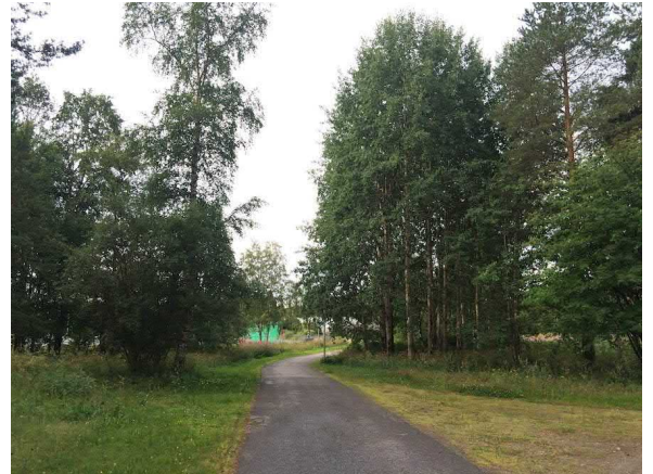
Kuvat 15 ja 16. Maisemamänty pallohallin vieressä (15). Haaparyhmä erottuu maisemassa erityisesti syksyllä (16).

Puutarhan tontilta löytyy muutama maisemallisesti merkittävä puu, joiden korostaminen kaavamerkinnällä ei ole tarpeellista. Alueen länsi- ja pohjoisreunassa on mäntyjä, jotka sijoittuvat lähelle voimalinjaa (kuva 17). Puut latvotaan säännöllisesti voimalinjan läheisyydessä, jolloin niiden kasvu ja kunto heikentyy. Asuinrakennusten lähellä on sembramänty (kuva 18), joka erottuu maisemassa, mutta sen viereen on istutettu rautatienomenapuu liian lähelle. Molemmissa puissa näkyy vaurioita. Lisäksi piha-alueelta löytyy koivuja, jotka nykytilassaan ovat merkittäviä maisemassa, mutta eivät ikänsä tai kuntosuhteeltaan ole todennäköisesti säilytettäviä. Tarkesuunnittelussa tulisi teettää kuntoarviot puista. Tonttia rajaava orapihlaja-aita on maisemassa näkyvä elementti (kuva 7), ja sen säilyttäminen on suositeltavaa.