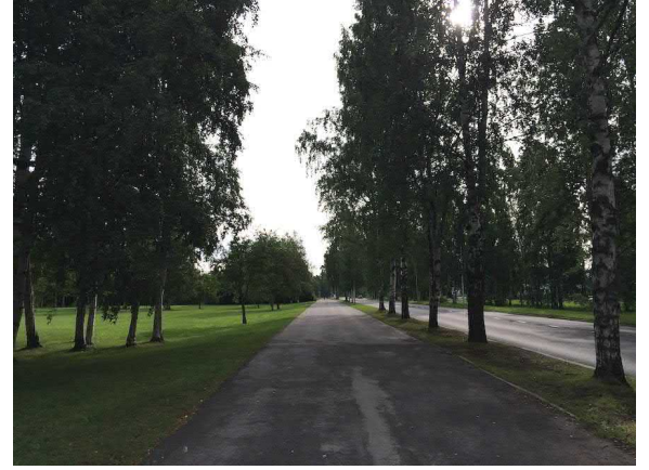
Kuvat 19 ja 20. Paulaharjuntien koivukujannetta voimalinjan läheisyydestä molempiin suuntiin kuvattuna.

Myös Castreninpolkua rajaa koivukujanne, joka on maisemallisesti merkittävä (kuva 21). Korjaamotien liikerakennuksen tontilla on myös koivurivi, joka korostuu maisemassa (kuva 22).