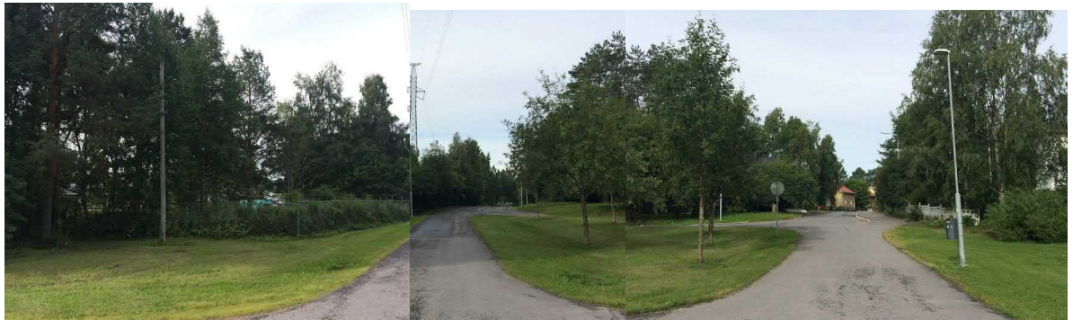
Kuva 2. Maiseman solmukohta: Puistokäytävien risteys, joka on maaston korkeimmalla kohdalla.

Maiseman solmukohtia ja portteja muodostuu selkeisiin maisematilojen rajakohtiin, alueen korkeimmille kohdille sekä rakenteiden tai luonnonelementtien muodostamiin kohtiin. Selvitysalueen merkittävin portti tai solmukohta muodostuu puutarhan pohjoispuolella sijaitsevaan polkujen risteyskohtaan, joka on myös alueen korkeimpia kohtia. Selvitysalueelta löytyy myös puiden muodostamia solmukohtia.