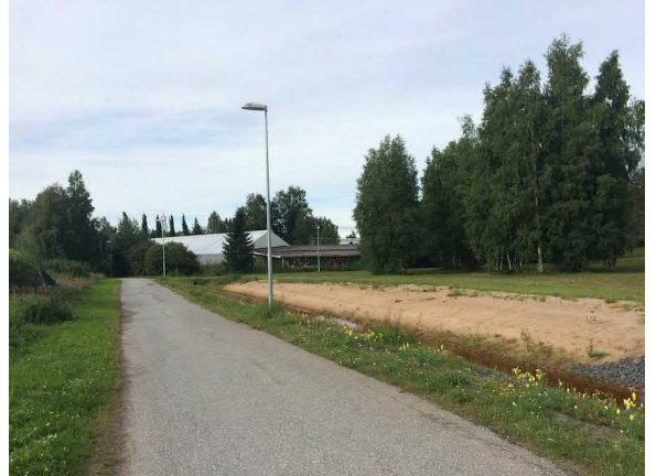
Kuvat 5 ja 6. Alueelle tullessa avautuu näkymä Castrenin urheilupuistoon (5). Castreninpolulta avautuu näkymä puutarhalle (6).

Paulaharjuntieltä avautuu sähkölinjan kohdalla näkymät sekä puistoon että Tuiraan.