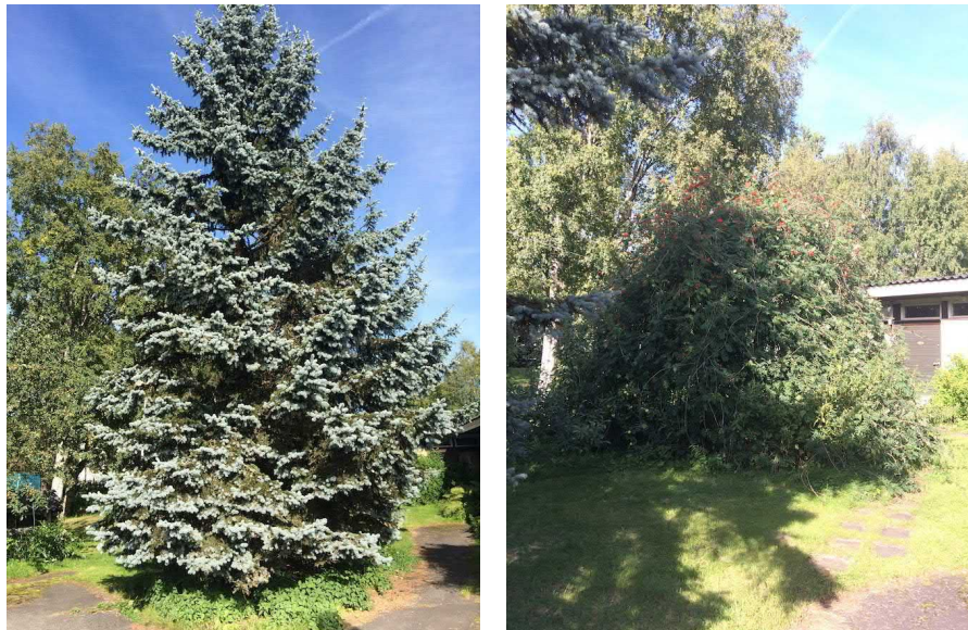
Kuvat 13 ja 14. Puutarhan asuinrakennuksen vieressä oleva hopeakuusi (13) ja riippapihlaja (14).

Puisto- ja katualueen säilytettävät, arvokkaat yksittäispuut ja puuryhmät ovat Castreninpuistossa olevat mänty ja haaparyhmät (kuvat 15-16).