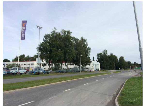
Kuvat 21 ja 22. Castreninpolulta pohjoiseen (21). Korjaamotien liiketontin koivurivi (22).