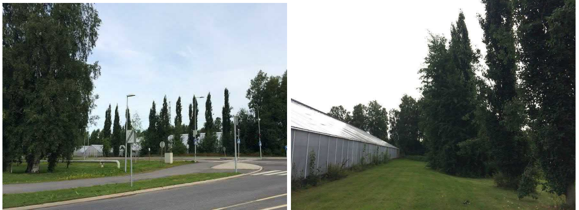
Kuvat 11 ja 12. Paulaharjuntien suuntaiset pylväshaavat erottuvat kauas maisemassa.

Puutarhan tontilla on maisemallisesti merkittävä puurivi; Paulaharjuntien suuntaiset pylväshaavat (10 kpl, kuvat 11-12). Tontilla on lisäksi kolme arvokasta, säilytettävää yksittäispuuta: kaksi riippapihlajaa ja hopeakuusi (kuvat 13-14). Toinen pihlajista on voimalinjan alla.