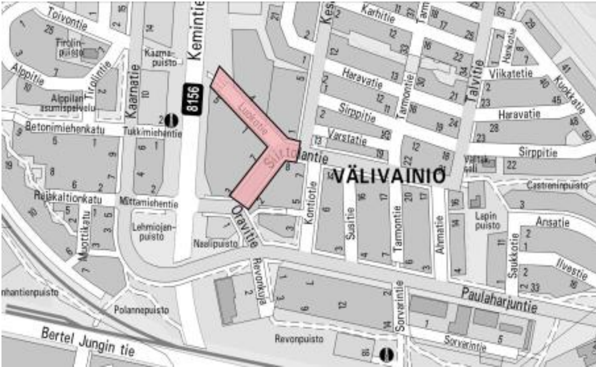
Kuva 1. Suunnittelualue opaskartalla