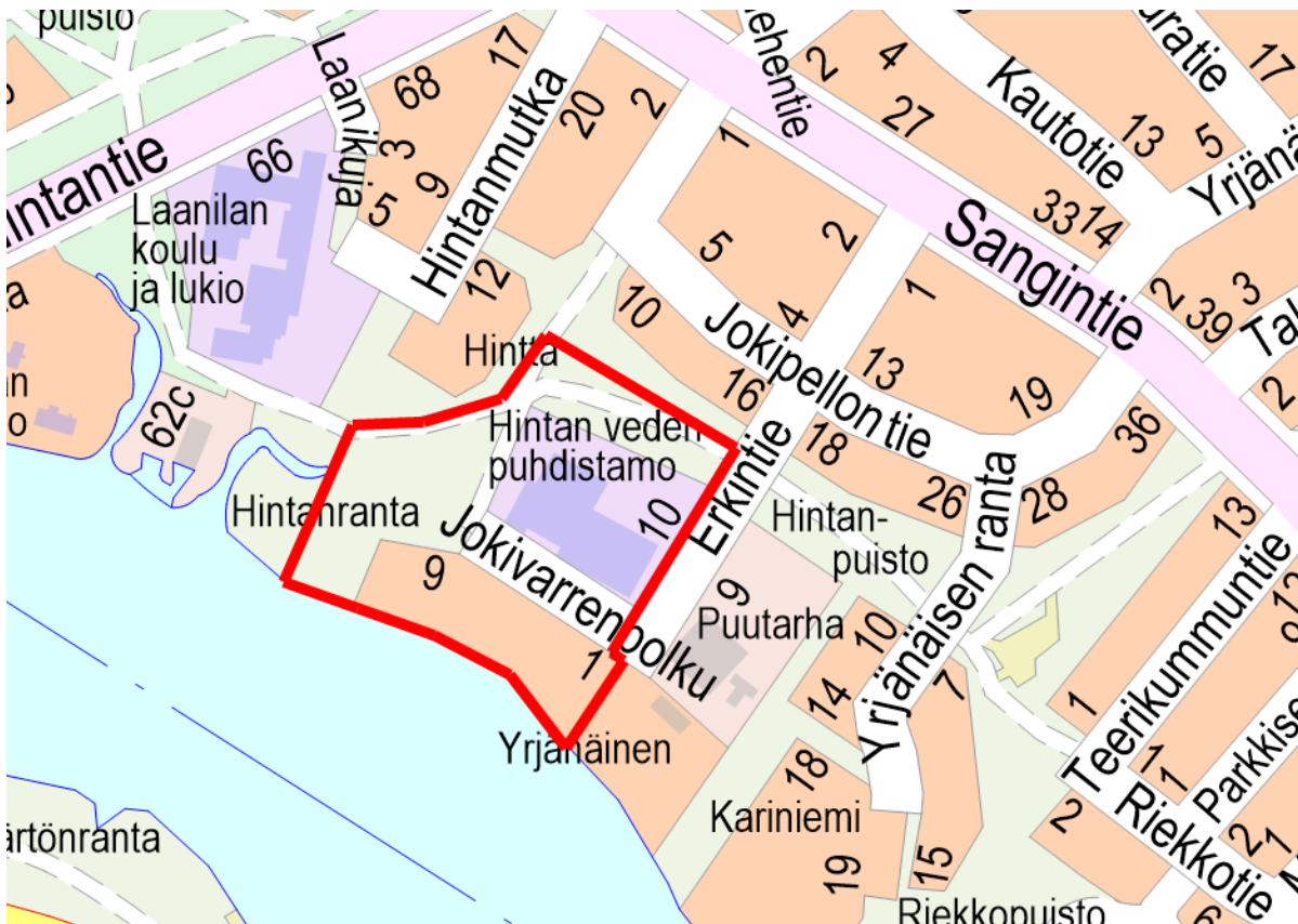
Kuva 1 Ote opaskartasta, rajatulla suunnittelualueella osoitetaan sijainnit ja tilavaraukset vesilaitoksen laajennukselle, varavesialtaalle ja pohjaveden tuloaltaalle.

Osallistumis- ja arviointisuunnitelmasta on mahdollista esittää mielipiteitä nähtävilläoloaikana. Ohje palautteen antoon sivulla 5.