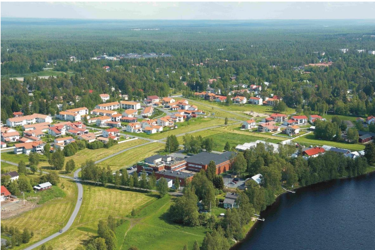
Kuva 2 Näkymäkuva nykytilanteessa

Hintan vesilaitoksen ja Oulujoen välissä olevalla siirtolapuutarha- ja puistoalueella on kolme vanhaa pihapiiriä rakennuksineen. Vanhin rakennuksista on alun perin 1911 rakennettu kesähuvilaksi ja on nykyisin asuinkäytössä. Keskimäinen pihapiireistä on toiminut asukastupana ja on kaupungin omistuksessa. Sen itäpuolella sijaitseva 1930-luvulta peräisin oleva rakennus on huvilakäytössä.