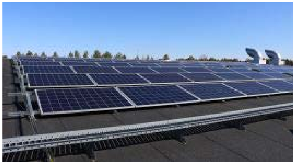
Vesi-Jatulin liikuntakeskukseen Haukiputaalle valmistui energiaremontti, jonka osana rakennuksen katolle asennettiin aurinkovoimala.