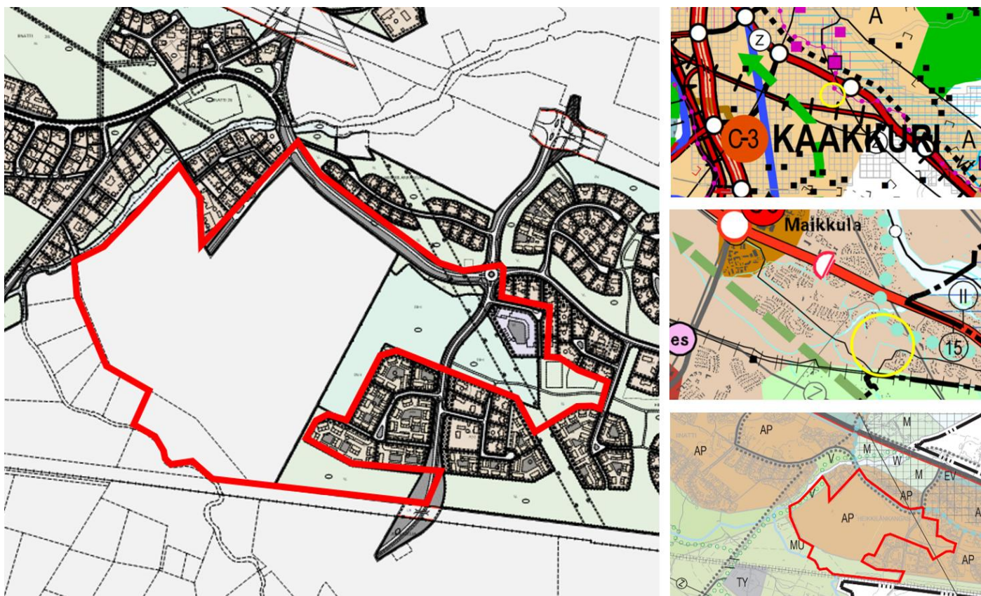
Kuva 3 Vasemmalla ote asemakaavayhdistelmästä. Oikealla yllänä ote maakuntakaavan yhdistelmäkartasta keskellä ote yleiskaavakartasta 1 ja alinna ote yleiskaavakartasta 2. Suunnittelualueen likimääräinen sijainti on lisätty karttaotteisiin punaisella viivalla tai keltaisella ympyrällä.

Pohjois-Pohjanmaan maakuntakaavassa suunnittelualue sijoittuu Oulun kaupunkiseudun kaupunkikehittämisen kohdealueelle (kk-1). Uusilla asuntoalueilla tulee tavoitella hyvien joukkoliikenneyhteyksien varteen sijoitettavaa tiivistä pientaloasutusta. Yhtenäisen vihervyöhykkeen turvaaminen tulee ottaa huomioon. Suunnittelualue on merkitty taajamatoimintojen alueeksi (A). Alueella tulee pyrkiä hyvään energiatalouteen ja edistää yhdyskuntarakenteen eheyttämistä. Uudisrakentaminen tulee sopeuttaa jo rakennettuun ympäristöön. Vesijaontie on merkitty maakunnallisesti arvokkaaksi rakennetuksi kulttuuriympäristöksi, jonka arvojen säilymistä tulee edistää. Voimajohto on merkitty 110 kV:n pääsähköjohtoksi.