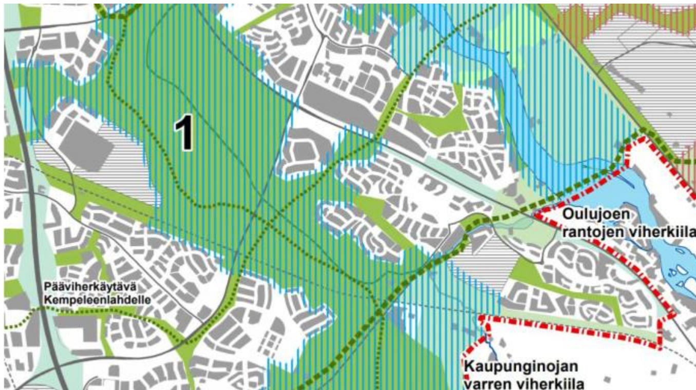
Kuva 4 Luonnon ja maiseman suositukset maankäytölle, Oulu (VILMO, kartta 2.5, Oulu 2014)

Oulun viheralueverkosto ja luonnon monimuotoisuus -selvityksen (VILMO, Oulu 2014) maankäytön suosituksissa suunnittelualue on merkitty pääosin rakentamiselle varatuksi alueeksi. Suunnittelualueen koillisosa on merkitty virkistysalueeksi ja eteläosa Juurusojan varressa on merkitty tärkeäksi viheralueverkoston osaksi, Kaupunginojan varren viherkiilaksi.