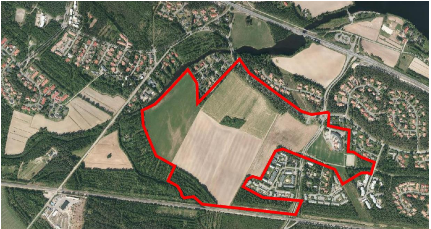
Kuva 2 Ortoilmakuva (Oulu 2018). Suunnittelualueen likimääräinen rajaus on lisätty karttaan punaisella viivalla.

Valtaosa Kainuuntien (vt 22) eteläpuolelle sijoittuvasta Heikkilänkankaan alueesta on kaavoitettu asuinkäyttöön 1990-luvun lopussa ja toteutettu pääosin 2000-luvun alussa. Kaikki lähiympäristön tontit ovat rakennettuja. Heikkilänkankaalla on vesijohto-, viemäri-, sähkö- ja kaukolämpöverkko ja maalämpökaivoja. Vesijaontiellä on joukkoliikennereitti pysäkkeineen ja pohjavesiposti. Suunnittelualueen lähistöllä on kaksi leikkipaikkaa. Lähin kauppa sijaitsee Kontionkankaalla, jossa on myös kunnallinen päiväkotit. Enemmän kaupallisia palveluja on Maikkulan keskuksessa, jossa on myös kirjasto, nuorisotalo ja yhtenäiskoulu. Linattiin on tarkoitus rakentaa koira-aitaus. Suunnittelualueen lähistöllä on kuntoratoja, hiihtolatuja ja moottorikelkkaura. Juurusojan venesatamalle on etäisyyttä n. 600 m. Maikkulan keskukseseen on n. 3 km ja Oulun kaupungin keskustaan n. 8 km.