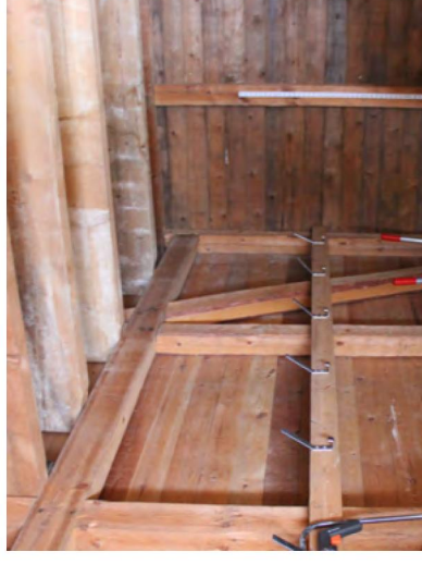
169. Rakennus on rankatunkoinen, vain tallin seinät on hirrestä.