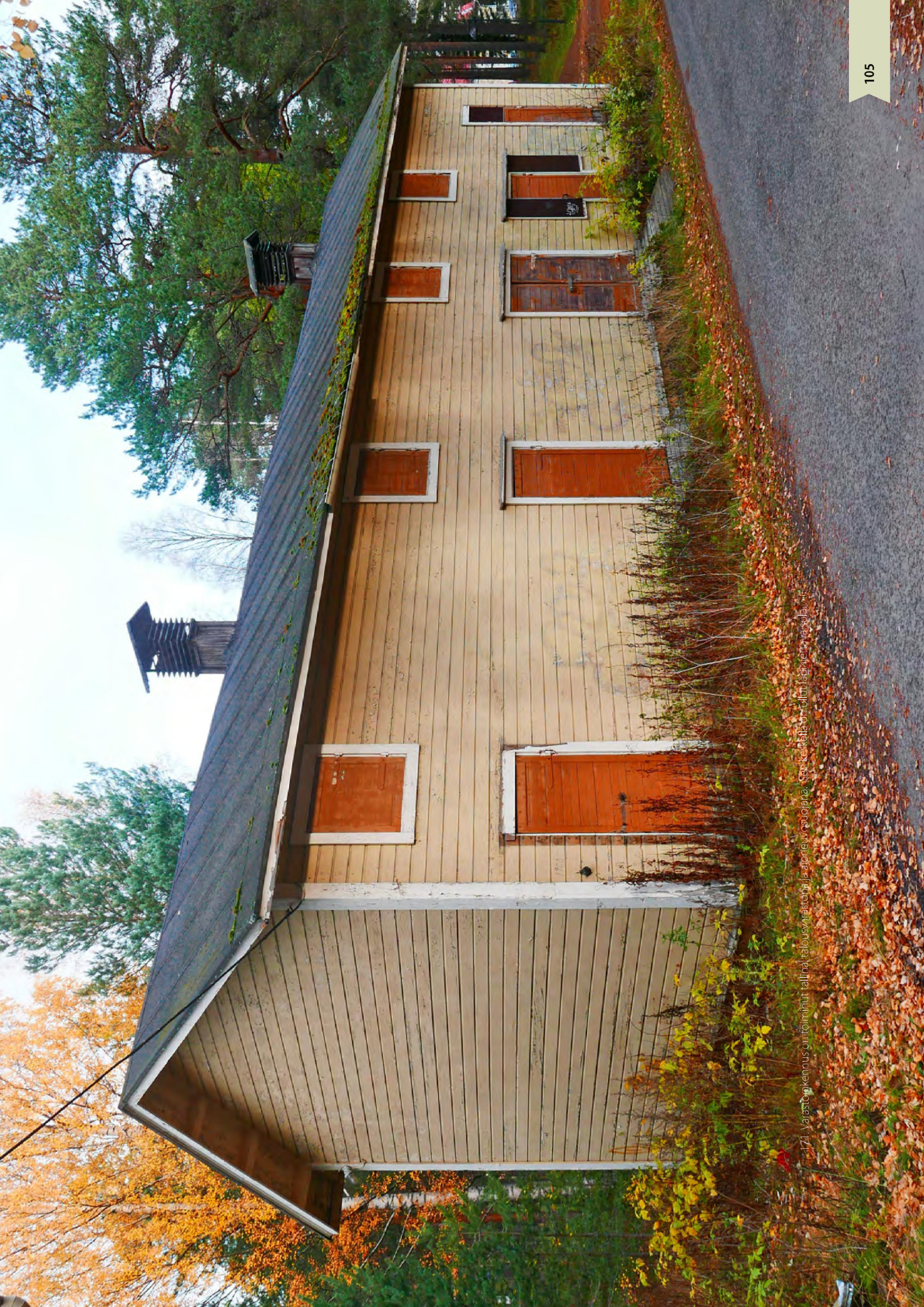
171. Värstökennus on toiminnut tallina, talousraastona ja ajoneuvusuojana. Sen keskelle on ollut läpinjettä vasdla, wif