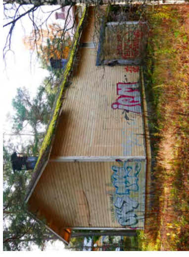
167. Takaosa, josta on purettu pitkä poikittainen liiteri.