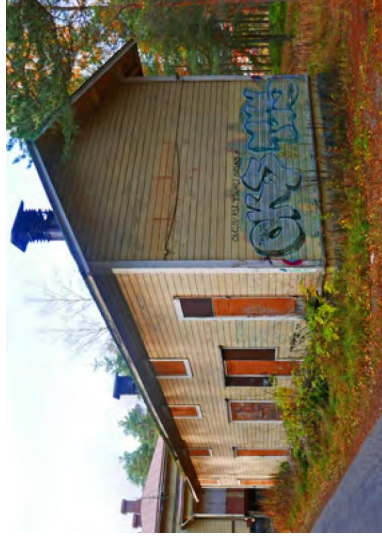
166. Varastorakennus idän suunnasta