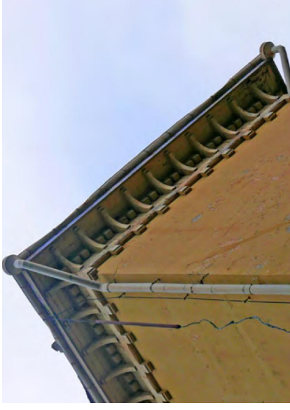
140. Puiset konsolit kannattelevat vesitorin kattotasannetta.