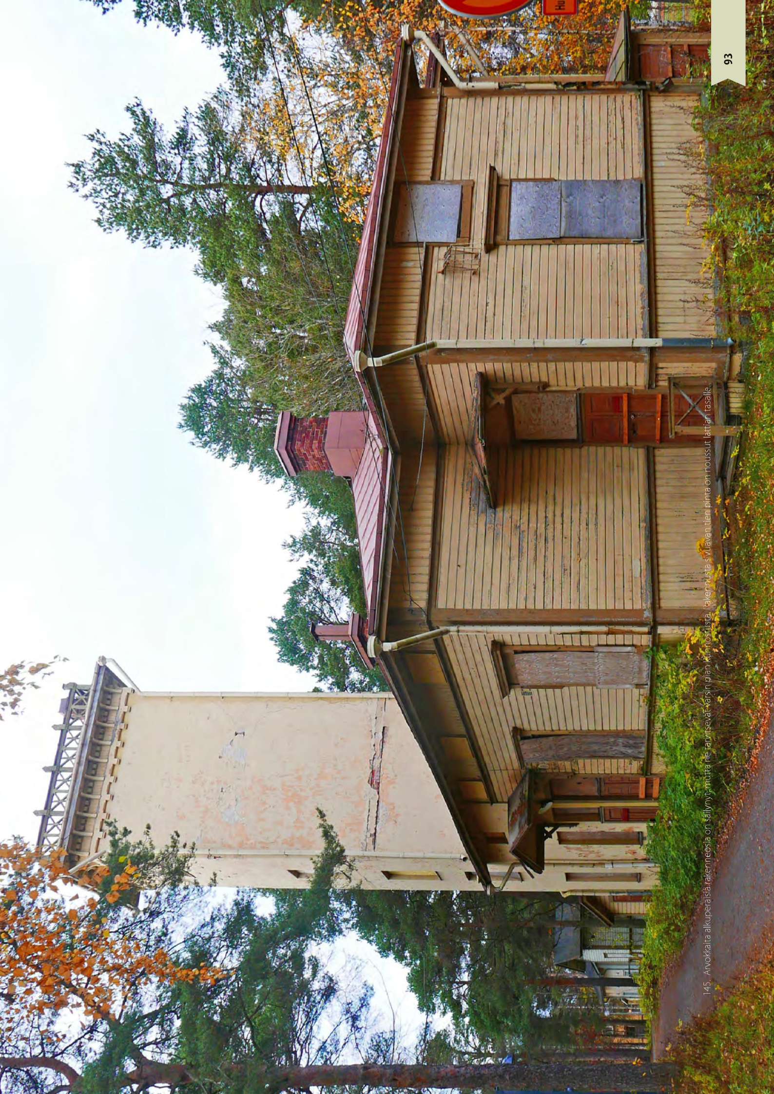
145. Avokkaiden alkuperäisiä rakennuksia on säilynyt, mutta ne tarvitsevat varsinkin jänkin kunnostusta. Rakennusta sivuavan tien pinta on noussut lattian tasalle.