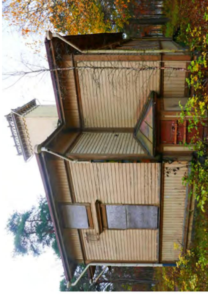
141. Julkisivu länteen.