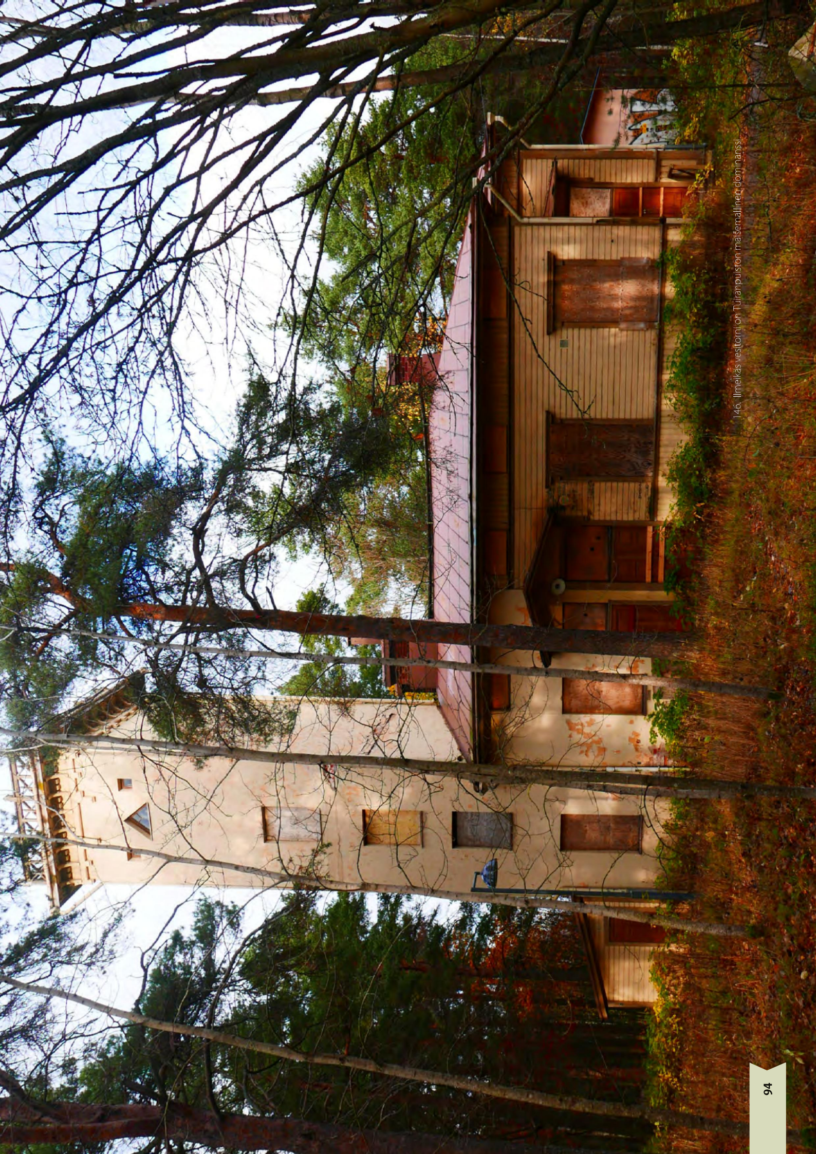
146. Ilmeikäs vesiorni on Tuiranpuiston maisemalliset dominanssi.