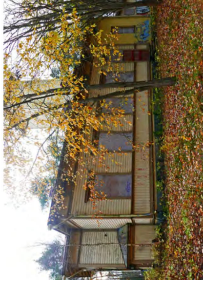
142. Julkisivu taakse