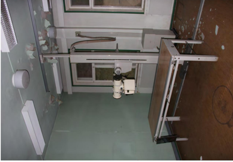
147. Röntgenlaittelisto jäi jäljelle 1990-luvun sairaalalauseohankkeesta.