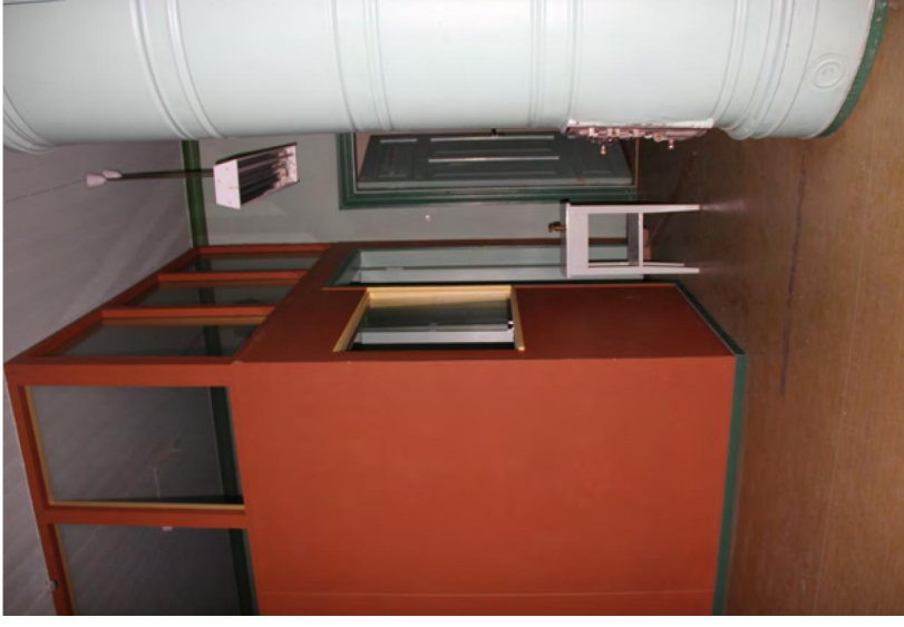
149. Sisätiloissa on runsaasti kerrostumia sadan vuoden ajalta. Ne ovat tunnistettavissa ja tarvittaessa poistettavissa.

Suurimmat tilamuutokset on tehty vuonna 1931, jolloin taloudenhoitaja muutti rakennukseen asumaan ja pitämään toimistoa. Tiloja ja niiden käyttötarkoituksia muutettiin perusteellisesti ja isätilaa rakennettiin pesutupaan ja ullakolle. Vuonna 1967 rakennukseen tehtiin röntgentilat.