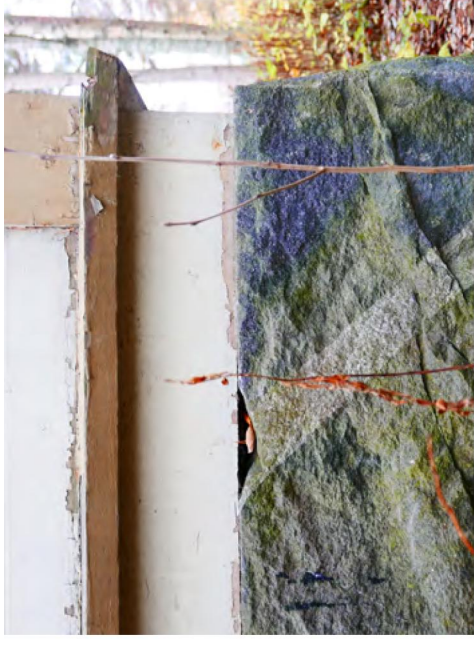
133. Rakennuksen lohkokiviperustusta.