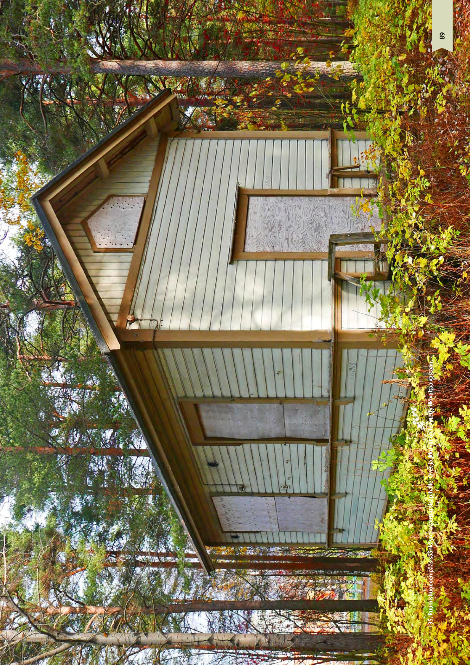
135 Ruumispuoneen pääsisäänkäyntiä vaurioituneelle. Ovet ja ikkunat on lautoitettu ilkkivaltaa vastaan.