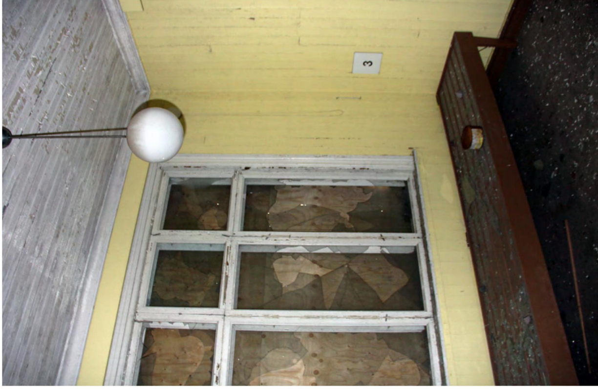
137. Alkuperäiset rakennusosat ovat paksujen maalikerrosten peittämiä.