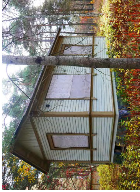
132. Ruumishuone kullisen suunnasta.