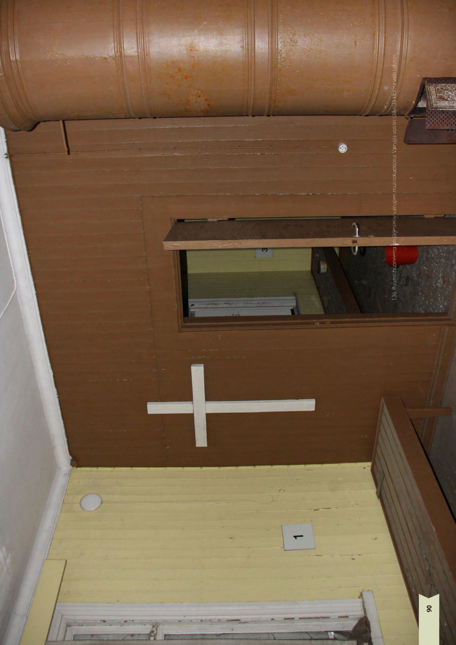
136. Ruumihuoneessa on järjestetty vainajien muistoluokioita. Vainaja voitiin säilyttää tiloissa vain talvisin.