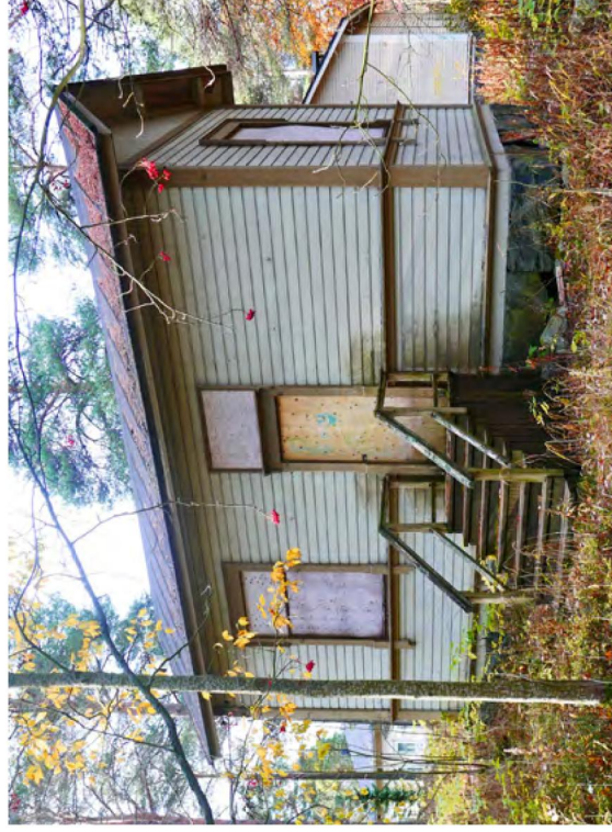
139. Iläivun portaan joitavat erilliseen huoneeseen, joka on toiminut myös laboratoriona.