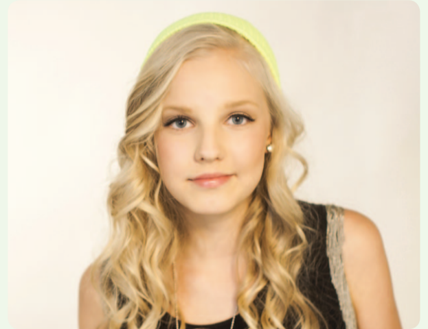
Tuuli esiintyy lauantaina Oulun Lastenmessuilla.

Tapahtuman nettisivut: www.lastenmessut.fi Tiedustelut: 044 555 3214 ja tomi@lastenmessut.fi .