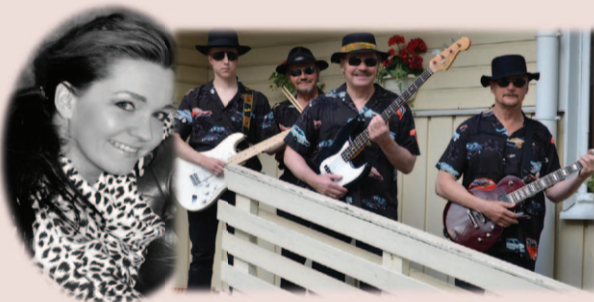
Armi ja Eldorado