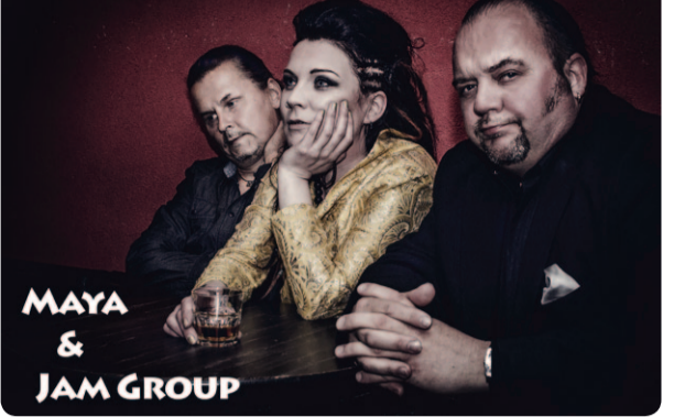
MAYA & JAM GROUP