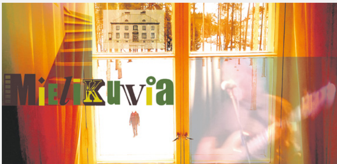
Tekijä: Jari Mäki