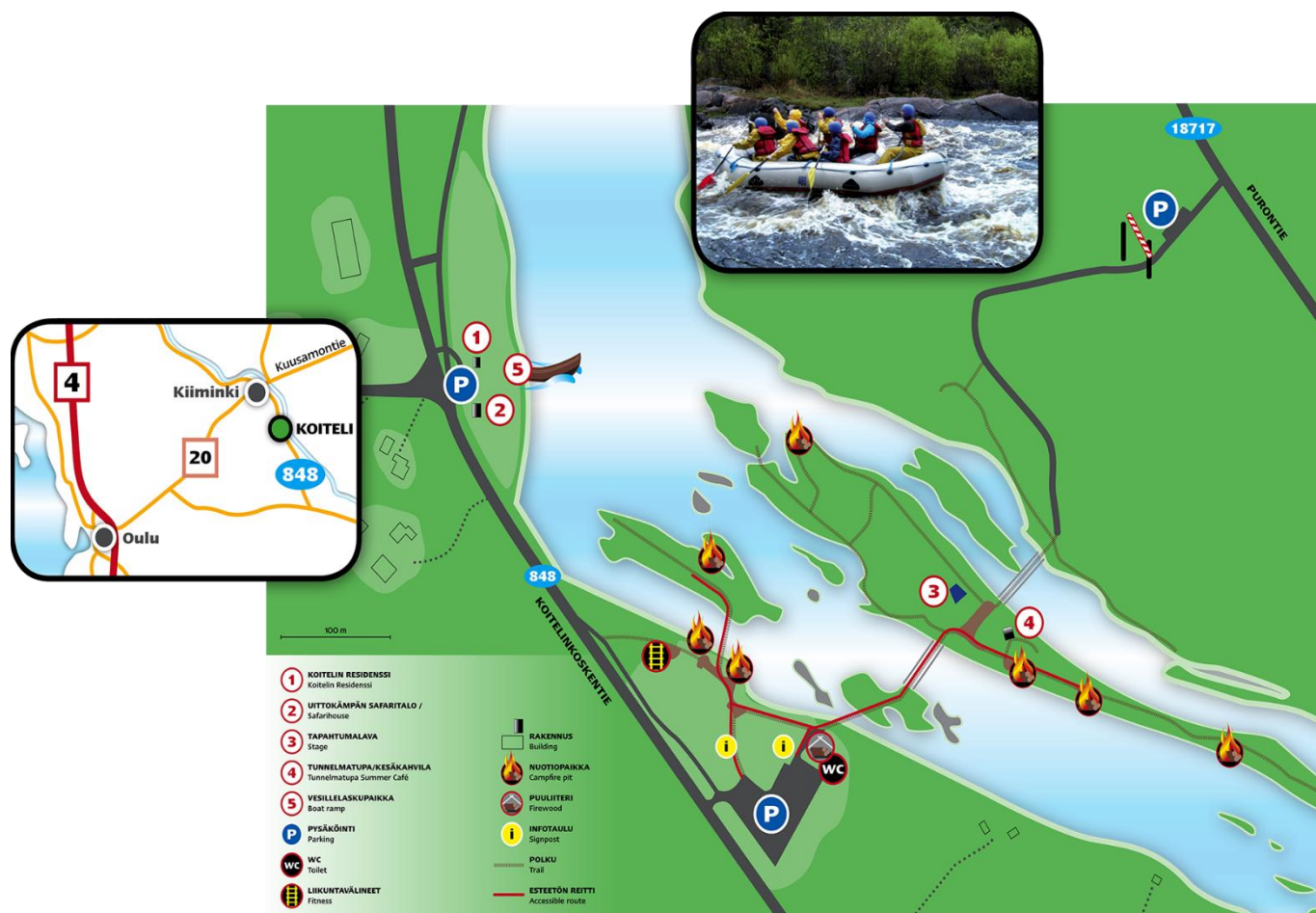
Kuva 1. Koitelin alueen yleiskuvaus

Oulun kaupungin yhdyskunta- ja ympäristöpalveluissa on haettavana toteuttaja Koitelin matkailualueen kehittäjäksi ja toteuttajaksi.