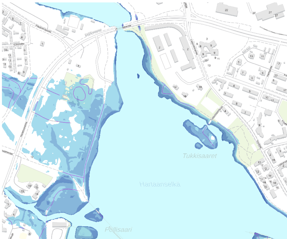
Kuva 3 Merivesitulva 1/250v N2000+2.45. (Tulvakeskus/IL meriennusteet)

Ilmatieteenlaitoksen ja Suomen Ympäristökeskuksen laatimassa meritulvakartassa (Kuva 3) esitetty 1/250 vuodessa toistuvan merivesitulva N2000+2,45 leviämialue suunnittelualueella. Merivesitulvien aiheuttamia alimpia rakentamiskorkeuksia määritettäessä mitoitus-toistuvuutta vastaavaan tulvakorkeuteen lisätään vähintään 0,3 m aaltoiluvara. Hartaanselän alue on käytännössä Oulujoen suistoa ja meriveden aaltoilulta hyvin suojassa, joten aaltoiluvaraa ei ole syytä korottaa.