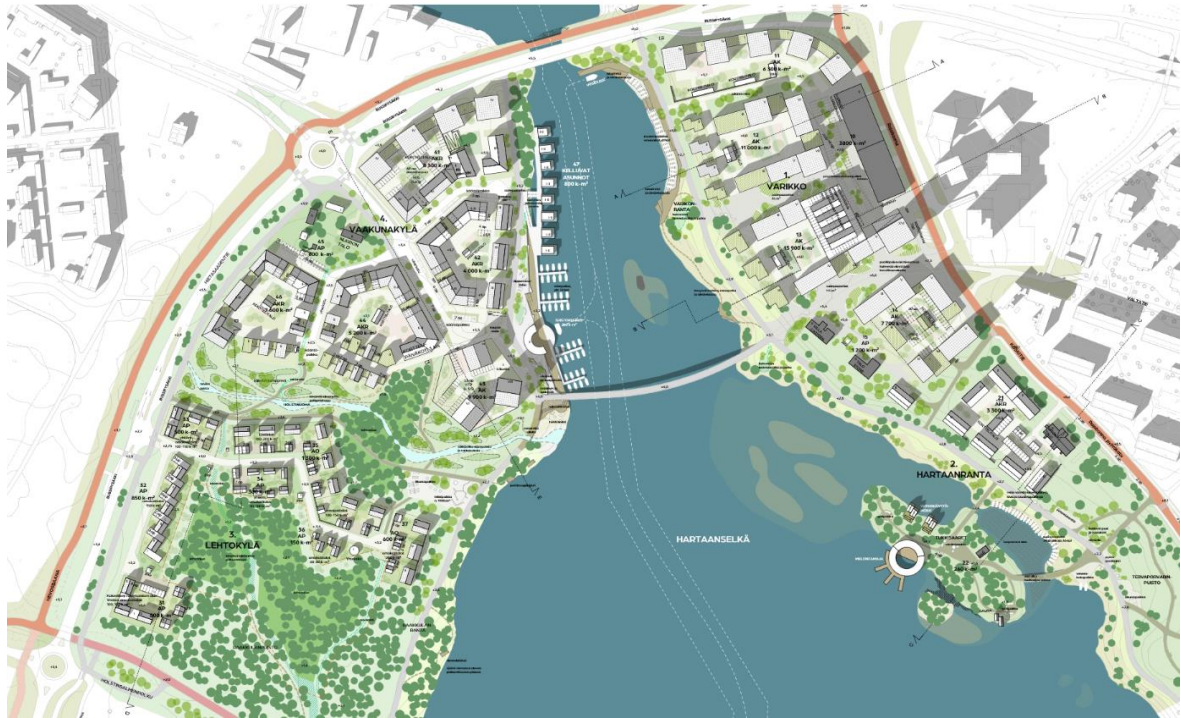
Kuva 1 Hartaanselänrannan yleissuunnitelma 15.12.2020.

Hartaanselänrannan alueelle rakentuu vuoden 2025 asuntomessualue. Alue jakaantuu Hietasaaren lähes luonnontilaiseen alueeseen, johon rakentuvat Lehtokylä ja Vaakunakylä sekä Tuiran puolella kaupungin Varikon ja Hartaanrannan alueeseen (Kuva 1).