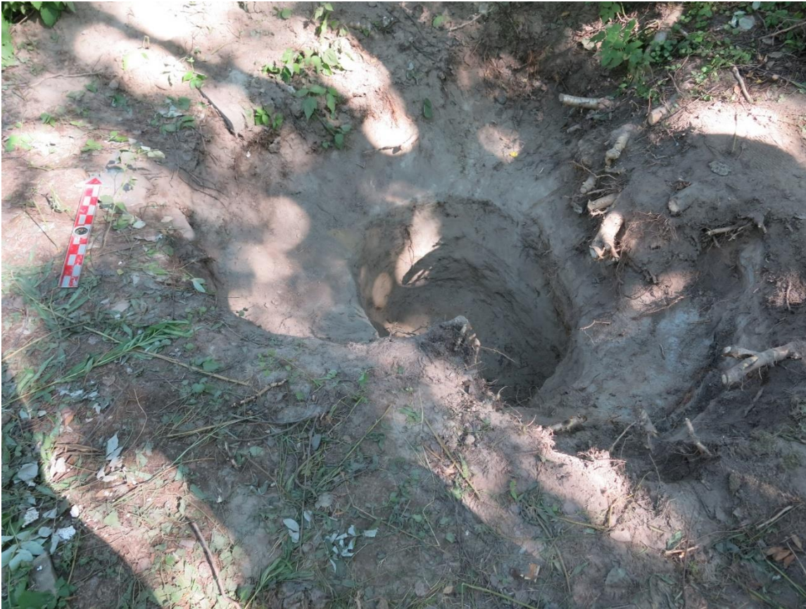
Kuva 8. Vuoden 2020 kuoppa pohjaan kaivettuna (kuva numero 51, Oulun yo, ark.lab.).

koostui hiekan ja saven sekaisesta multamaasta, jossa oli runsaasti kasvien juuria sekä hieman hiiltä. Kuopan tiiviistä pohjakerroksesta, josta tuli vielä esiin löytöjä, otettiin maanäyte.