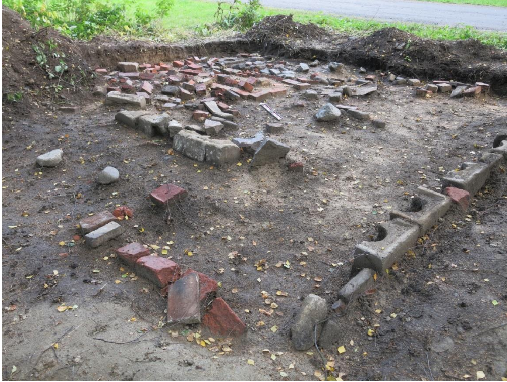
Kuva 12. Yleiskuva parakista. Kuisti ja rakennusmateriaalina käytetyt piippuelementit etualalla (kuva numero 256, Oulun yo, ark.lab.).

Vuonna 2020 paikan läheisyydestä löydetty hylätty kamiina 19 liittyy tähän parakkirakennukseen. Kamiina on saatettu poistaa käytöstä heti sodan jälkeen ja korvata se muuratulla tulisijalla. Parakin pohjaan liittyi muuratun tulisijan suorakulmainen perustus (kuva 13). Tulisija oli rakenteen pohjoiskulmassa ja sen sisällä oli hienoa keltaista hiekkaa. Perustuksen päällä oli mullan ja hiekan sekaista maata. On myös mahdollista, että parakissa on ollut sekä tulisija että kamiina. Rakenteen viereen avattiin kaksi nimeämätöntä kaivantoa, joista ei kuitenkaan tehty lainkaan löytöjä. Kaivannot on merkitty liitekarttaan 2.