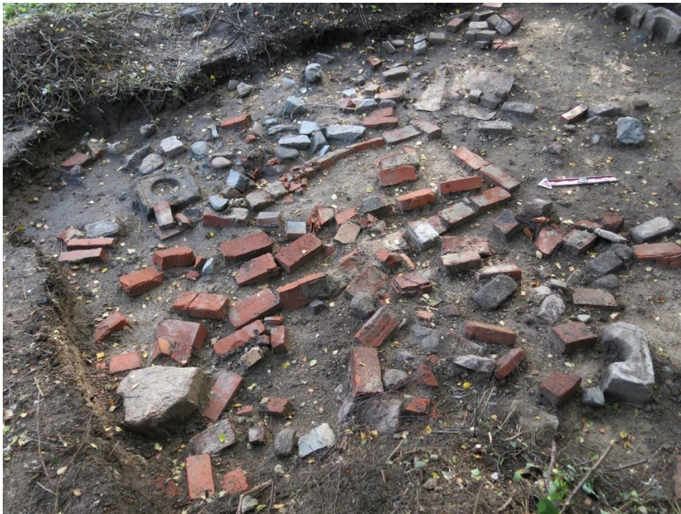
Kuva 13. Tulisijan paikka parakkirakenteen sisällä (kuva numero 247, Oulun yo, ark.lab.).

käytöstä poistuneilla piippuelementeillä. Parakkeja tiedetään muokatun mm. laajentamalla ja kunnostamalla. 20