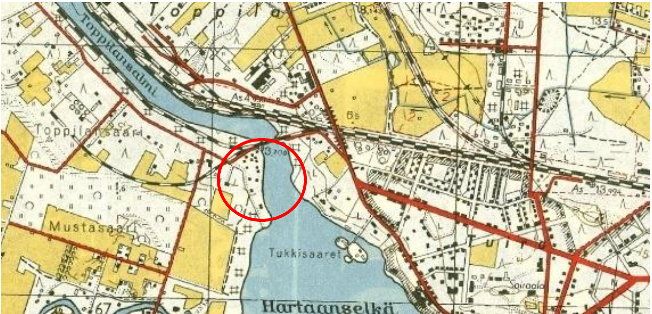
Kuva 4. Vuoden 1953 peruskarttaote. Tämän kartan mukaan alueella on enää 14 parakkia. Ei mittakaavassa.

parakkeja. Näitä mitoiltaan 6,5 x 6,9 m ja sisäpinta-alaltaan 44,9 m 2 olleita parakkeja, 8 valmisti suomalaisen Puutalo Oy 9 .