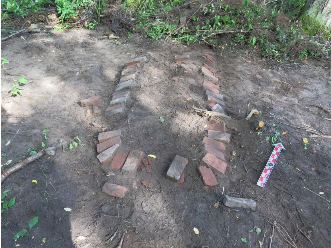
Kuva 14. Kukkapenkki parakin vieressä (kuva numero 125, Oulun yo, ark.lab.).