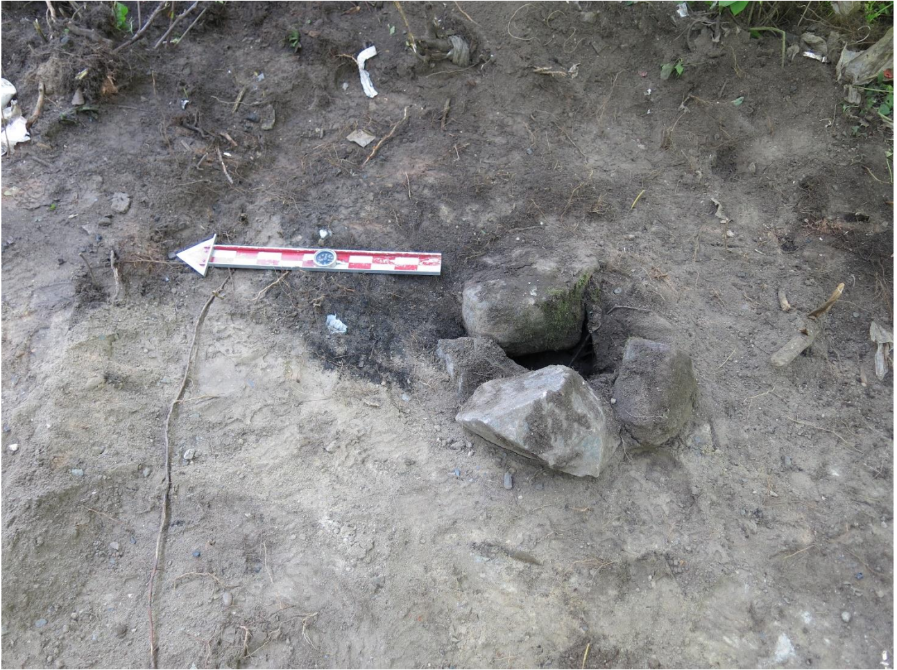
Kuva 11. Kivikuoppa pintapuhdistuksen jälkeen (kuva numero 104, Oulun yo, ark.lab.).