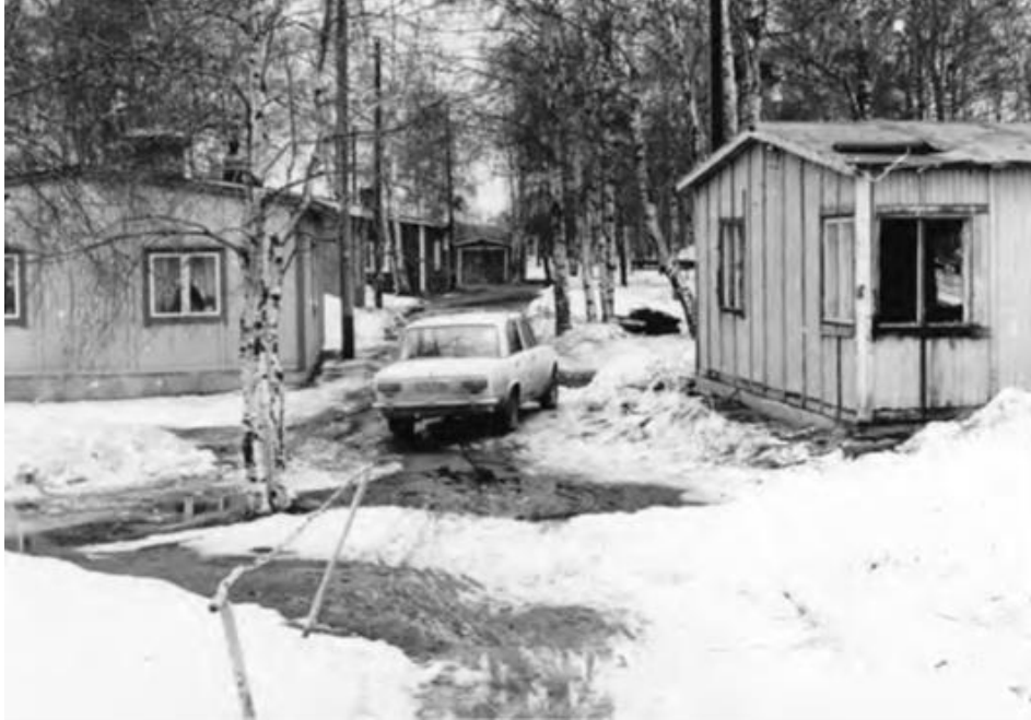
Kuva 5. Vaakunakylä vuonna 1981 (kuva: Pohjamo 2011, 181. Kuva alun perin Pirkko Kingelinin vuoden 1981 harjoitustyöstä).

alkaen. Asukkailla ei ollut laillista asumisoikeutta vuokrasopimusten puuttuessa, joten purkumääräys oli helppo toteuttaa sen nojalla. Alun perin alue oli suunniteltu tyhjennettäväksi parakeista jo vuoden 1955 loppuun mennessä. 10 Suunnitelma, joka ei toteutunut, näkyy Oulun vuoden 1961 opaskartassa, jossa Vaakunakylän alue on merkitty rakentamattomaksi viheralueeksi (kuva 6). Asukkaat eivät uskaltaneet tehdä enää korjaustöitä parakkeihin purku-uhan alla, ja viimeistään 1980-luvulle tultaessa Vaakunakylä näyttäytyi kaupungin silmissä rähjäisenä ongelma-alueena, josta haluttiin päästä lopullisesti eroon. Viimeiset parakit purettiin 1987. 11