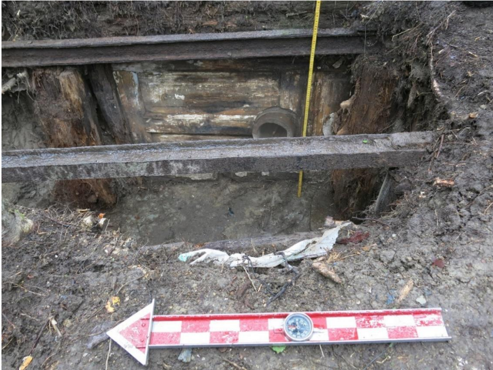
Kuva 18. Latriinirakenne pohjaan kaivettuna. Sodan jälkeen saostuskaivona toimineen käymälän itäseinämän, jota on vahvistettu ovella, lävistää betoninen putki, jonka kautta sinne johdetut vedet valuiivat rantatörmää pitkin jokisuistoon. Puisten pystypaalujen päälle on asetettu metallikiskot, joiden tarkoitus rakenteessa jäi avoimeksi. (Kuva numero 204, Oulun yo, ark.lab.).

Lisäksi pesulaparakin muovisen vesiputken todettiin laskevan suoraan rakenteen sisäpuolelle (kuva 19). Vastaavasti rakenteen rannanpuoleisen seinämän lävisti myöhemmin asennettu ja eristein vuorattu betoniputki, joka tuli ulos rantatörmästä. Rakenteen alkuperäistä funktiota käymälänä epäiltiin pitkään, koska rakenne vaikutti sellaiseksi epätyypilliseltä. Käymäläfunktiolle saatiin kuitenkin varmistus, sillä aivan rakenteen pohjalta paljastui maksimissaan 5 cm paksuinen kerros hienoisesti ulosteelta haisevaa tummaa, likaista savi- ja multamaata. Kerroksesta otettiin maanäyte. Koska kerros oli näin ohut, on rakenteen sisäpuolella todennäköisesti sijainnut jonkinlaiset keruuastiat, kuten esimerkiksi tynnyrit, joihin uloste on kerätty. Tynnyreiden täytyttyä ne on tyhjennetty, jolloin rakenteen sisäpuoli ei ole päässyt täyttymään ulostemassalla. Rakenteen pohjalla ollut ohut kerros lienee syntynyt tynnyreiden ylivuodon seurauksena. Latriinin pohjan likaisen savimaakerroksen lisäksi maanäyte otettiin rakenteen seinämästä.