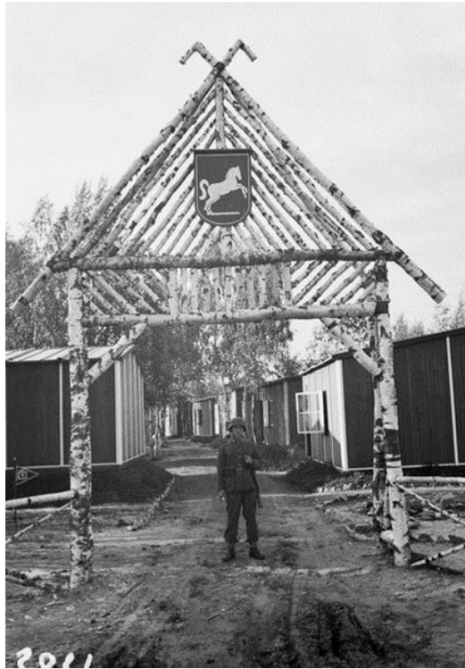
Kuva 2. Saksalainen SS-alppijääkäri Vaakunakylän portilla 1.9.1942.

Niedersachsenlager ) vuonna 1942. Leiri rakennettiin esikunnan sekä vartiokomppanian (1. komppania, pataljoona 18, joka hoiti satamapalvelusta Toppilan satamassa, majoitustarkoituksiin. 4