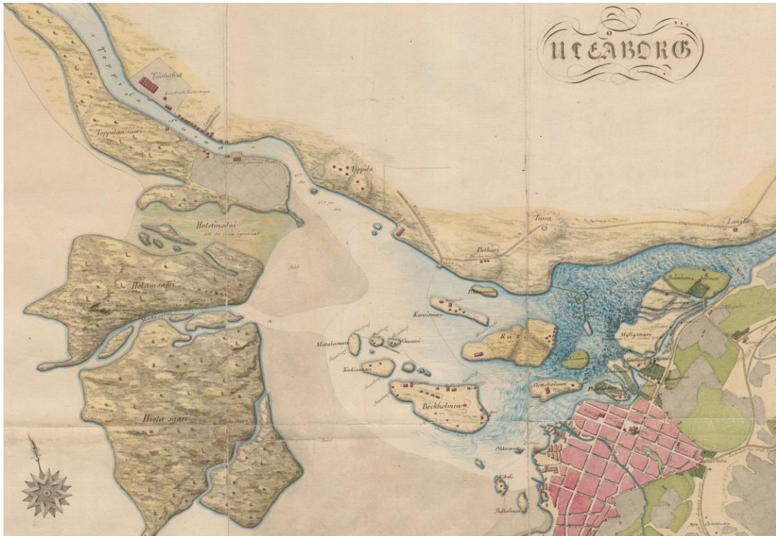
Kuva 1. Ote Nymanssonin vuonna 1804 laatimasta Oulun asemakaavakartasta, jossa on kuvattuna myös kaupungin lähisaaret. Jo tuolloin Hietasaarena (vasemmalla) tunnettu alue sijoittui Mustasalmen eteläpuolelle. Vaakunakylän alue sijoittui silloiselle Holstinsaarelle ollen suurimmaksi osaksi vielä veden alla. (Lähde: KA, Nymanssonin kertomuksen kartat < http://digi.narc.fi/digi/view.ka?kuid=20761167 >).

laidunmaana. 2 Kun Toppilansalmen tervahovi paloi vuonna 1901, rakennettiin uusi Hietasaaren Hartaanselän puoleiselle itärannalle. Paikka ei kuitenkaan ollut ideaalinen tervahoville ja se siirrettiin jo muutaman vuoden päästä takaisin Toppilansalmen pohjoispuolelle. Vaakunakylän alue tunnettiin tuolloin Kraakkulana ja Raakkulana. 3