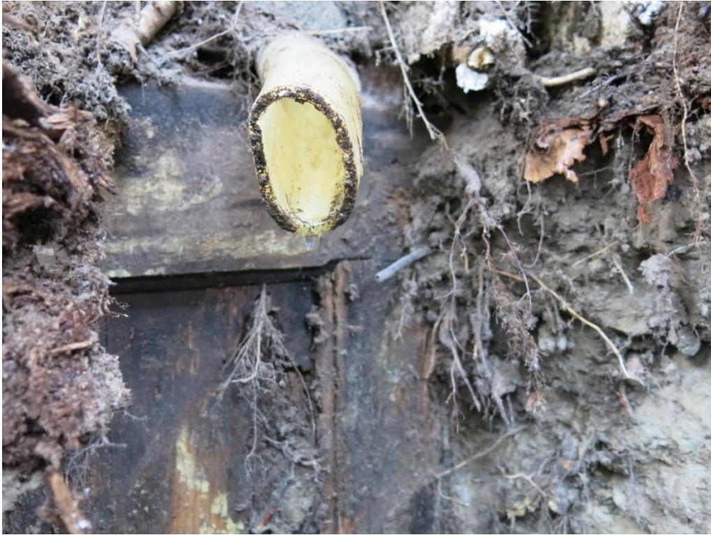
Kuva 19. Pesulaparakin muovinen poistoputki oli johdettu latriinin sisäpuolelle (kuva numero 215, Oulun yo, ark.lab.).

Sodan jälkeisten muokkausten perusteella rakenne ei siis ole toiminut käymälänä elinkaarensa loppuun saakka. Koska pesulaparakin poistovesiputki oli johdettu rakenteeseen ja rakenteeseen oli lisätty veden betoninen ulostuloputki, voidaan käymälä tulkita muutetun jonkinlaiseksi alkeelliseksi harmaan veden eli kotitaloudessa syntyvien jätevesien saostuskaivoksi. Kaivoon on kerätty pesulaparakissa syntyneet pesuvedet, josta ne on edelleen johdettu Oulujokeen. Tulkintaa näyttäisi tukevan käymälän täyttömaasta löydetty Itä-saksassa valmistetun vaatteen pesulappu. Pesulapun löytyminen vahvistaa myös tulkintaa siitä, että pesulaparakki on pysynyt vaatteiden pesupaikkana myös sodan jälkeisellä ajalla.