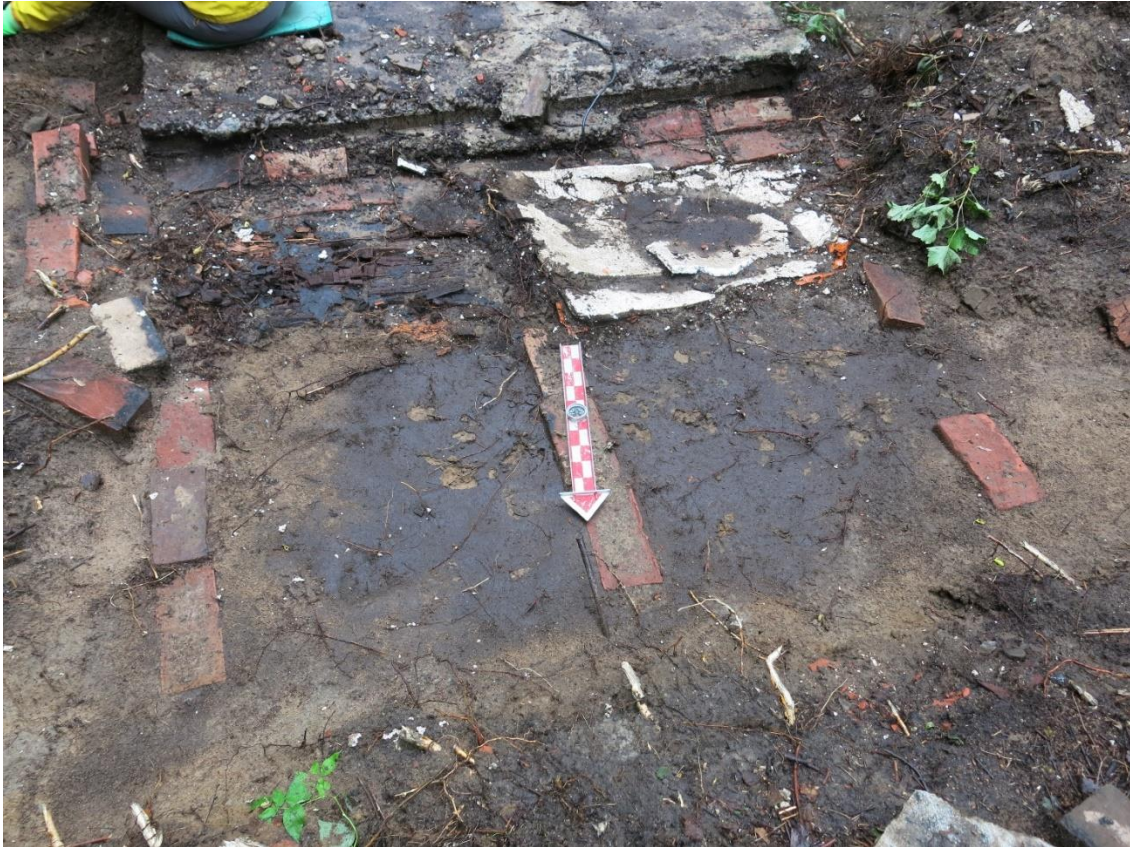
Kuva 15. Betonilaatan pohjoispuolella oli tili- ja puurakenteita, joiden päällä oli tervapaperia, styroksia ja muovia (kuva numero 71, Oulun yo, ark.lab.).

Esiin tulleen betonilaatan takia rakennetta luultiin aluksi jonkinlaiseksi tulisijaksi. Vaakunakylän vuoden 1942 asemakaavan mukaan paikalla sijaitsi kuitenkin parakki nro 12, joka oli saksalaisten vaatevarasto ja käsinpesula (saks. bekleidung kammare – handwächse stube ). Parakin pohjan luonne pesulana hahmottui sitä mukaan, kun rakennetta saatiin kaivettua esille. Betonilaatan kohdalla lienee ollut parakin märkätila eli paikka, jossa vettä käsiteltiin. Kohdassa lienee sijainnut jonkinlainen pesutynnyri- tai -palju ja mahdollisesti muuripata, jossa vettä on lämmitetty. Betonilaatan halki kulki kouru, joka ohjasi pyykinpesussa syntyneet likavedet ulos rakennuksesta (kuva 16). Rakenteen esiin kaivettu koko oli 3,6 x 5,2 m eli noin 19 m 2 . Tundra-parakkien koon tiedetään olleen kooltaan 6,5 x 6,9 m eli noin 45 m 2 , minkä perusteella pesulaparakin alkuperäisestä koosta saatiin esille noin puolet. Betonilaatan alla kulki sähköjohto, jonka perusteella rakennuksessa on ollut sähköt heti sen rakentamisesta lähtien.