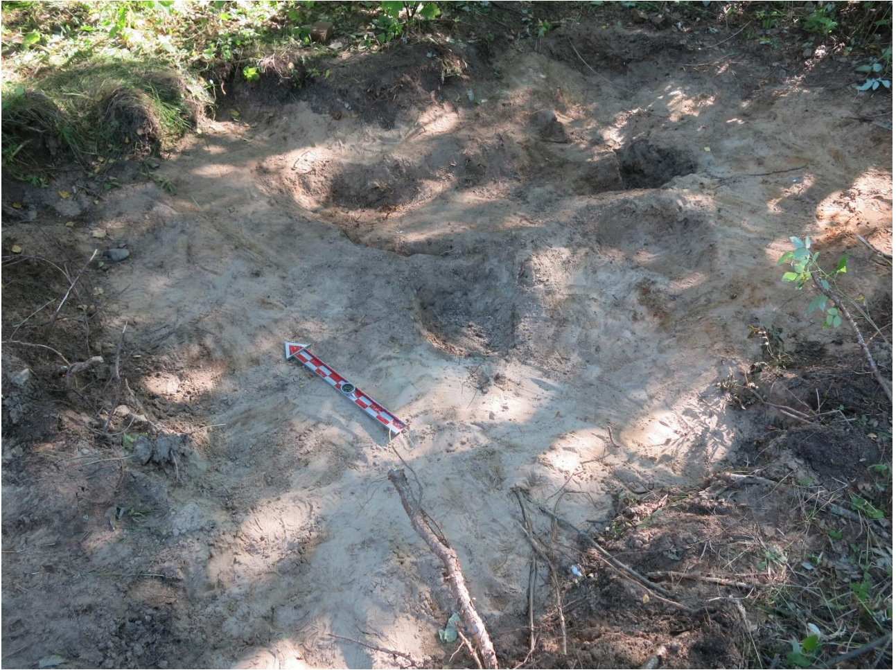
Kuva 7. "Huussi 1" kuvattuna koilliseen päin (kuva numero 30, Oulun yliopisto, ark. lab.).