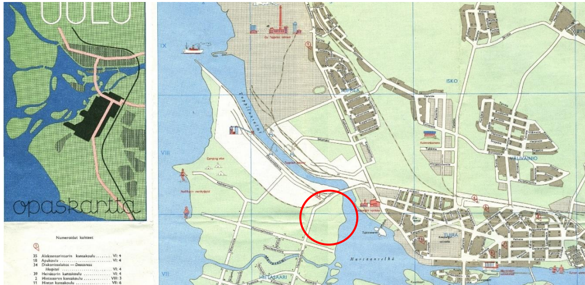
Kuva 6. Ote Oulun opaskartasta vuodelta 1961. Vaakunakylä on merkattu tyhjäksi puistoalueeksi. Ei mittakaavassa.