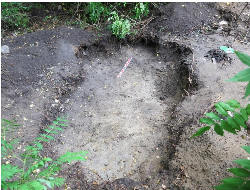
Kuva 10. Kuoppa 10 pohjaan kaivettuna (kuvannumero 160, Oulun yo, ark.lab.).

Kuoppa 10 sijoittui Vaakunakylän eteläosaan, Vaakunakylän satamaan johtavan autotien länsipuolelle (karttaliite 1). Kohdassa näkyi maanpinnalle korkeahko kumpu, jota epäiltiin ennen avaamista parakin perustukseksi. Kaivinkoneella kaivettaessa kohouma osoittautui puhtaaksi hiekaksi, eikä perustuksia havaittu. Kohouman vieressä näkyi kuitenkin maanpinnalle roskaa, jonka perusteella kohta avattiin koneellisesti ja nimettiin jätekuopaksi 10. Koska jätemateriaali sijaitti laajalla ja matalalla alueella, on kyseessä kuitenkin todennäköisimmin tunkio kuin jätekuoppa. Jätekuopasta 10 otettiin maanäyte, jossa oli sekaisin palaneita, saksankielisen sanomalehden tai kirjan sivuja ja muuta orgaanista materiaalia.