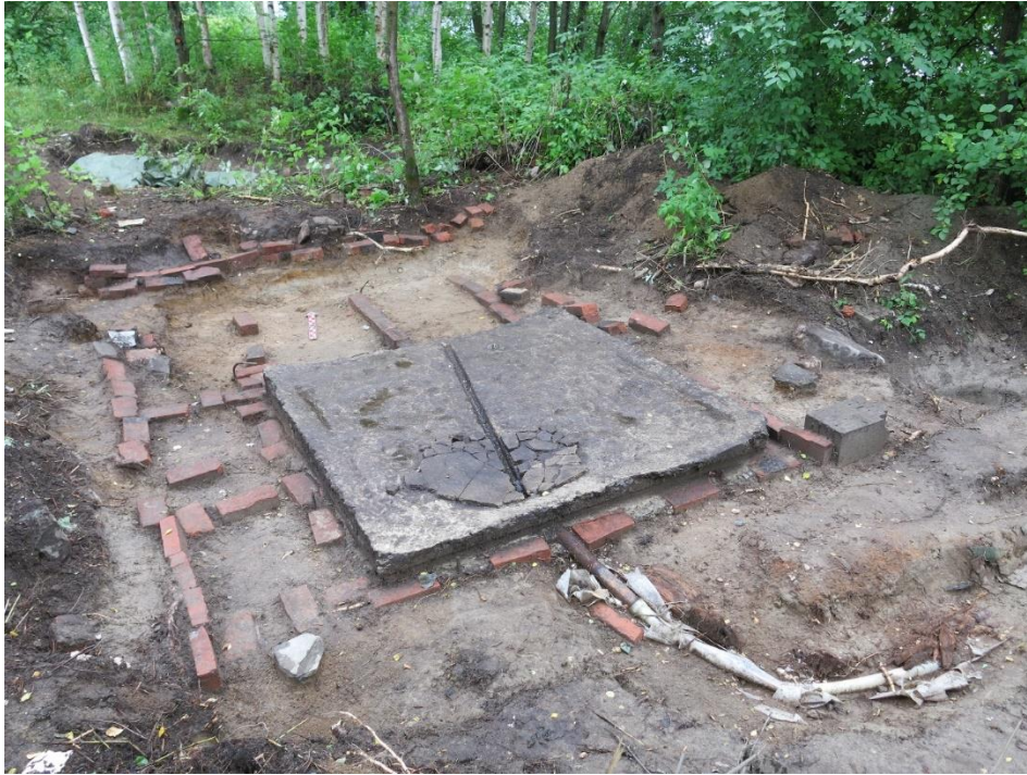
Kuva 16. Yleiskuva pesulaparakin jäännöksistä. Keskellä betonilaattaa kulkee vesikouru, jonka ulostuloon on asennettu rautaputki ja myöhemmin muoviputki (kuva numero 163, Oulun yo, ark.lab.).

Kourun ulostulossa, rakenteen eteläpäässä sijaitsi rautaputki, jota oli jatkettu pitkällä, maan sisään kaivetulla muovisella putkella. Muovinen poistoputki oli eristetty kattohuovalla, puulla ja muovilla. Myöhemmin rakennukselle tehtyjen muokkausten perusteella parakkia on käytetty samankaltaisena märkätilana sodan jälkeenkin. Kaivauksilla vierailleen entisen Vaakunakyläläisen muistin mukaan paikalla oli sijainnut saunan vielä aivan alueen loppuaikoina. On mahdollista, että entinen pesula on muutettu myöhemmin saunaksi, vaikkakin sodan jälkeisten asukkaiden tiedetään rakentaneen myös kokonaan uusia saunoja alueelle. Vuoden 1942 asemakaavan mukaan saksalaisten sauna sijaitsi kuitenkin Vaakunakylän alueen eteläosassa parakissa nro 22.