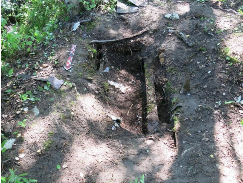
Kuva 17. Metallikuoppa pintapuhdistuksen jälkeen. Rakenteen pinnassa näkyvät kaksi uusiokäytettyä rataakiskoa (kuva numero 41, Oulun yo, ark.lab.).

erikoiselta käymäläksi. Rakennetta paljastettiin pintamaista ensin käsin, mutta koska maa oli kovaa ja siinä oli erittäin runsaasti kasvien juuria, poistettiin maata myös koneellisesti. Kun rakenteen reunat saatiin hahmotettua, alettiin sen sisäpuolista tilaa tyhjentää lapioin ja lastoin täyttömaasta. Rakenne oli täytetty hyvin sekalaisessa maa-aineksella ja purkujätteellä, jossa oli seassa suuria paloja muovia, eristevillaa, styroksia ja kattohuopaa. Rakenteen itäreunalta löytyi myös rikkinäinen lapio. Lisäksi täyttömaassa oli kivikuopan tavoin myös joitakin vanhempia löytöjä, kuten piikiveä sekä yksi valkosaviipin katkelma. 22