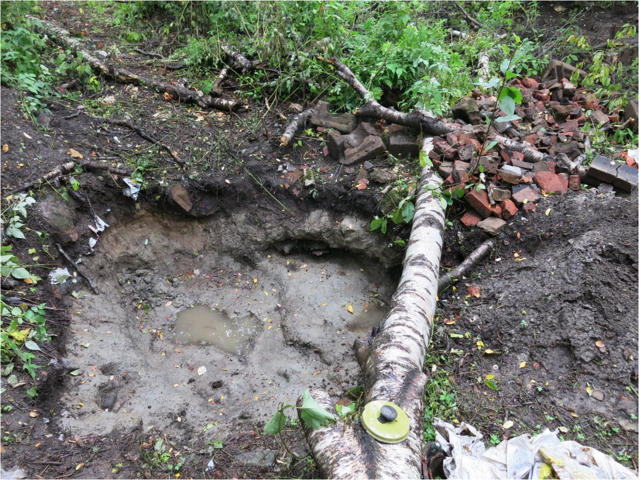
Kuva 9. Jätekuoppa 6 pohjaan kaivettuna sekä täytön tiilimateriaalia (kuva numero 187).

Kuoppa 7, joka sijaitti kuopan 6 vieressä, oli halkaisijaltaan 1,4 metriä ja syvyydeltään noin 60 cm. Kuoppa 8 sijoittui kuopan 7 itäpuolelle ja oli halkaisijaltaan 1,5 metriä ja syvyydeltään noin 60 cm. Kuopat oli täytetty jätekuopan 6 tavoin elintarvikepakkausten jäännöksillä ja muulla käyttötavaralla. Erityisenä löytönä voidaan mainita kuopasta 8 talletetut C-kasettien kuoret, jotka näyttäisivät tekstiensä perusteella ajoittuvan vuoteen 1972.