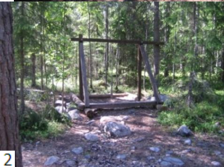
1. Lintulava 2. Seikkailumaa