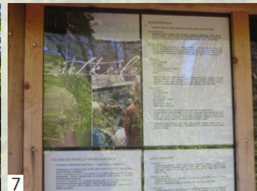
3.Huutilampi 4.Lehtomaista kangasta 5.Nuotiopaikka, jossa puuliiteri ja ruokailukatos 6.Luontopolulla 7.Vinkkejä retkeilyyn