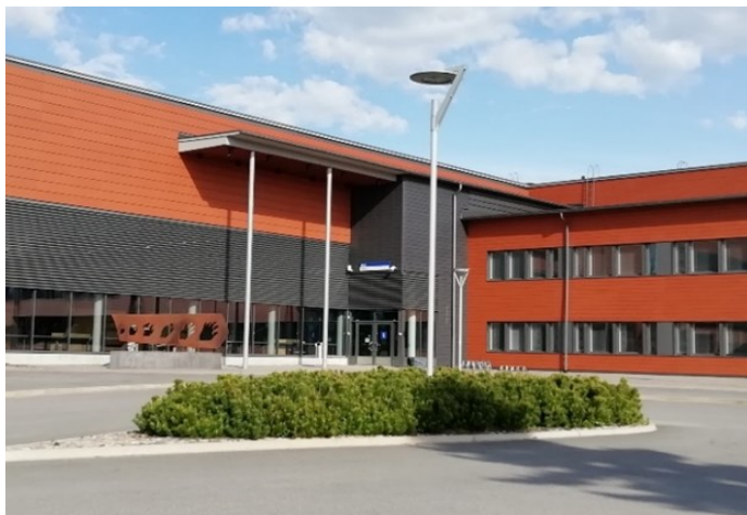
Haukiputaan ammattilukio, Haukipudas