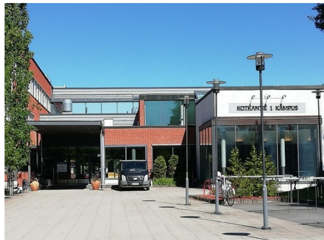
Oulun ammattilukio, Kaukovainio