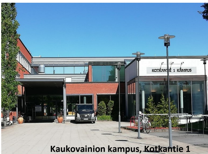
Kaukovainion kampus, Kotikantie 1