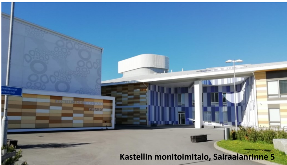
Kastellin monitoimitalo, Sairaalanrinne 5