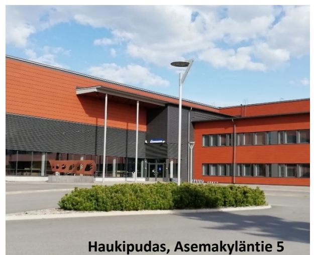
Haukipudas, Asemakyläntie 5