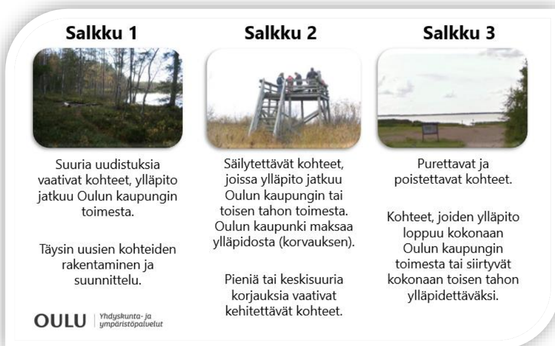
Kuva 1. Työsalkut.

Työsalkut tarkoittavat käytännössä seuraavia toimenpiteitä kohteiden osalta: