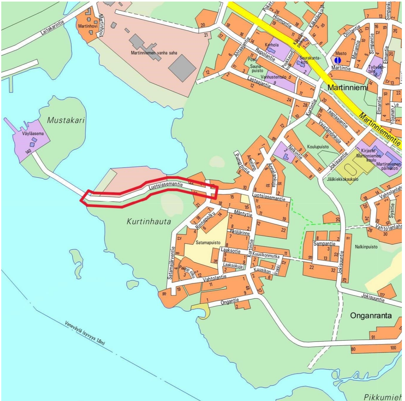
Kuva 1. Suunnittelualueen rajaus opaskartalla