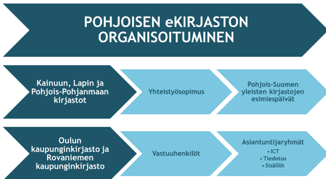
Kaavio 2. Pohjoisen eKirjaston organisoituminen.

Alueen kirjastojen henkilöstö ja asiakkaat osallistuivat Pohjoisen eKirjaston rakentamiseen. Hankkeen kantavana ajatuksena oli moniportainen yhdessä kehittäminen, verkostomaisen toimintatavan luominen ja asiakkaiden ja henkilöstön osallistaminen. Hankkeessa onnistuttiin luomaan aktiivista yhteistyötä ja keskustelukulttuuria Kainuun, Lapin ja Pohjois-Pohjanmaan alueen yleisten kirjastojen välille. Kainuun, Lapin ja Pohjois-Pohjanmaan kirjastojen henkilöstölle järjestettiin laaja kysely, jolla kartoitettiin muun muassa e-aineistopalveluiden käyttökokemuksia, sitä minkä e-aineistojen tarjoaminen nähtiin tärkeänä ja mitä uudelta laajemmalla yhteistyöltä odotettiin. Kirjastojen asiakkaita osallistettiin Pohjoisen eKirjaston palveluvalikoiman ja sisältöjen muodostamiseen Tonnin palikat -työpajoilla. Työpajoja järjestettiin alueen kirjastoissa ja asiakkaiden vastaukset koostettiin arvioitavaksi. Pohjoisen eKirjaston rakentamisessa mukana olleen verkoston kokemuksia yhdessä kehittämisestä ja työskentelystä kartoitettiin hankkeen aikana kahdella kyselyllä. Yhdessä kehittämiseen osallistui kyselyiden, työpajojen, tiedotustapahtumien ja asiantuntijatyöryhmien kautta satoja Kainuun, Lapin ja Pohjois-Pohjanmaan kirjastojen asiakkaita ja henkilöstön jäseniä. Yhdessä kehittämisestä saatuja tuloksia hyödynnettiin Pohjoisen eKirjaston ylläpitomallin rakentamisessa ja e-palveluvalikoiman ja sisältöjen valinnassa.