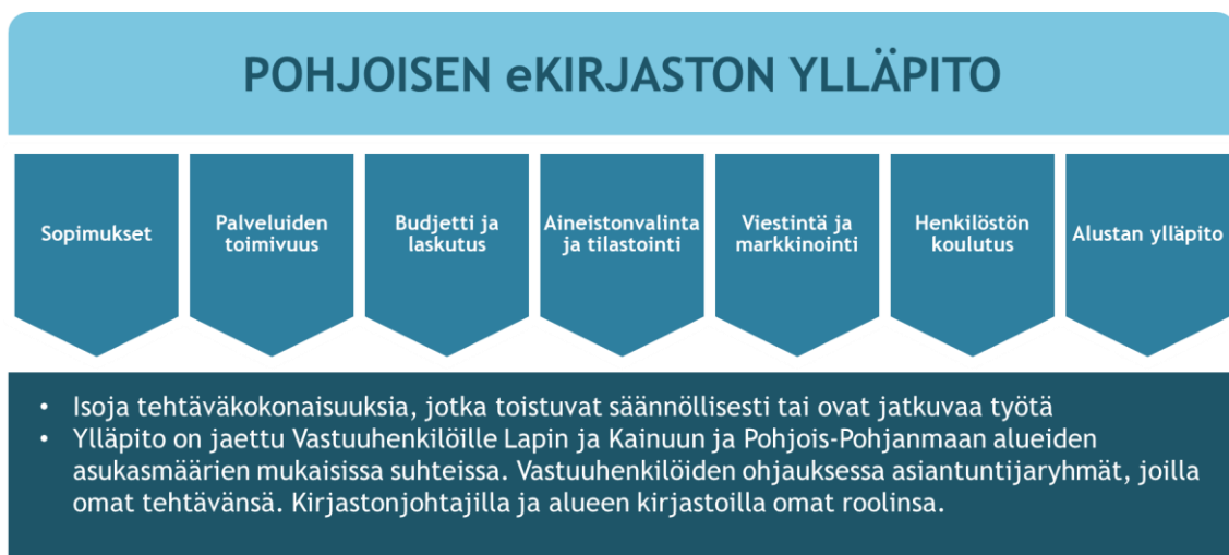
Kaavio 3. Pohjoisen eKirjaston ylläpito.

yhteiset päätökset, kuten palvelukokonaisuuden valinta ja budjetin vahvistaminen tehdään yhdessä vuosittain järjestettävillä Pohjois-Suomen yleisten kirjastojen esimiespäivillä. Oulun kaupunginkirjasto ja Rovaniemen kaupunginkirjasto organisoivat ja koordinoivat Pohjoisen eKirjaston toimintaa Yhteistyösopimuksella annetun valtuutuksen pohjalta. Kummastakin kirjastosta on nimetty vastuuhenkilö, joilla on päävastuu eKirjaston ylläpidosta. Vastuuhenkilöiden ohjauksessa toimii kolme asiantuntijaryhmää, jotka ovat ICT-ryhmä, Tiedotusryhmä ja Sisällöt-ryhmä. ICT-ryhmä vastaa muun muassa Pohjoisen eKirjaston Finna-alustan ylläpidosta ja kehittämisestä ja e-palveluiden teknisestä toimivuudesta. Tiedotusryhmä koordinoi ja tarjoaa kirjastoille tukea e-palveluiden markkinointiin. Sisällöt-ryhmä tekee e-aineistopalveluiden keskitettyä aineistonvalintaa kuunnellen alueen toiveita ja osallistuu myös e-aineistojen tilastointiin ja budjetin seurantaan. Kaikissa asiantuntijaryhmissä on jäseniä yhteistyöalueen eri kirjastoista ja kimpoista.