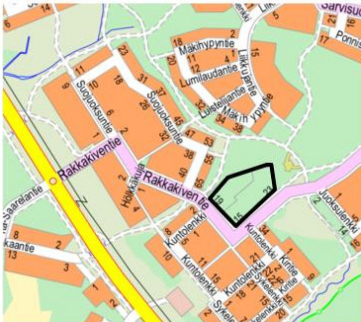
Kuva 1. Kaavamuutosalue

Tämä meluselvitys on laadittu Oulun kaupungin tilauksesta Kivikkokankaan kortteliin 15-23 asemakaavamuutosta varten. Selvityksen tavoitteena oli määrittää liikenteestä aiheutuvat melutasot alueella ja arvioida meluntorjunnan tarpeet suunnittelualueella (kuva 1).